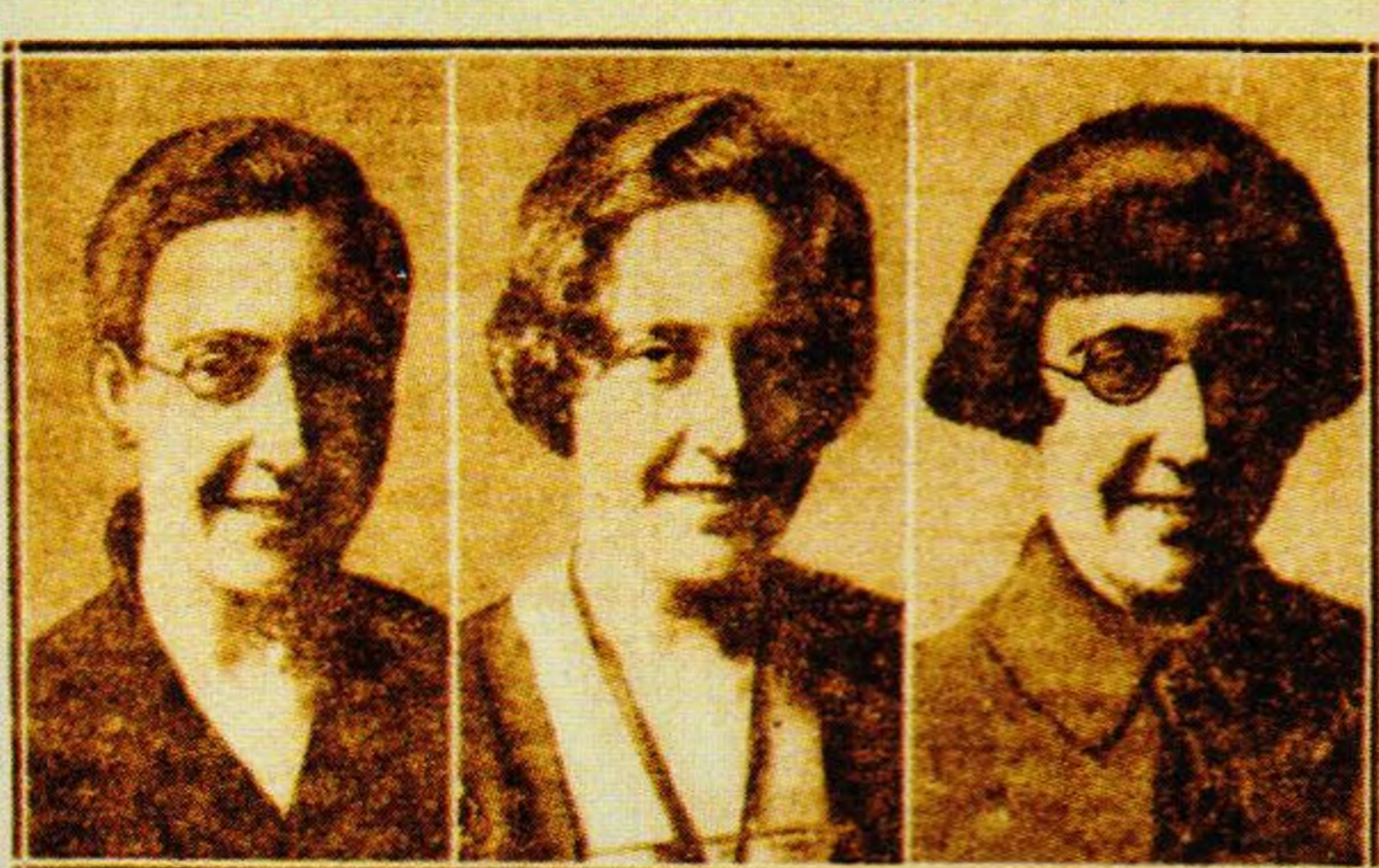
MRS. CHRISTIE DISGUISED.

Nejtajemnější zmizení slavných spisovatelů