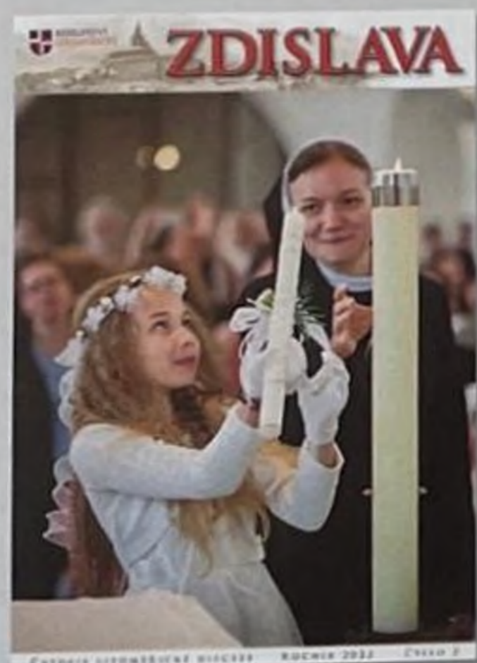
Na obálce: První svaté přijímání v Liberci-Ruprechticích