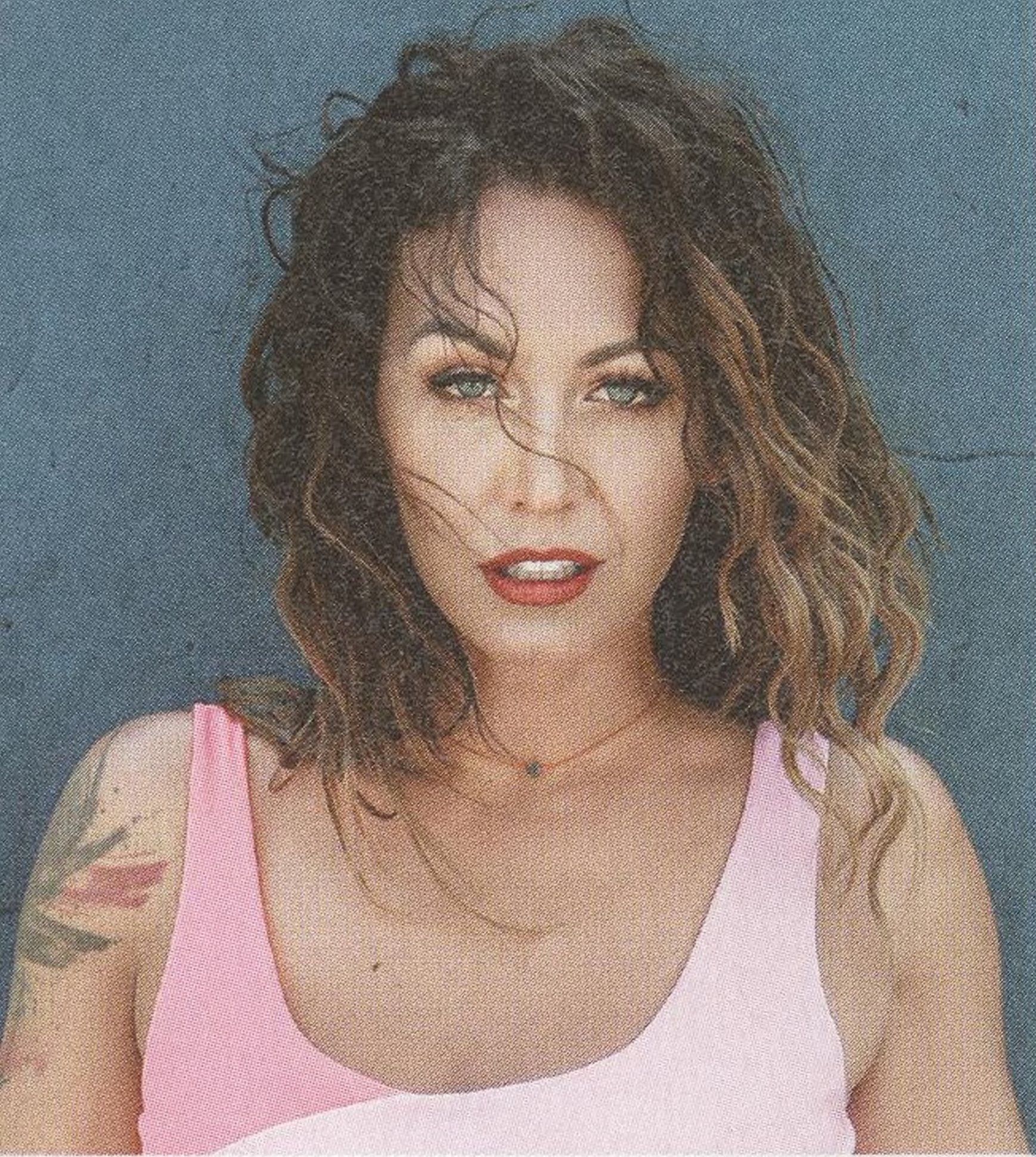
AGÁTA HANYCHOVÁ influencerka, modelka