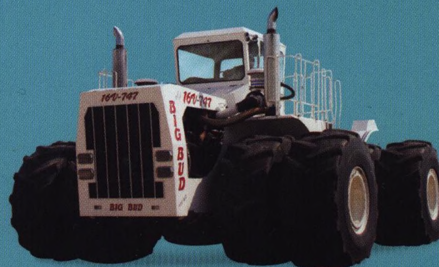
Obří traktor 22