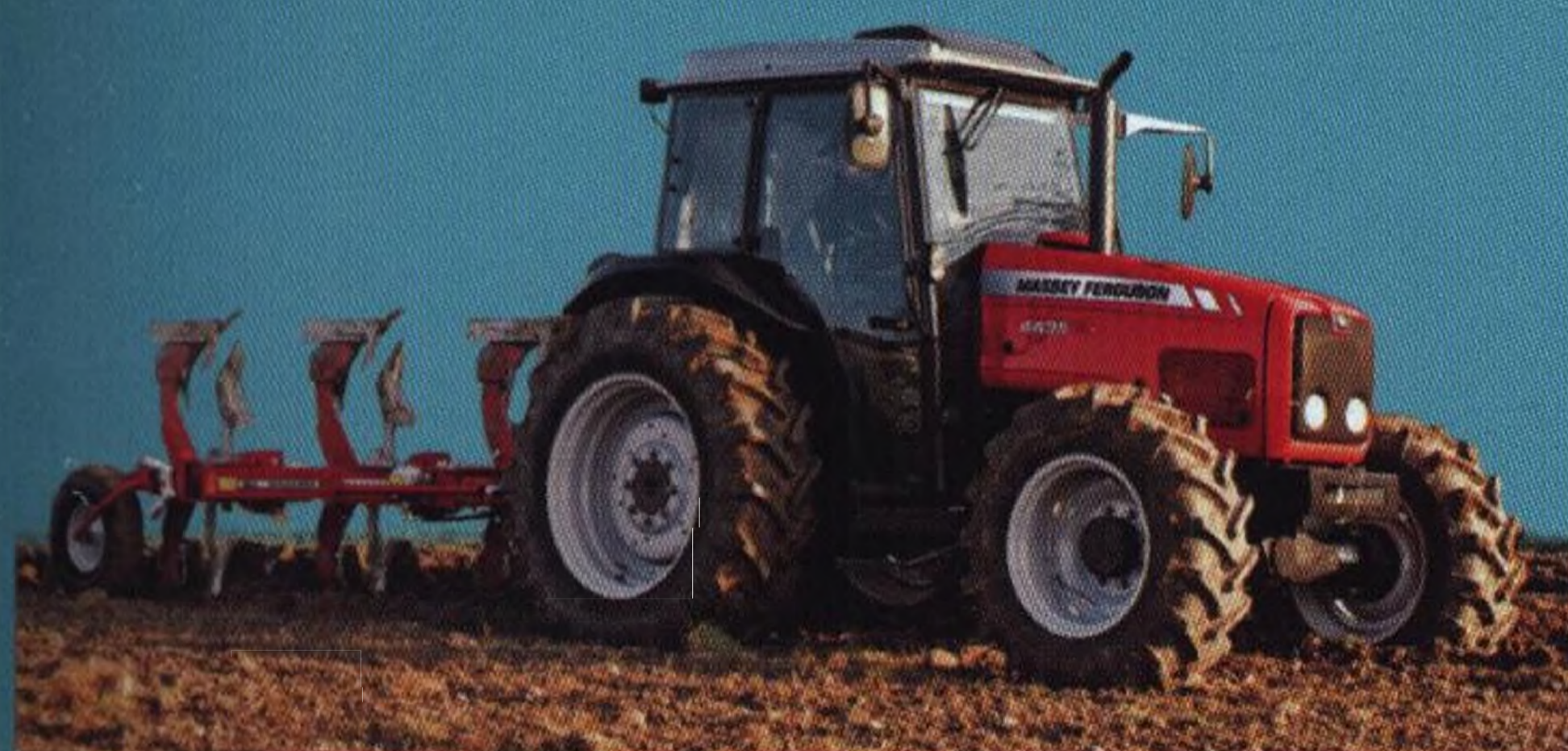
Traktory a pluhy 10