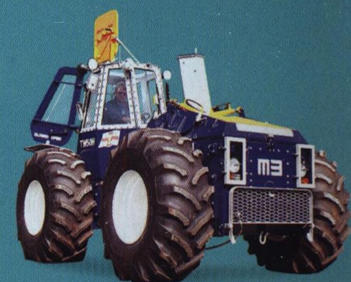
Záchranářské stroje 2