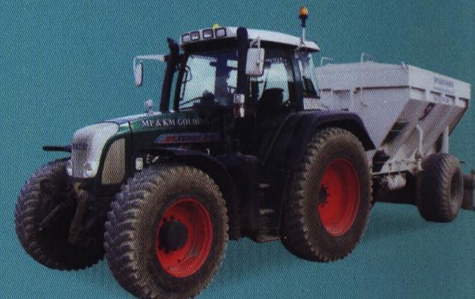
Stavební traktory 28