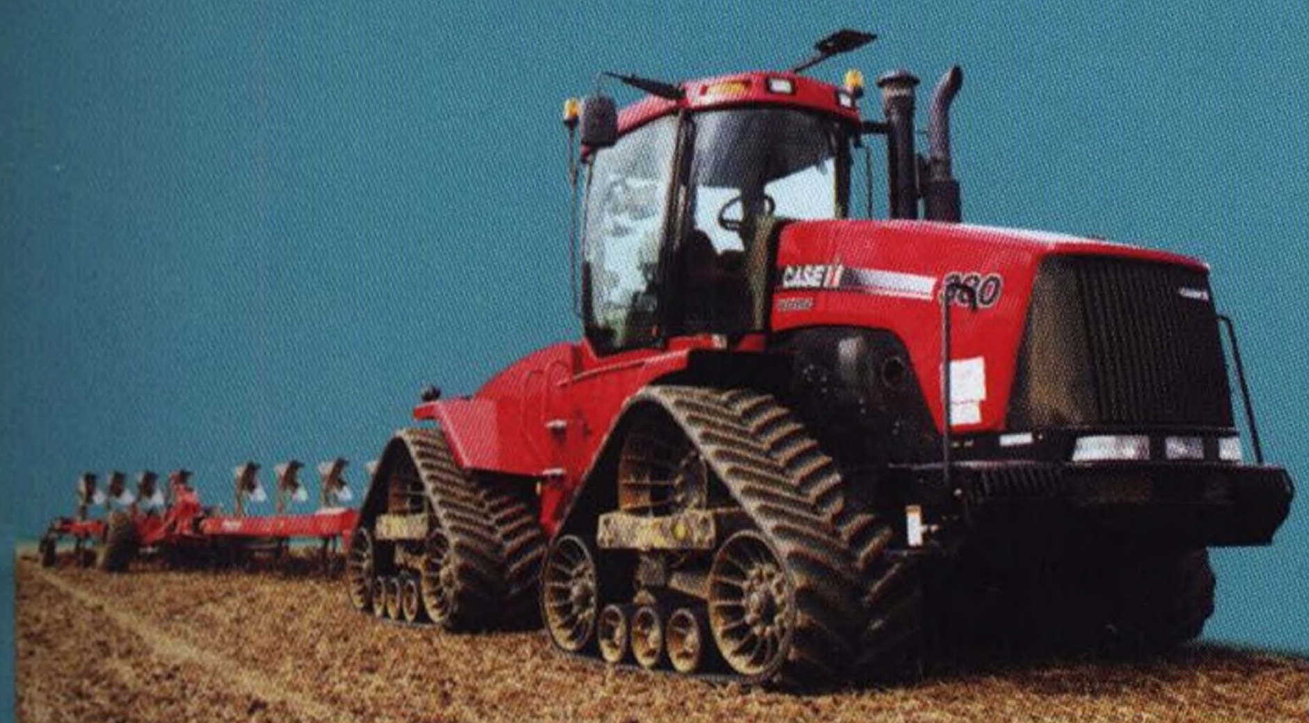
Pásové traktory 6