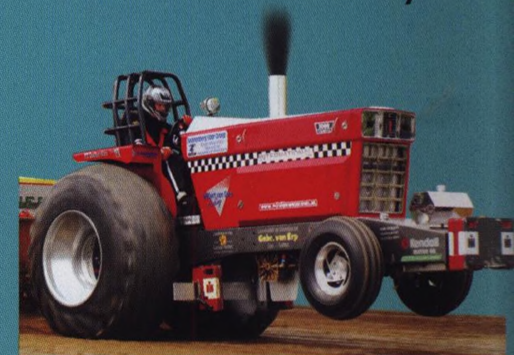
Závodní traktory 30