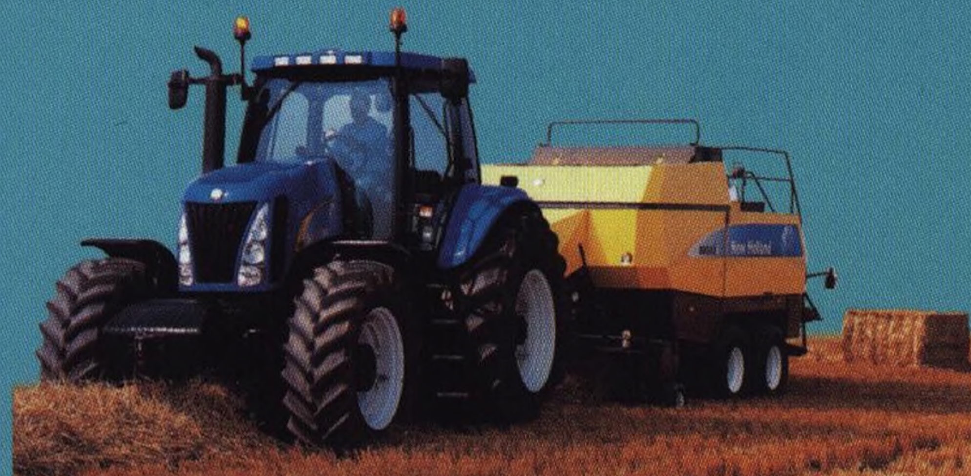
Svinovací lisy 18