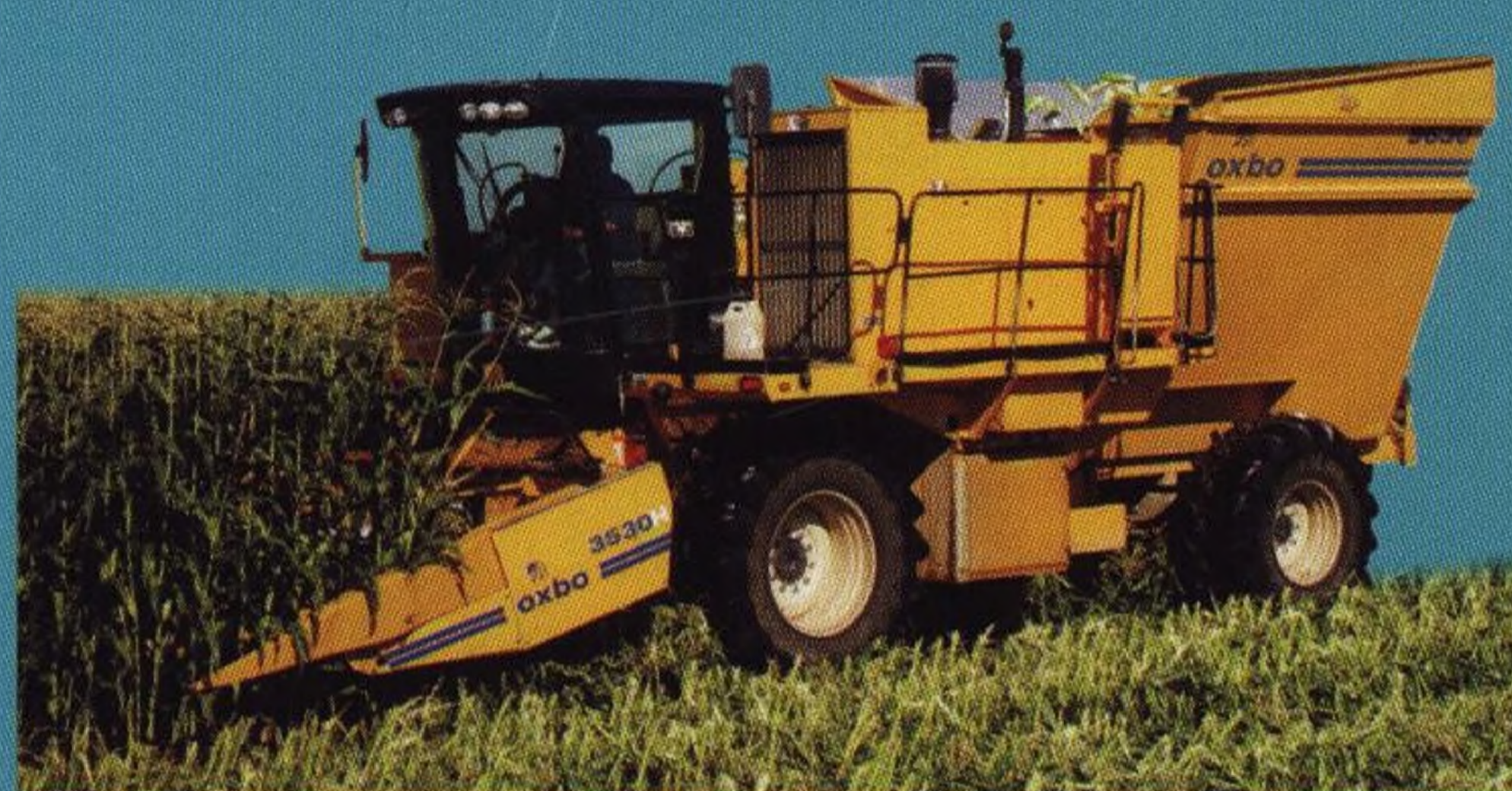
Stroje na sklizeň zeleniny 16