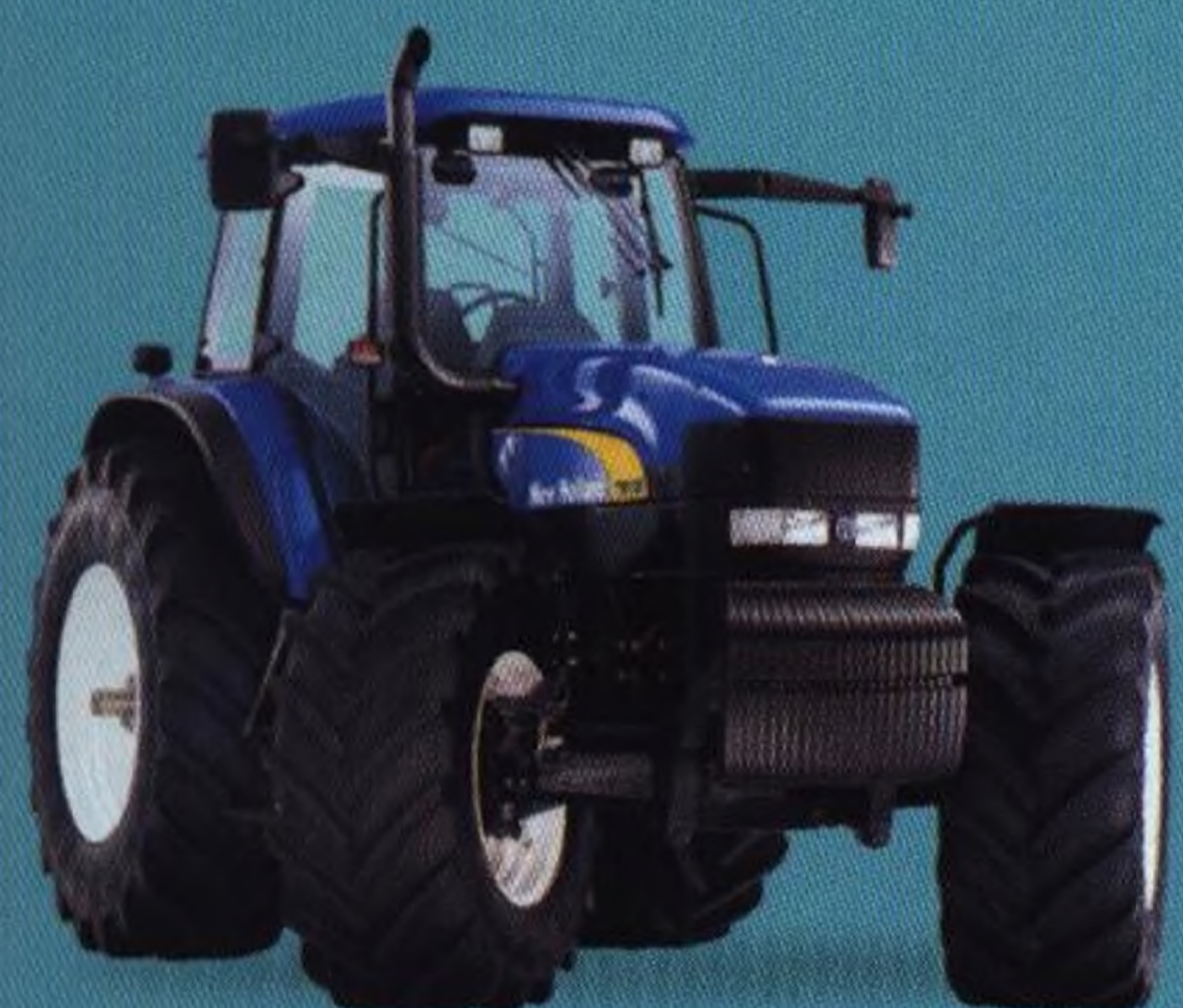
Traktory v zemědělství 4