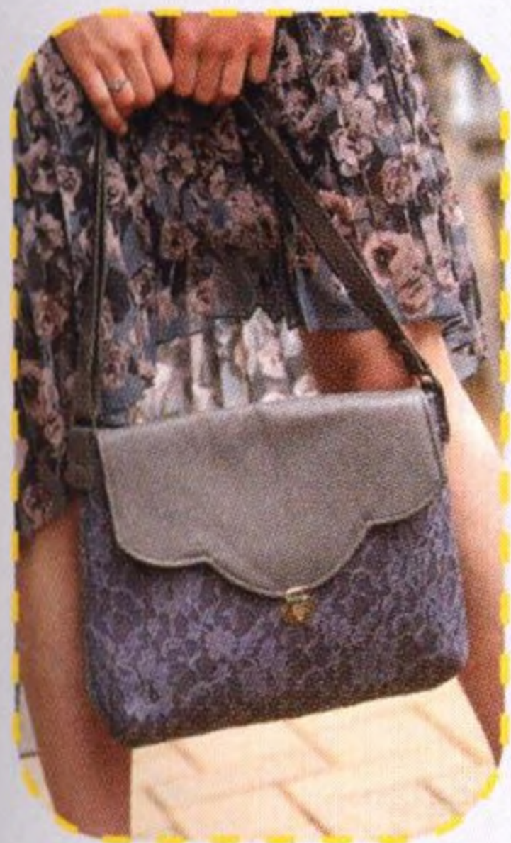
Elegantní kabelka 78