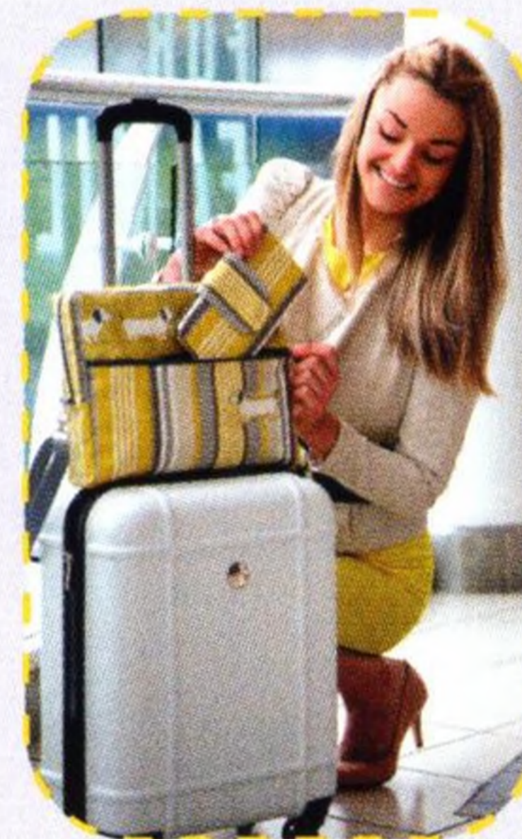
Kabelka do první třídy 68