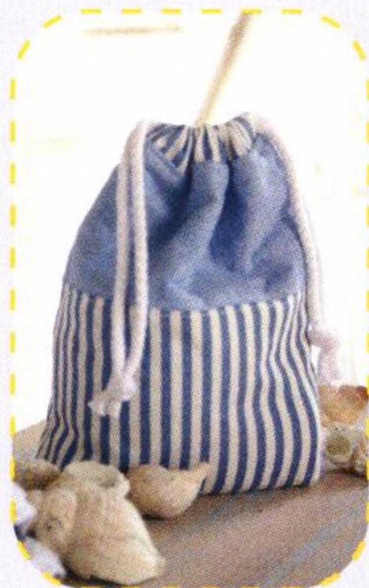
Námořnický vak 38