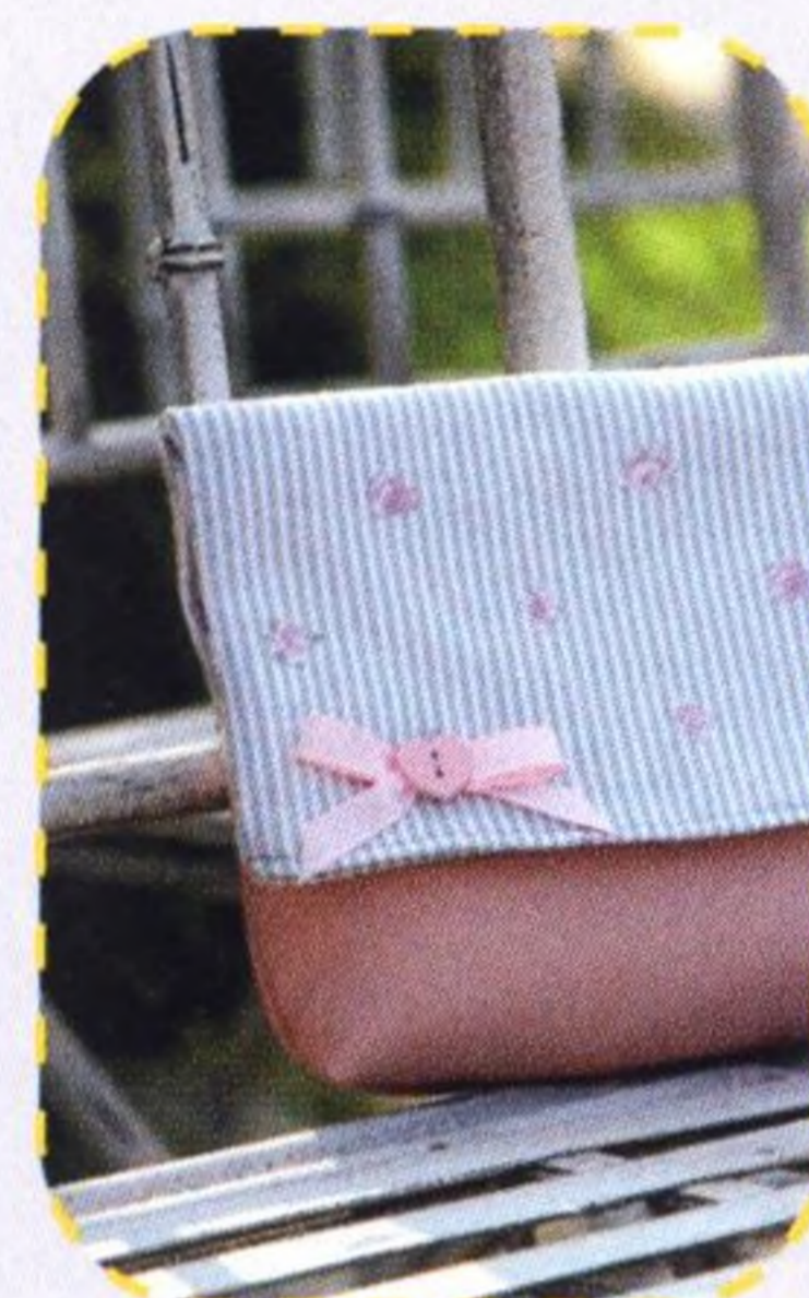
Malá výletní kabelka 54