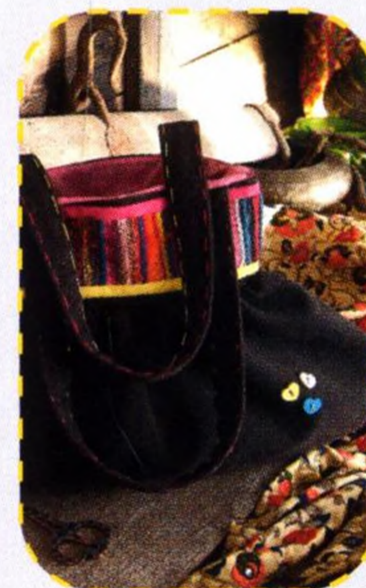
Kabelka z kroucených nití 112