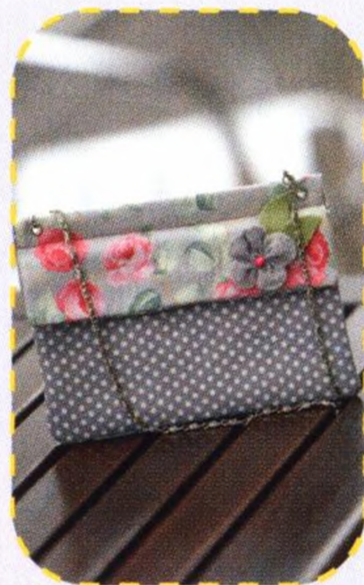
Koktejlové psaníčko 90