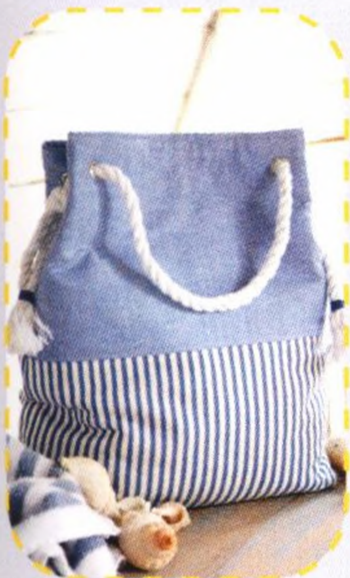
Námořnická taška 34