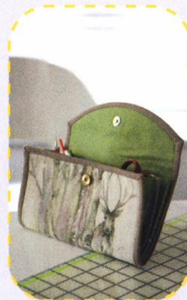
Víceúčelové psaníčko 98