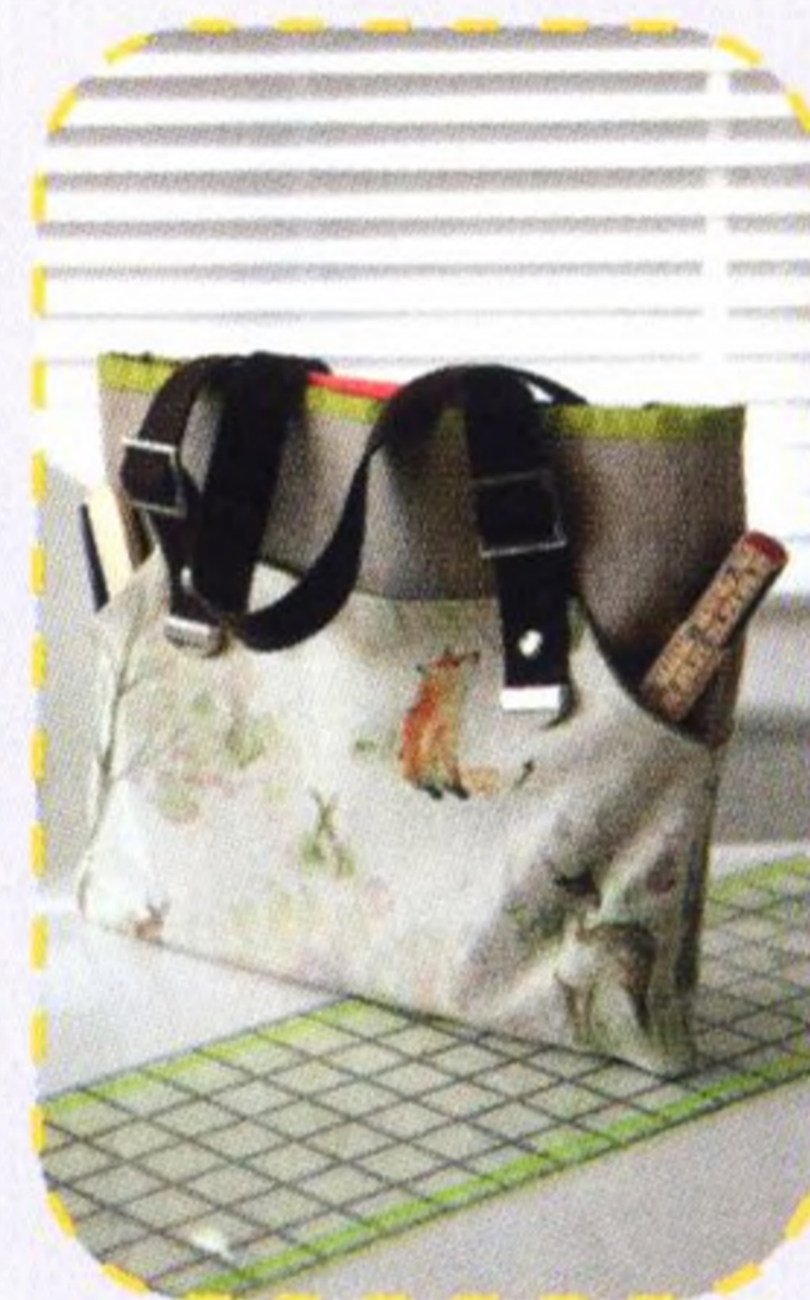
Víceúčelová kabelka 94