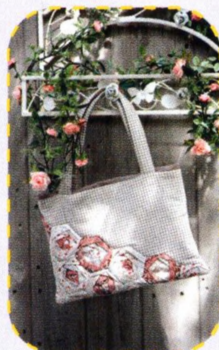
Kabelka s květinovým vzorem 104