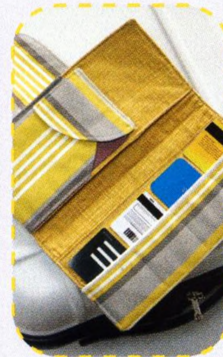
Psaníčko do první třídy 74