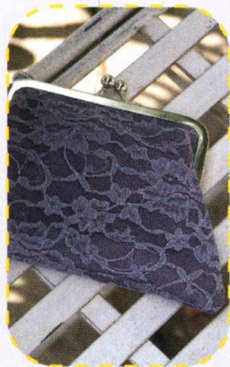
Elegantní psaníčko s rámečkem 83