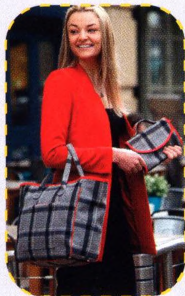
Business kabelka 58