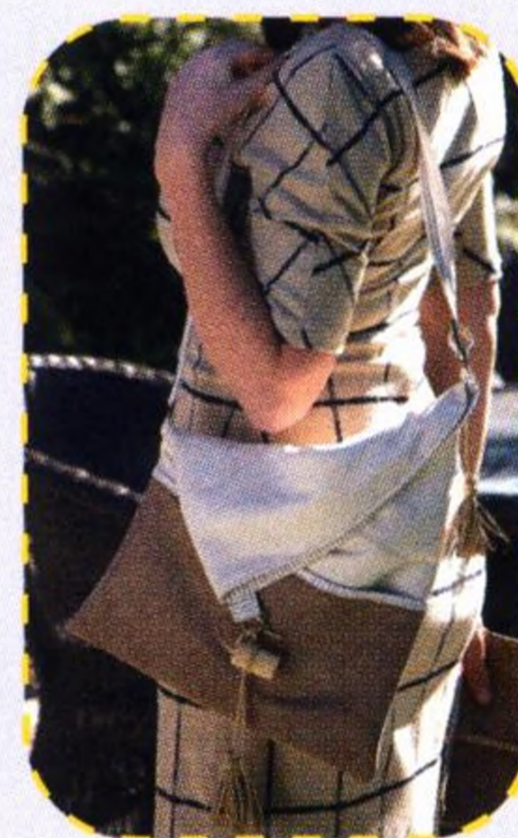
Volnočasová kabelka se štrápci 26