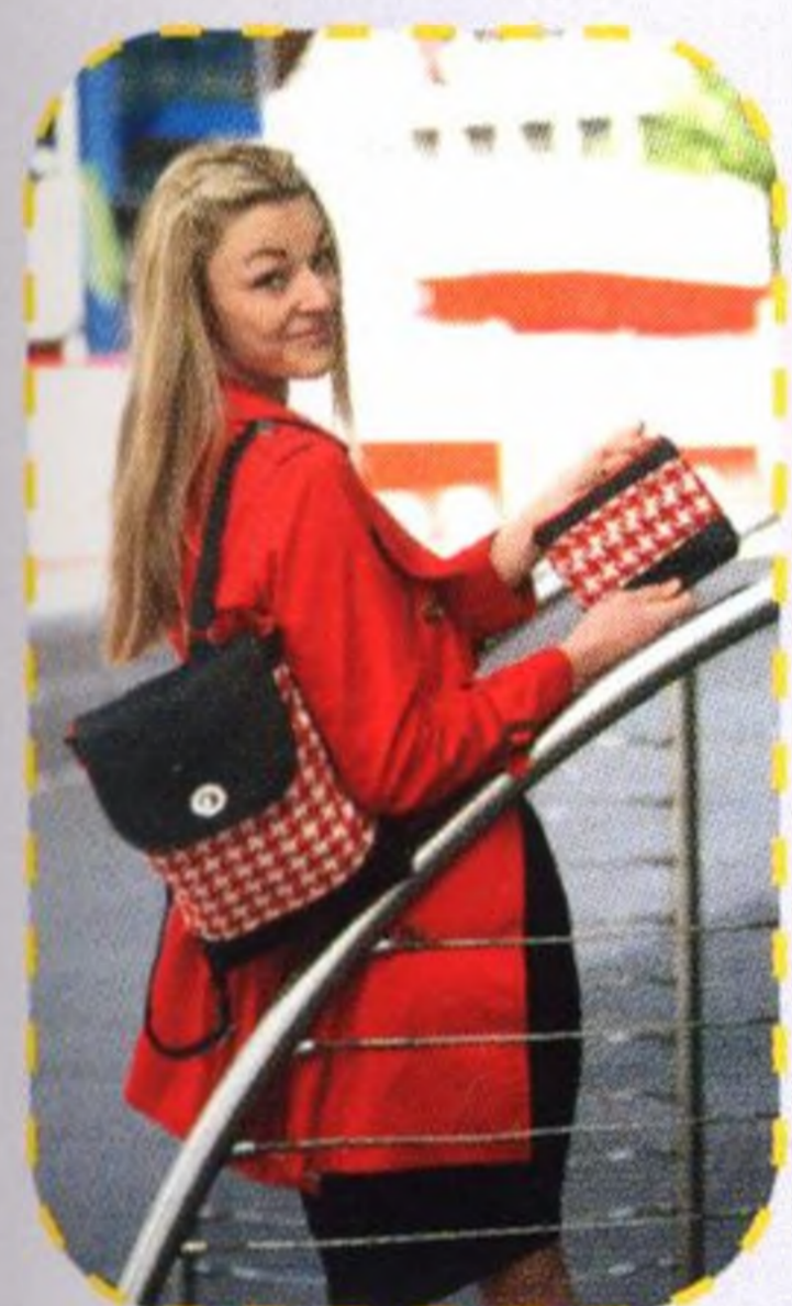
Batůžek na cesty 120