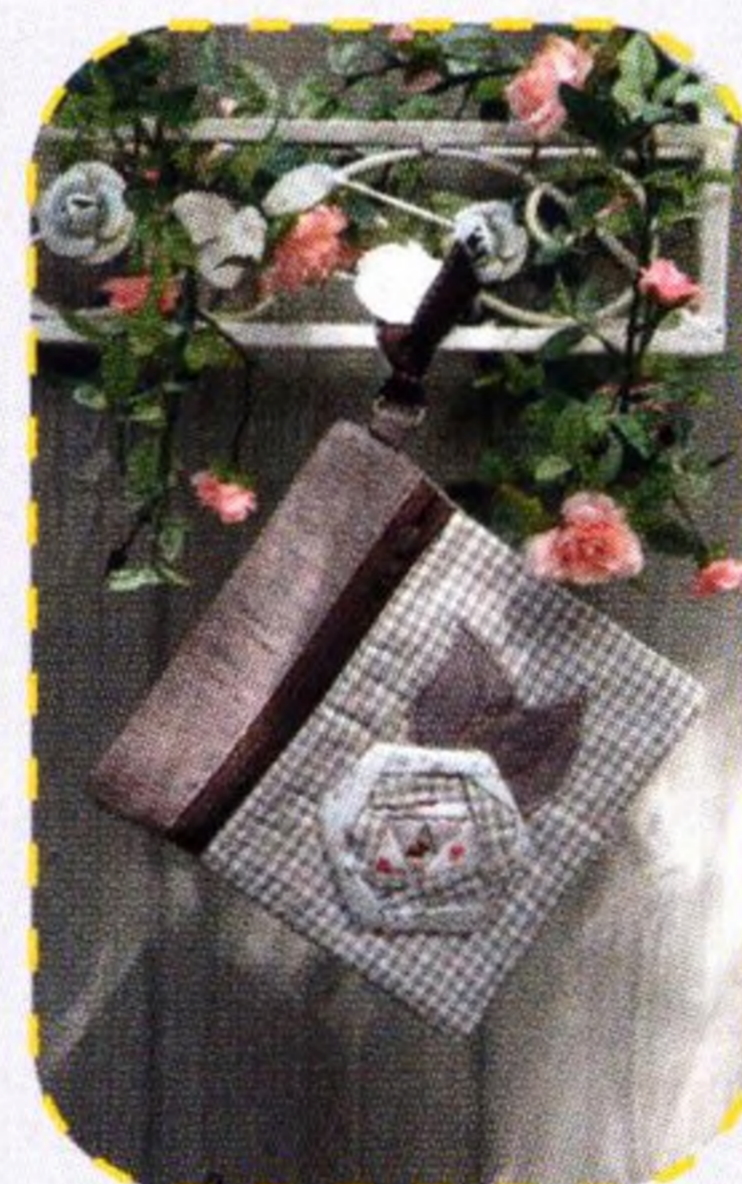
Psaníčko s květinovým vzorem 108