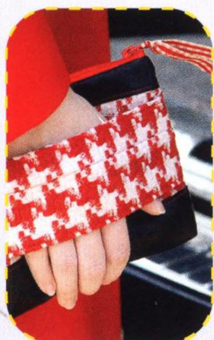
Psaníčko na cesty 125