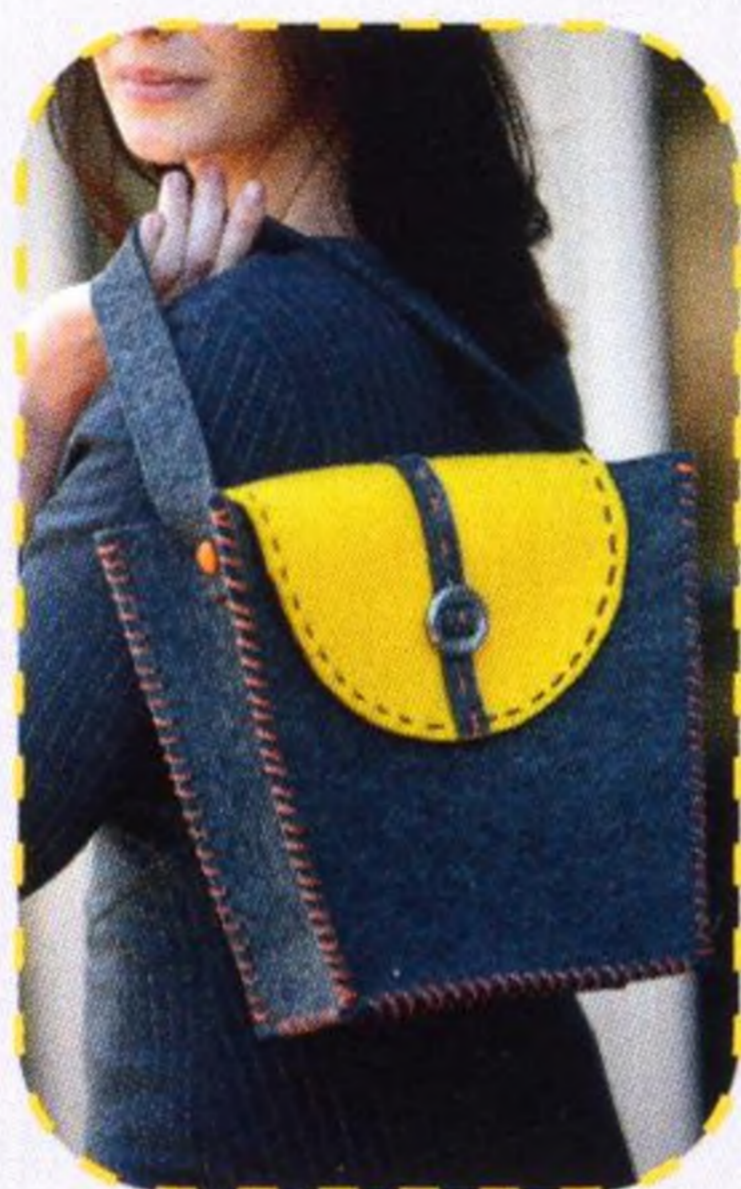
Kabelka do města 40