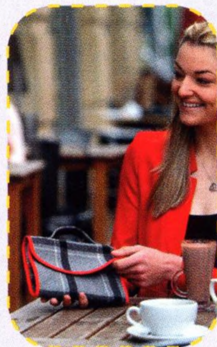
Business psaníčko 64