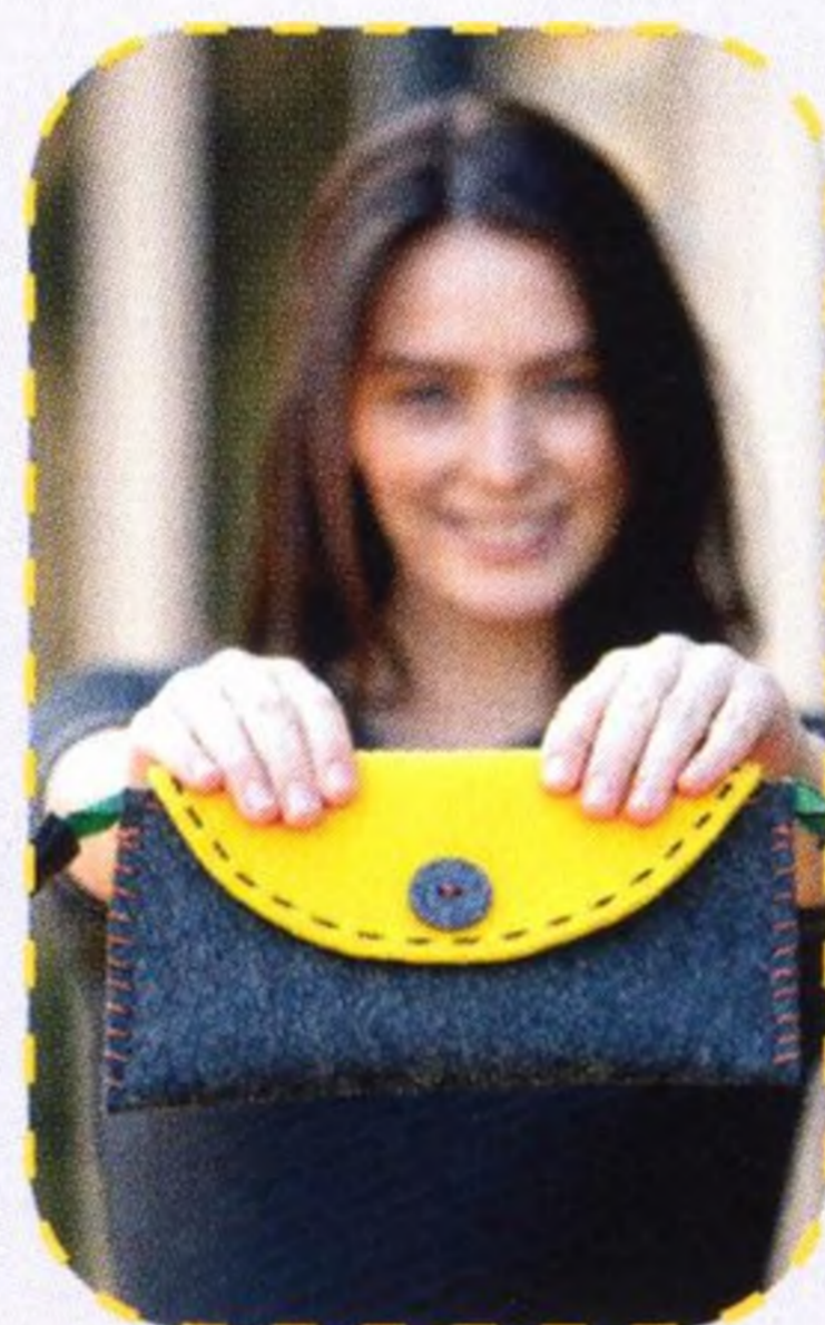
Psaníčko do města 44