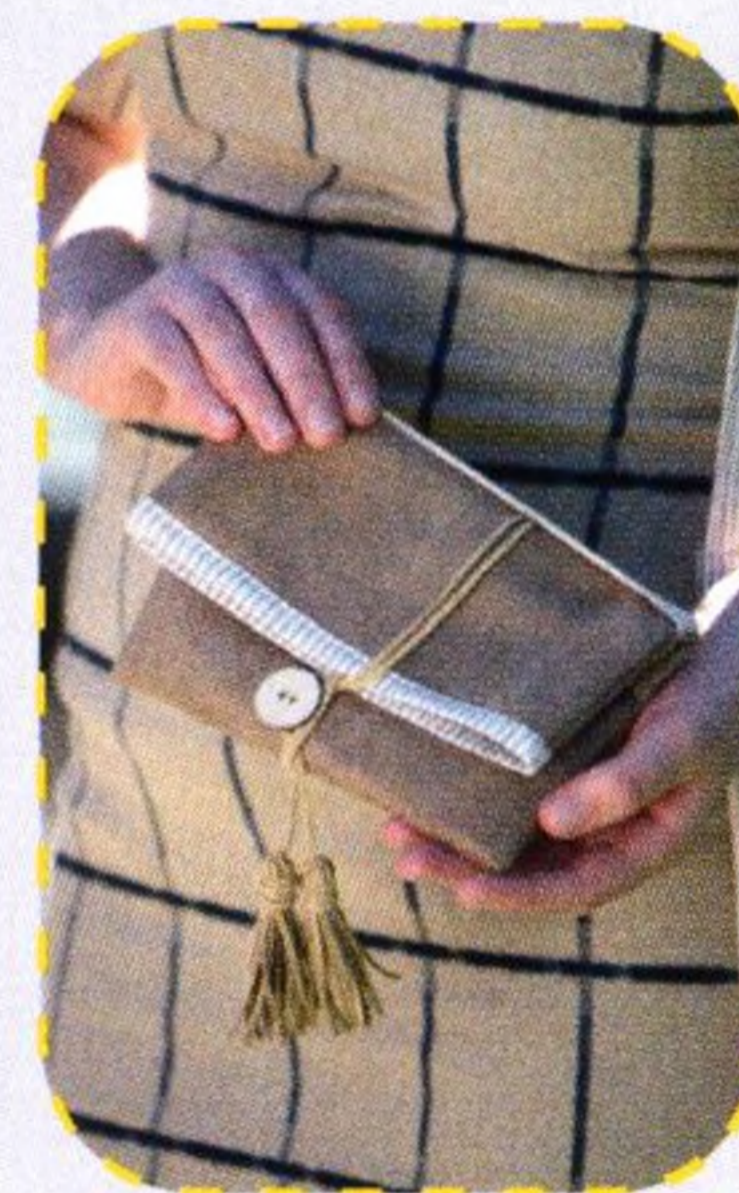
Volnočasové psaníčko se štrápci 31