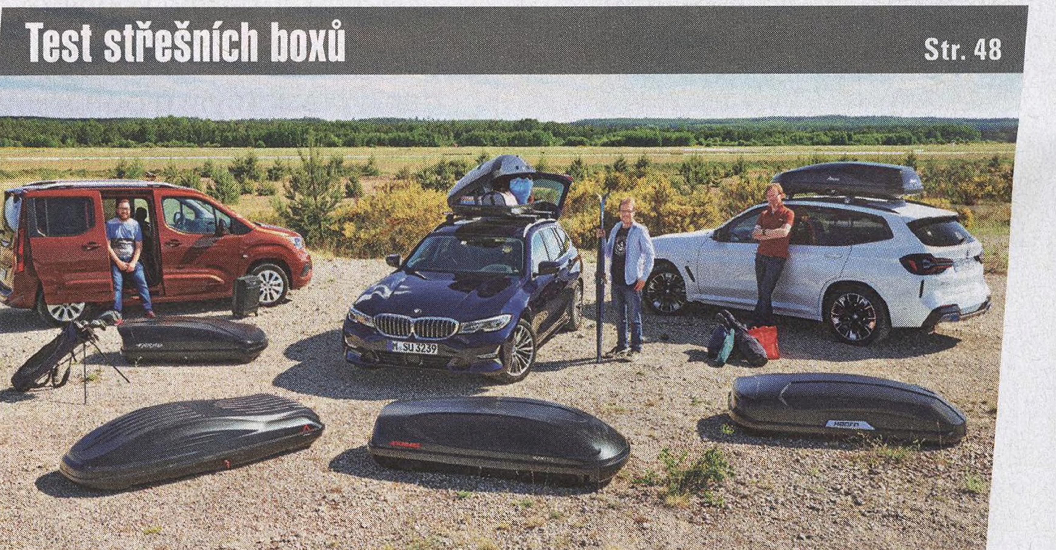
Test střešních boxů