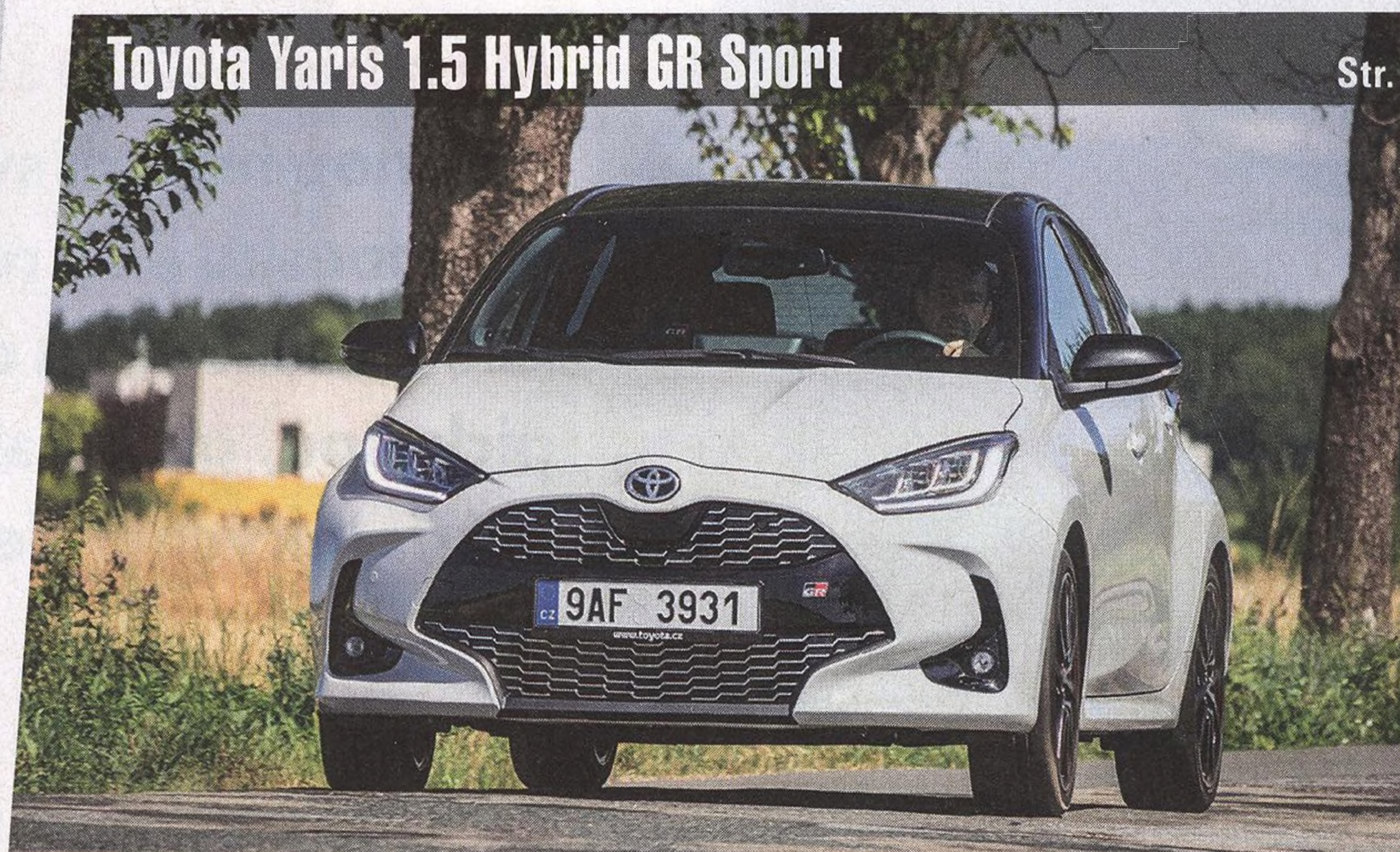
Toyota Yaris 1.5 Hybrid GR Sport