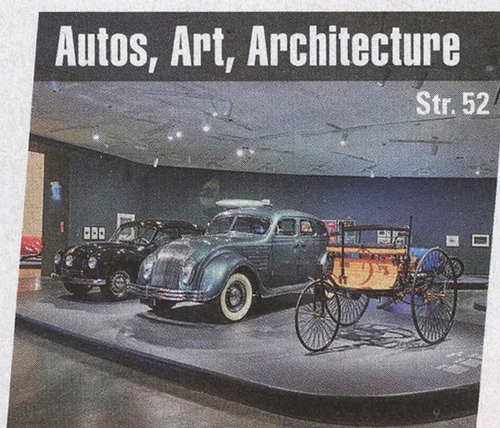
Autos, Art, Architecture