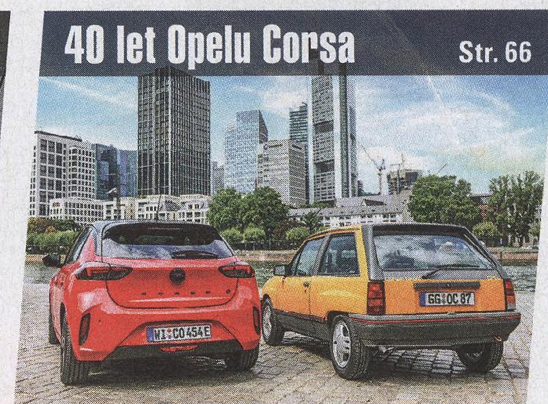
40 let Opelu Corsa