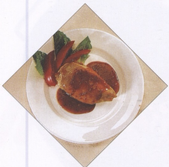
Rajčatová chutovka (str. 42) Kuřecí polévka (str. 83) Kuřecí prsíčka s rajskou omáčkou (str. 139)