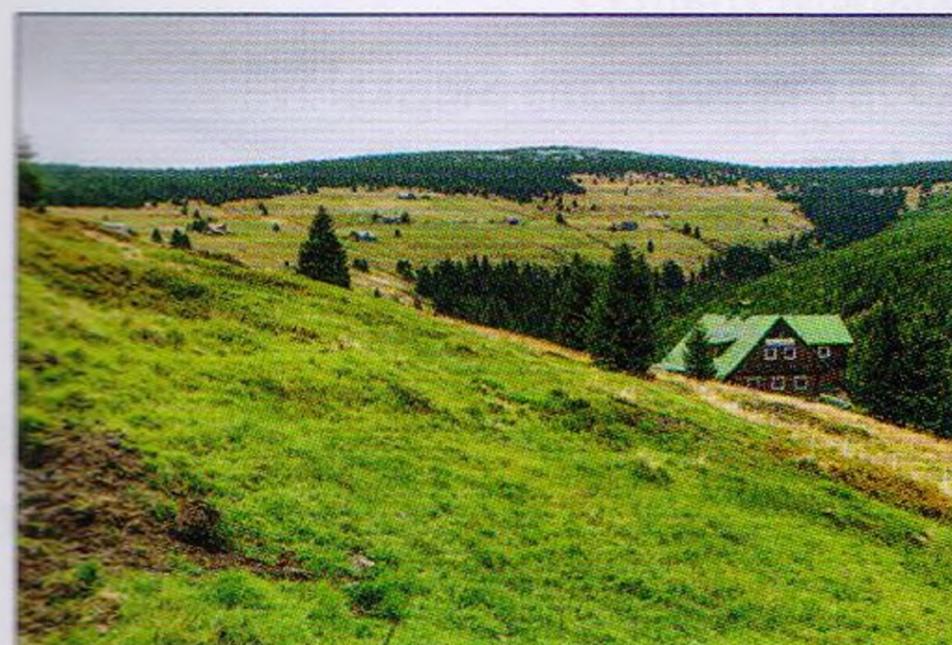
Kamila Antošová (2)

Na památku světoznámého mineraloga připomínáme čtveřici minerálů objevených v Krkonoších