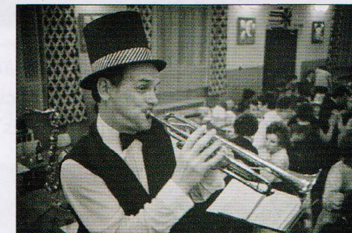
archiv Karla Pičmana

Do okolí vesnice Gořešova se vydáme obhlédnout třeba přírodní památku Ďáblův kyj či Trpasličí skály