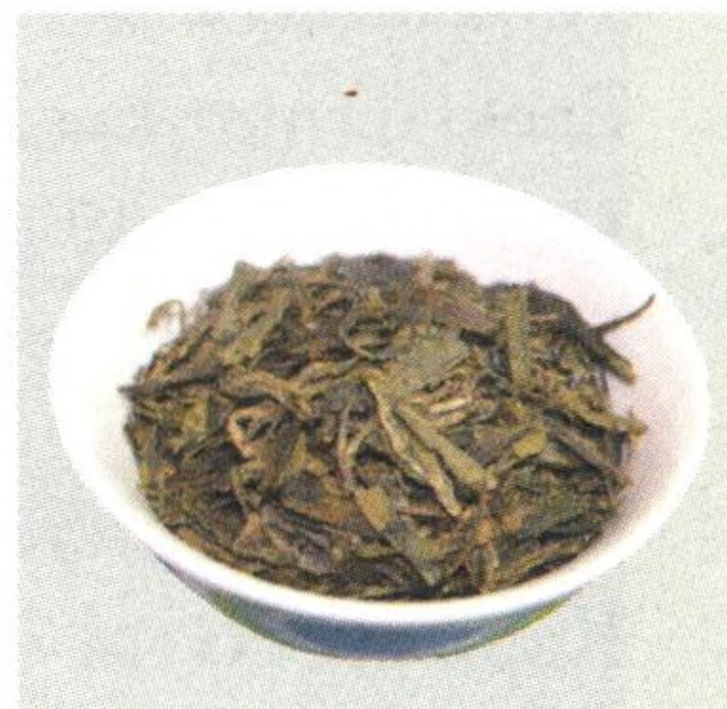
Obr. 1 (shora dolů) Zázvor, kustovnice čínská, semena leknínce hrozivého, zelený čaj