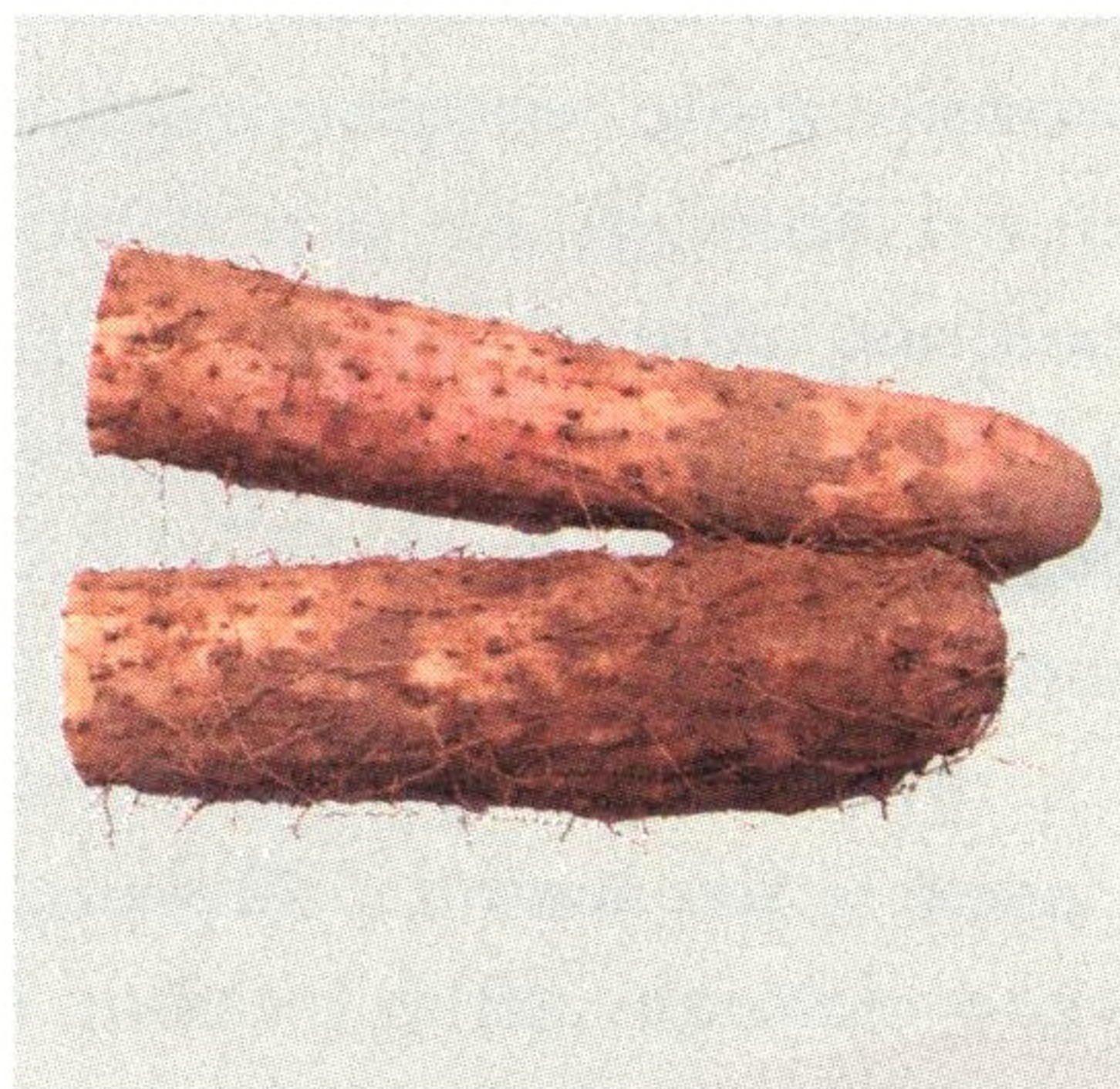
Obr. 2 (shora dolů) Liči, hložítky a jam čínský