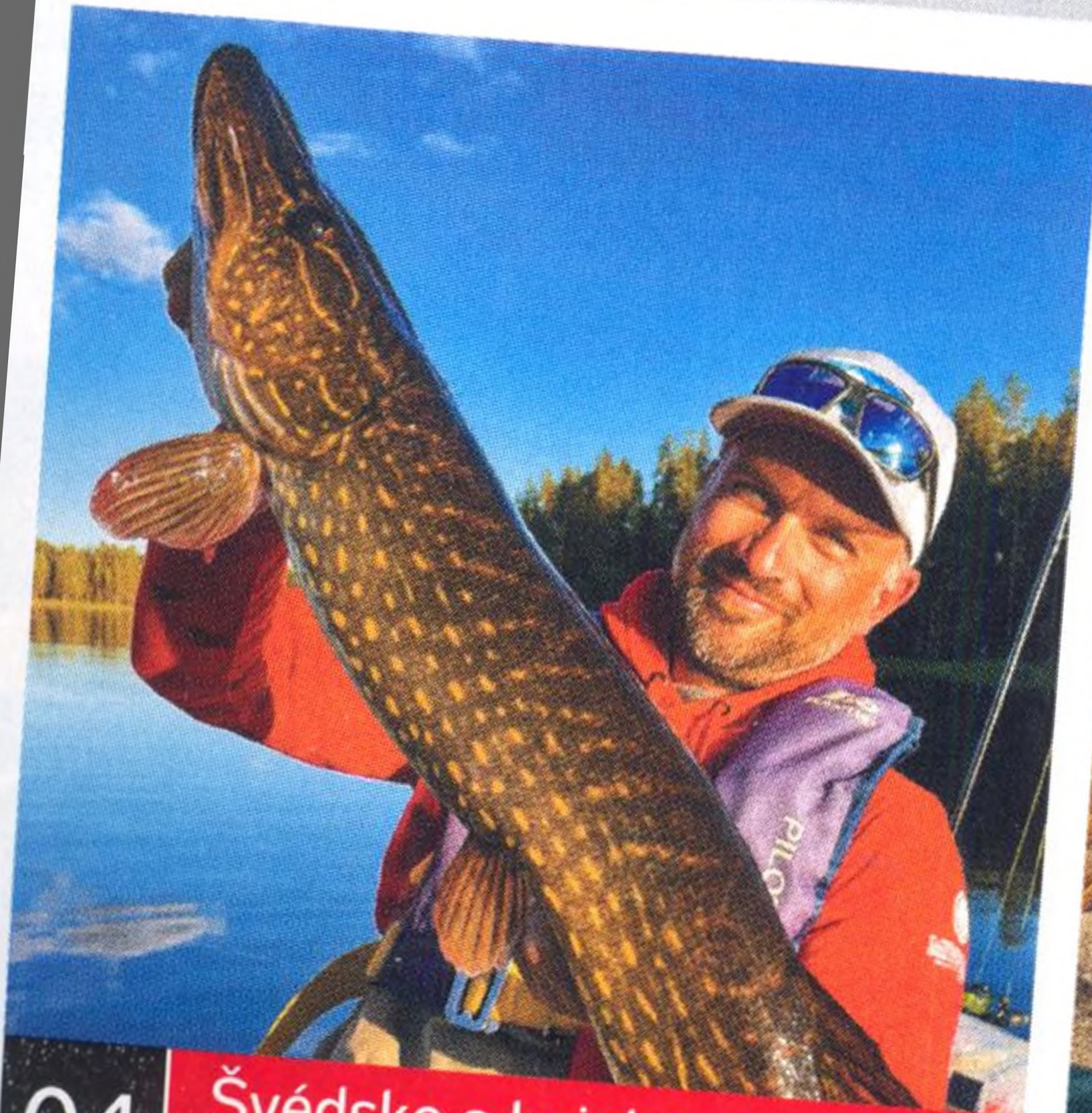
04 Švédsko s kajakem 2022 aneb na výpravě snů