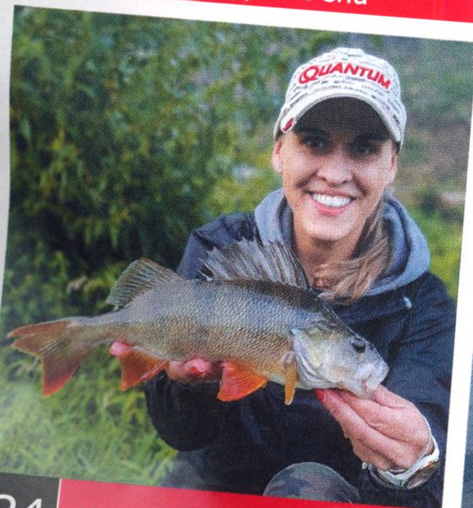
24 Když okouni (ne)berou