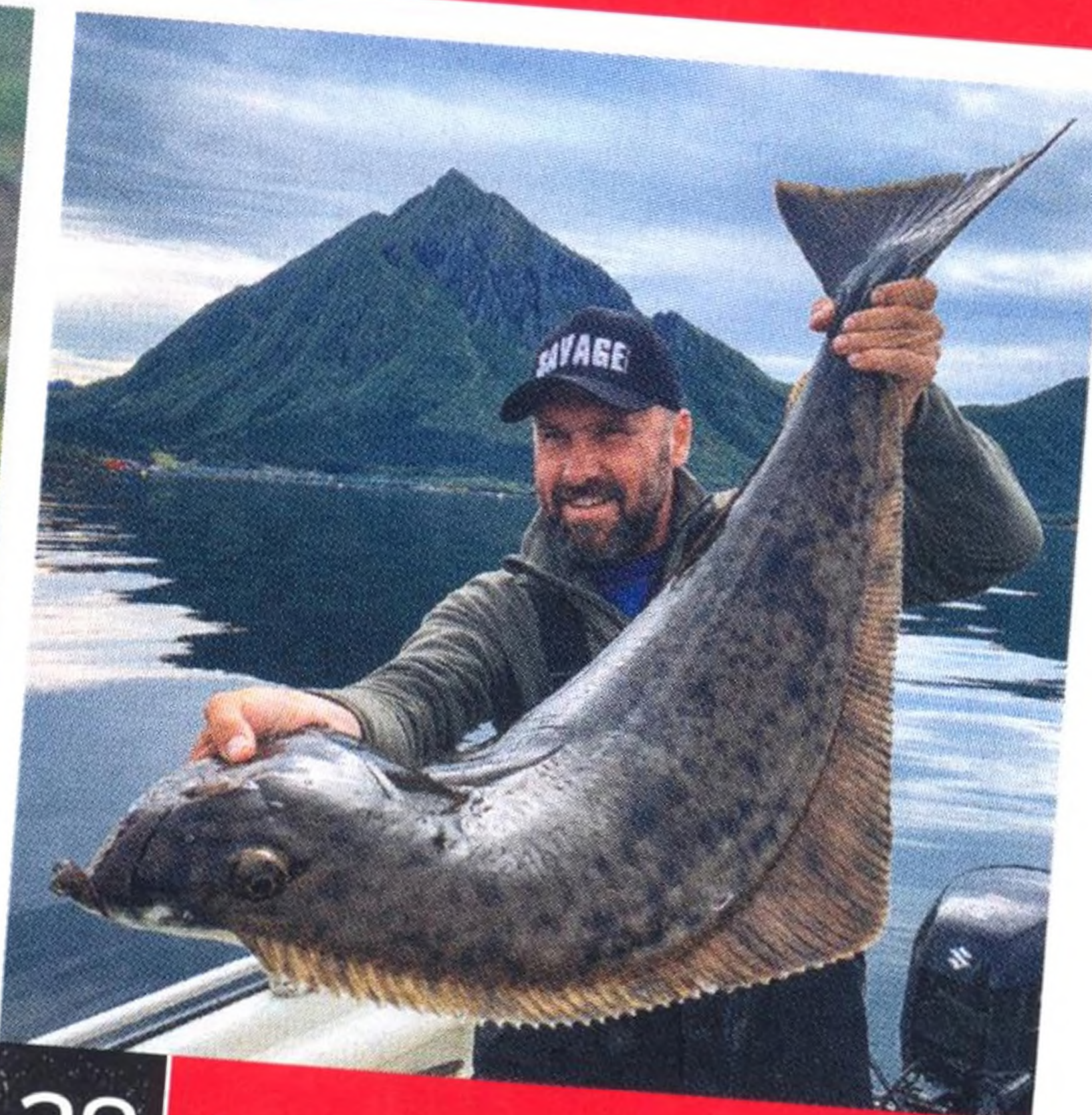
28 Na Sever / Právo na toulky