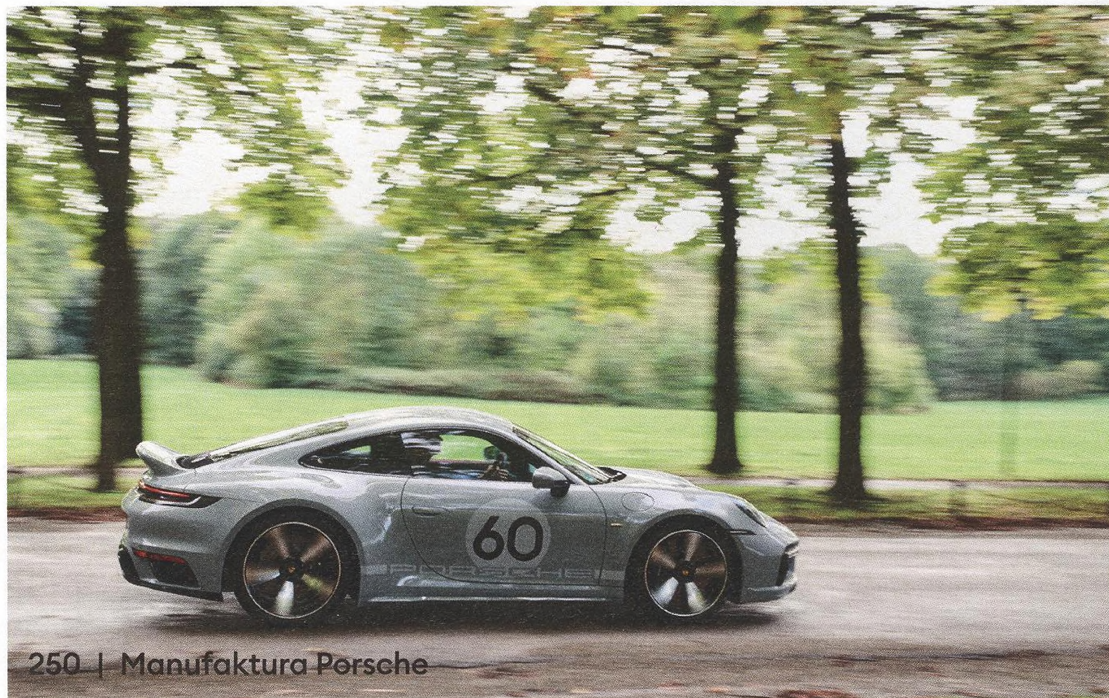
250 | Manufaktura Porsche