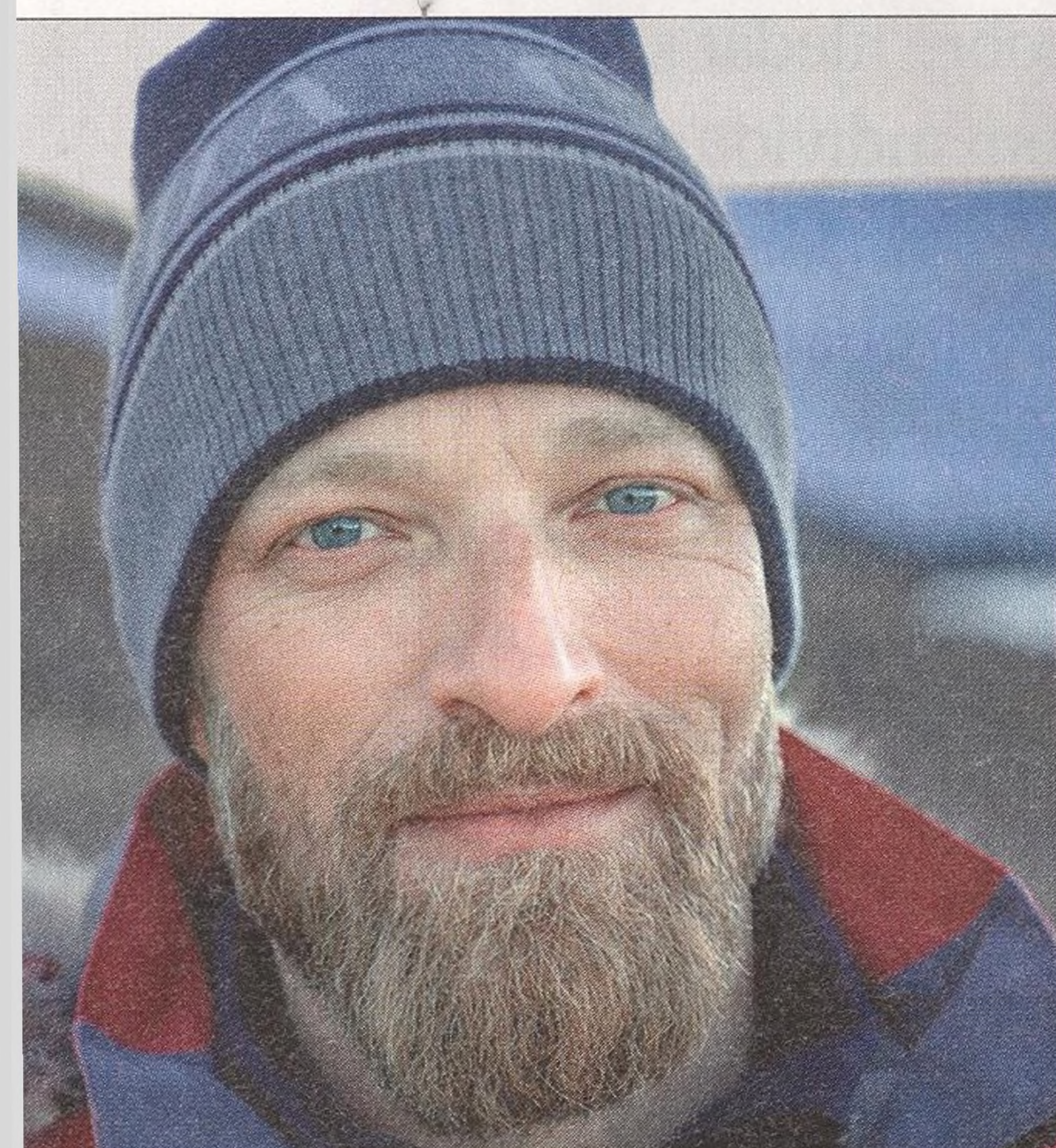
BEN SAUNDERS polárník