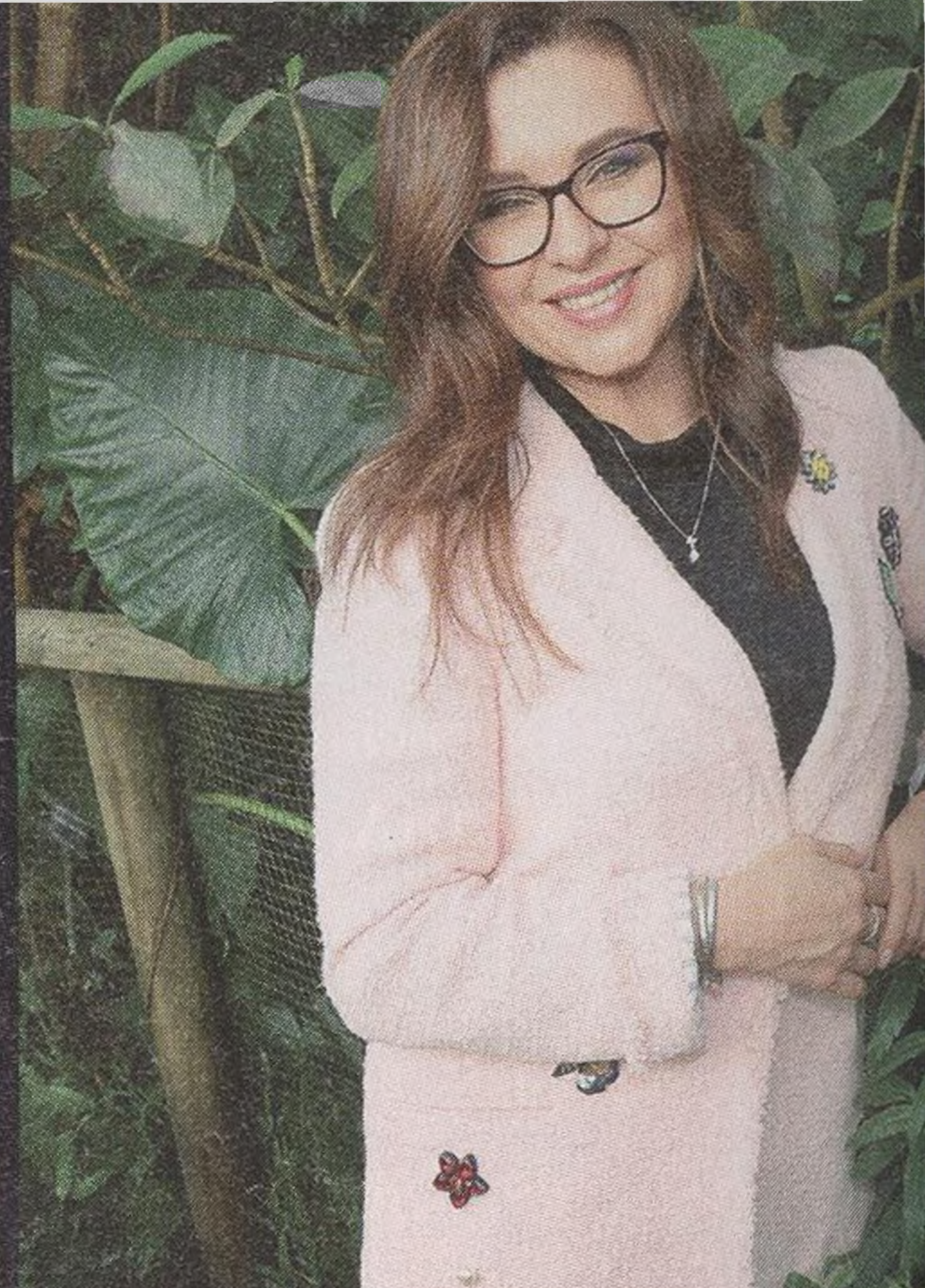
DANA MORÁVKOVÁ herečka, zpěvačka