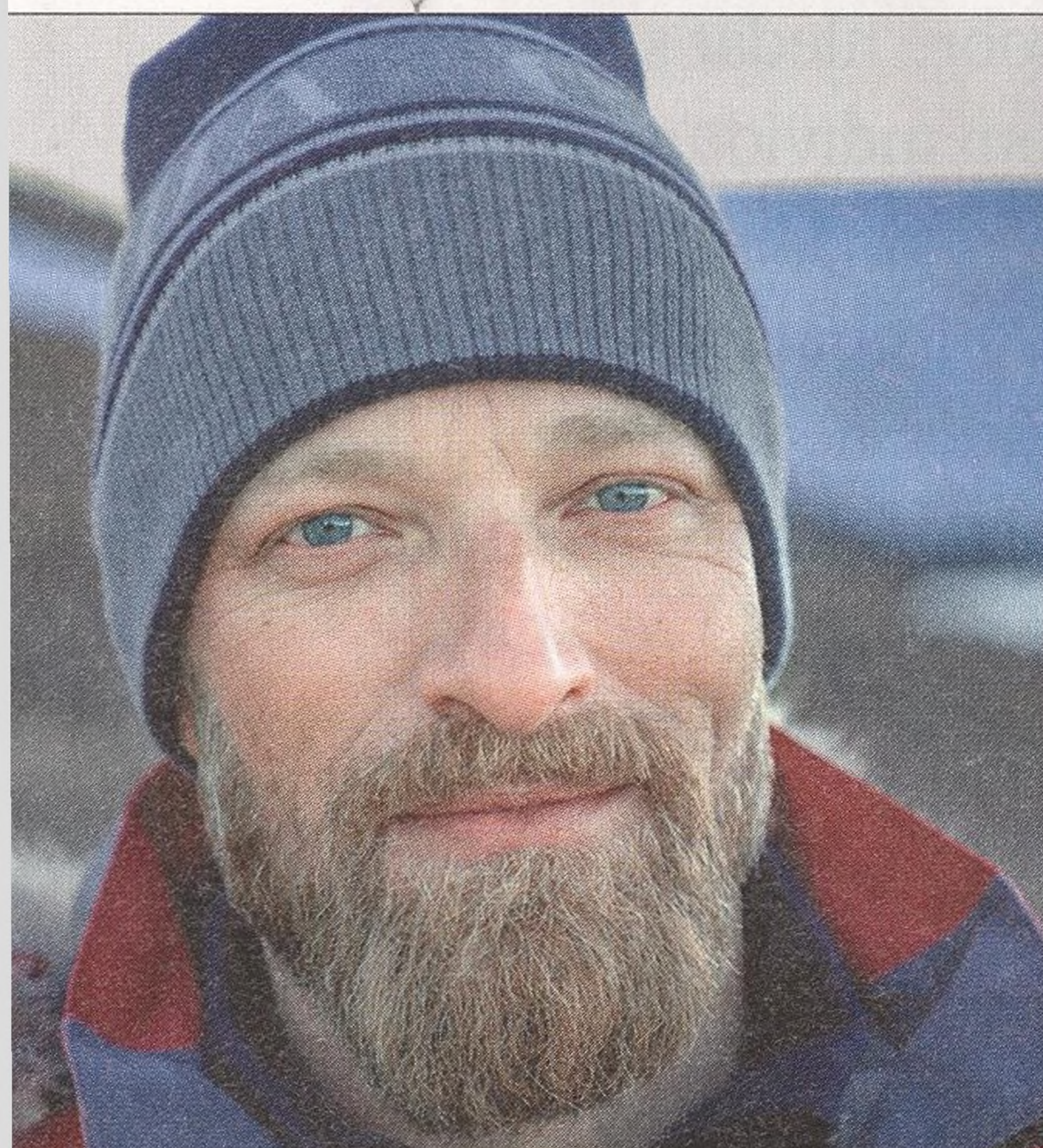
BEN SAUNDERS polárník