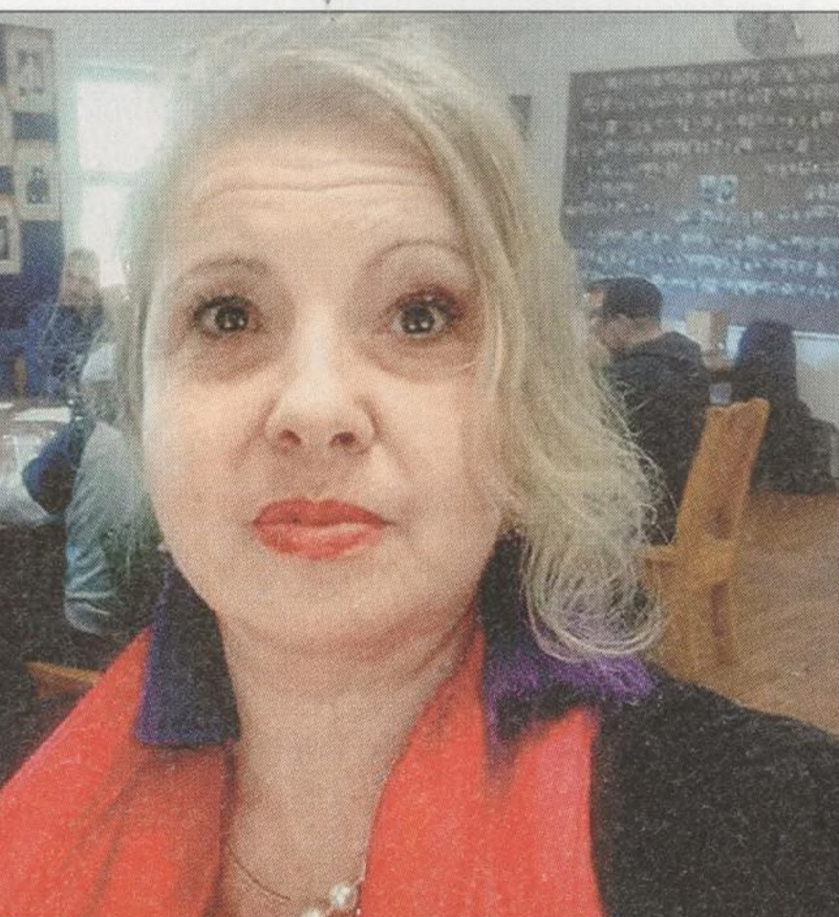
SVĚTLANA TUMANOVÁ exšpionka KGB