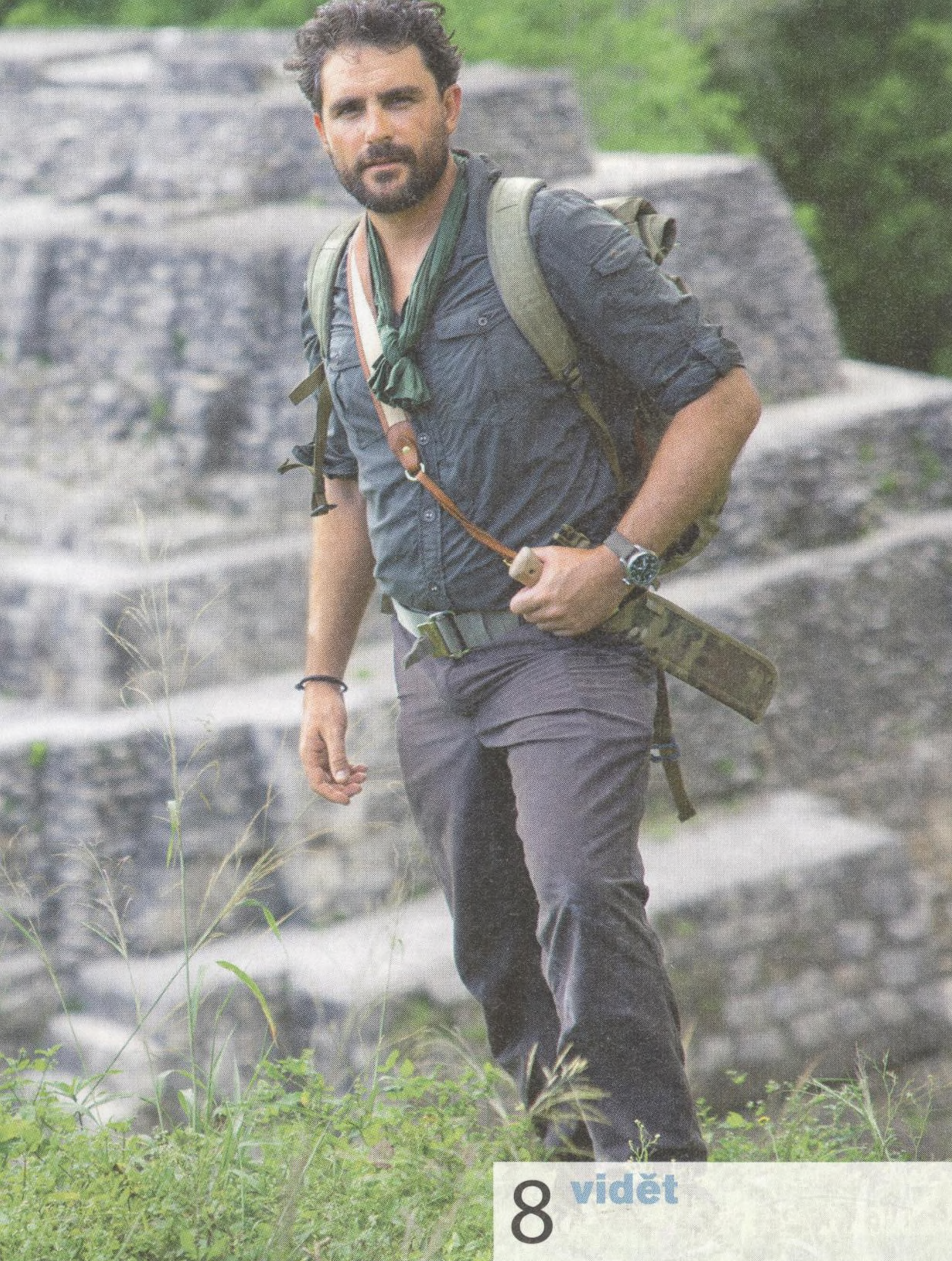
LEVISON WOOD fotograf, cestovatel