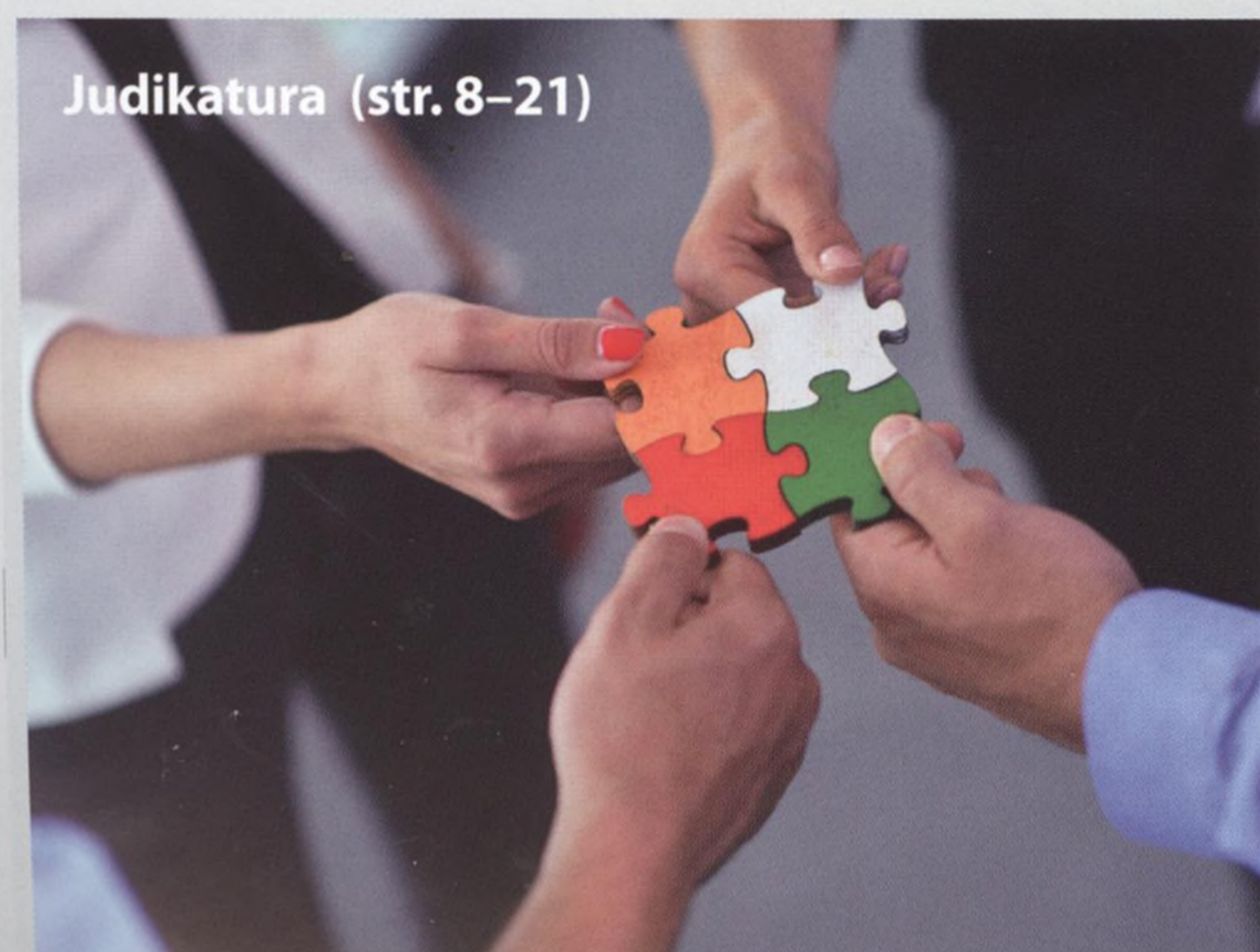
Judikatura (str. 8–21)