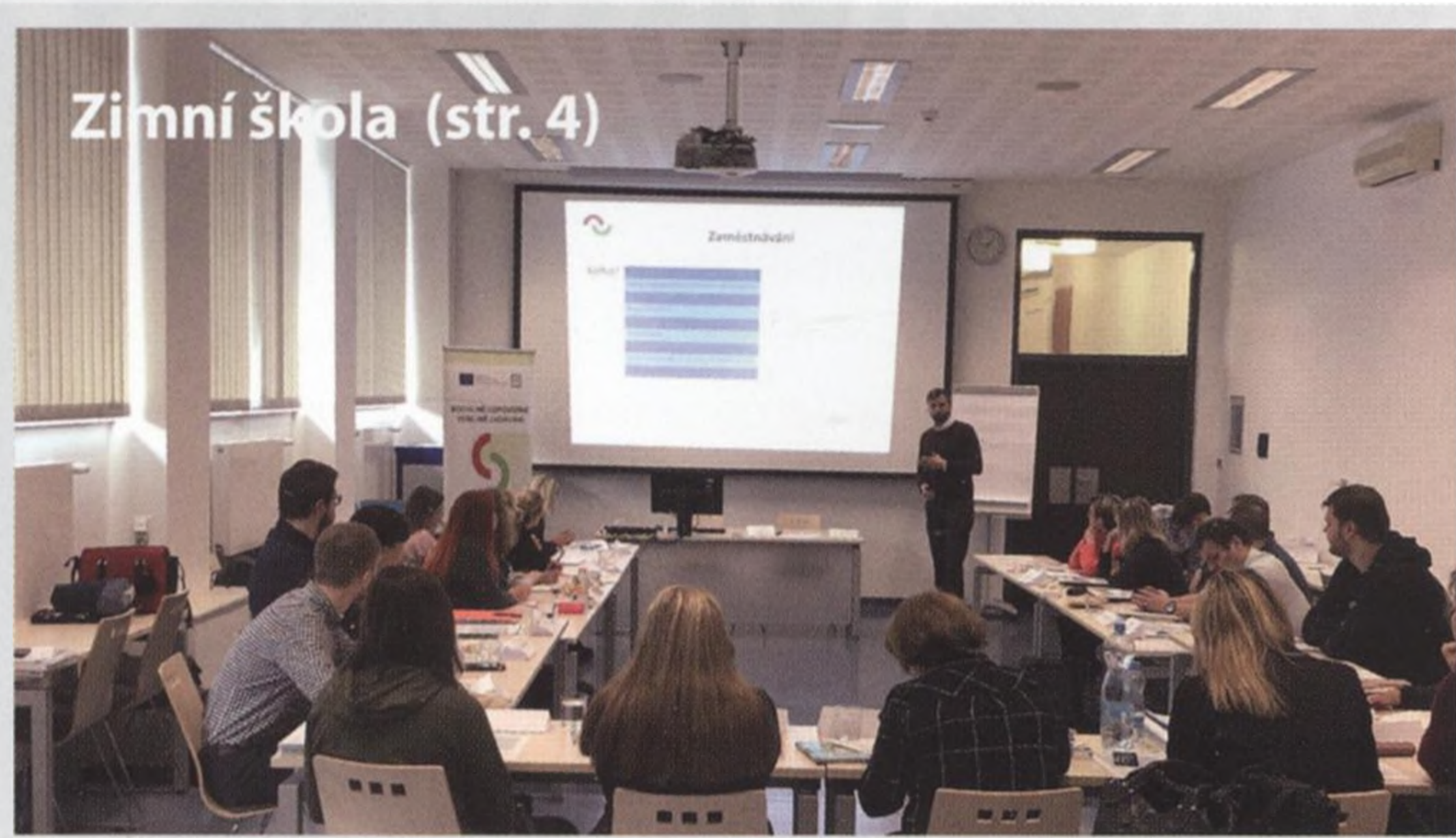
Zimní škola (str. 4)