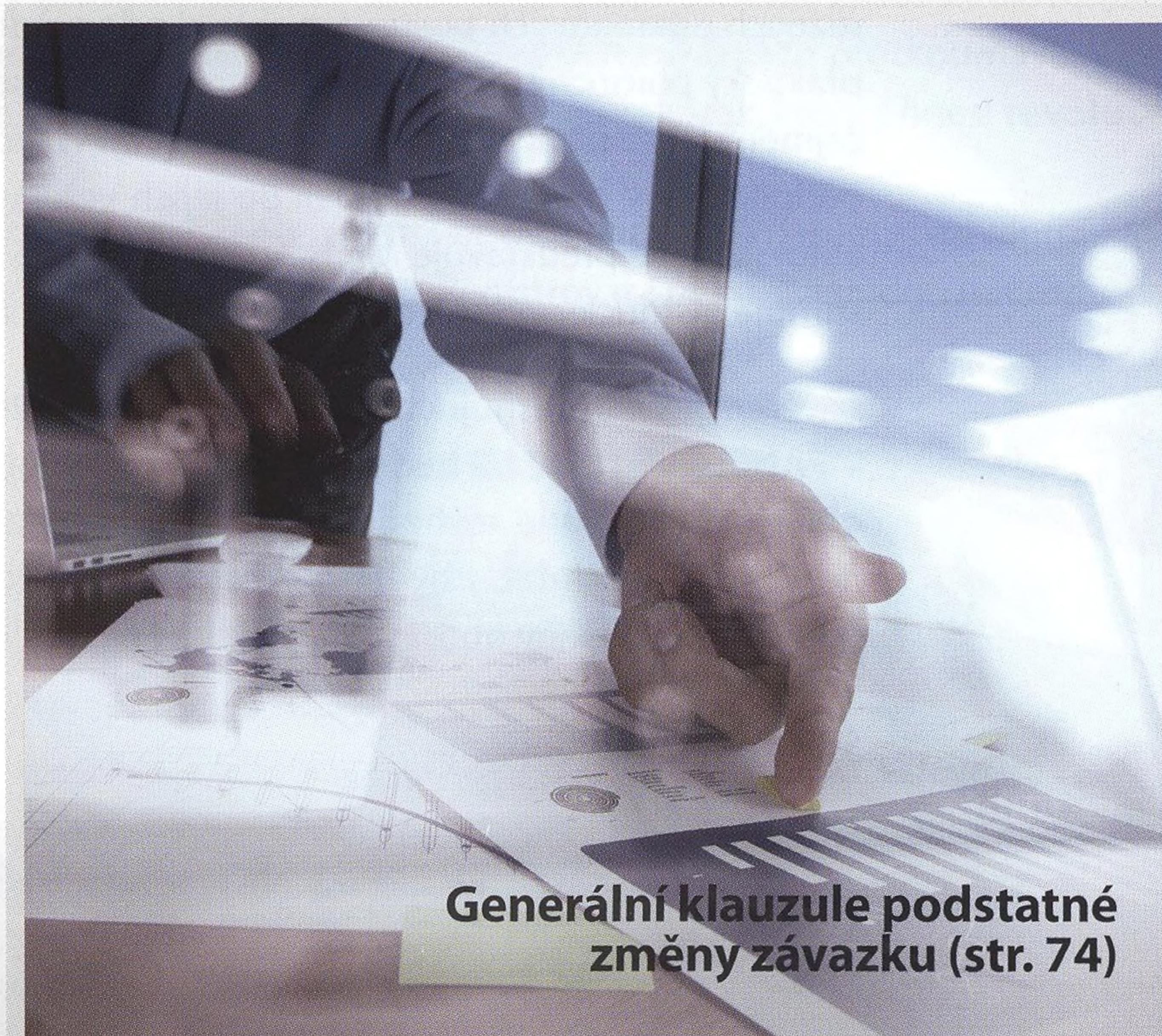
Generální klauzule podstatné změny závazku (str. 74)