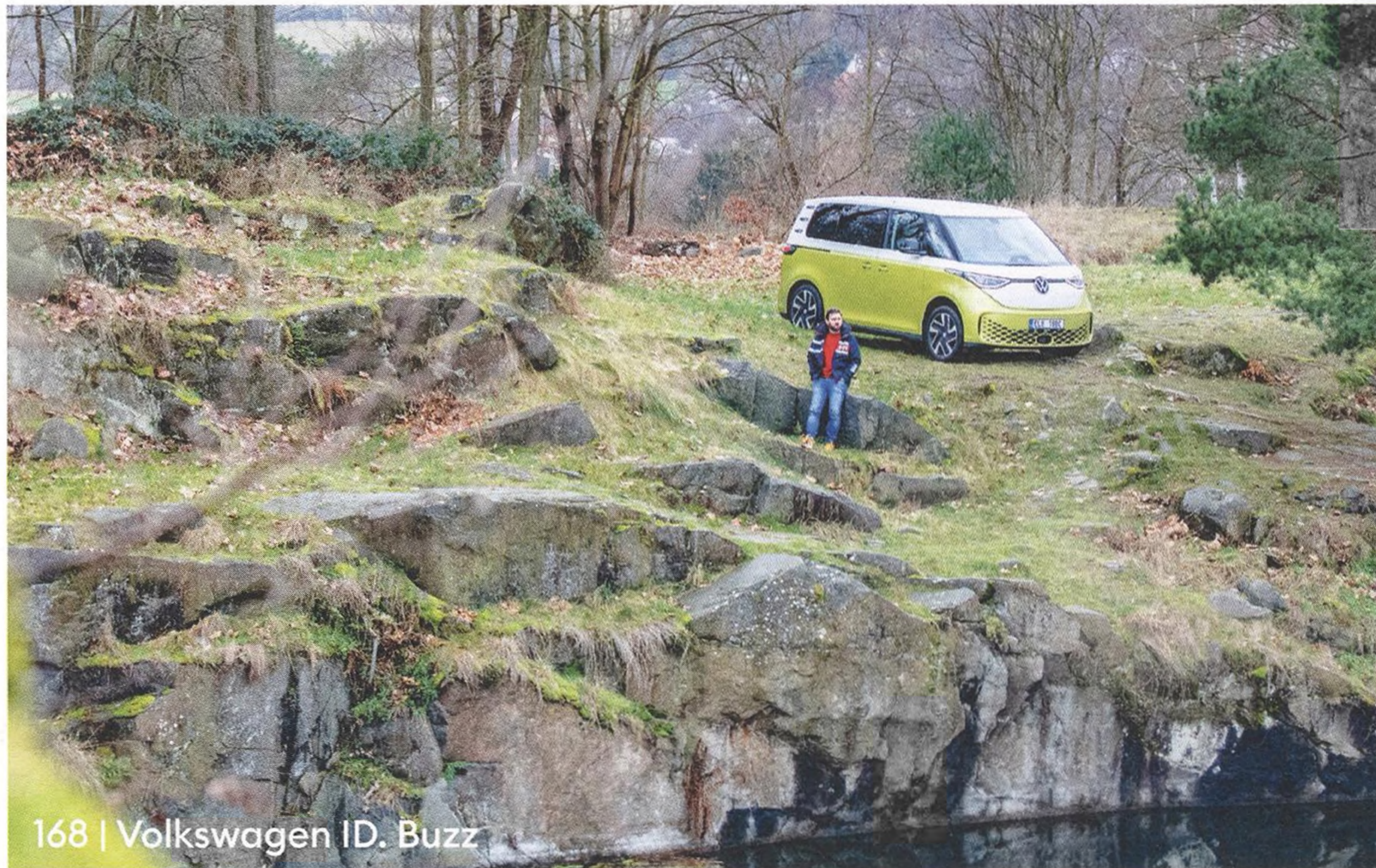
168 | Volkswagen ID. Buzz