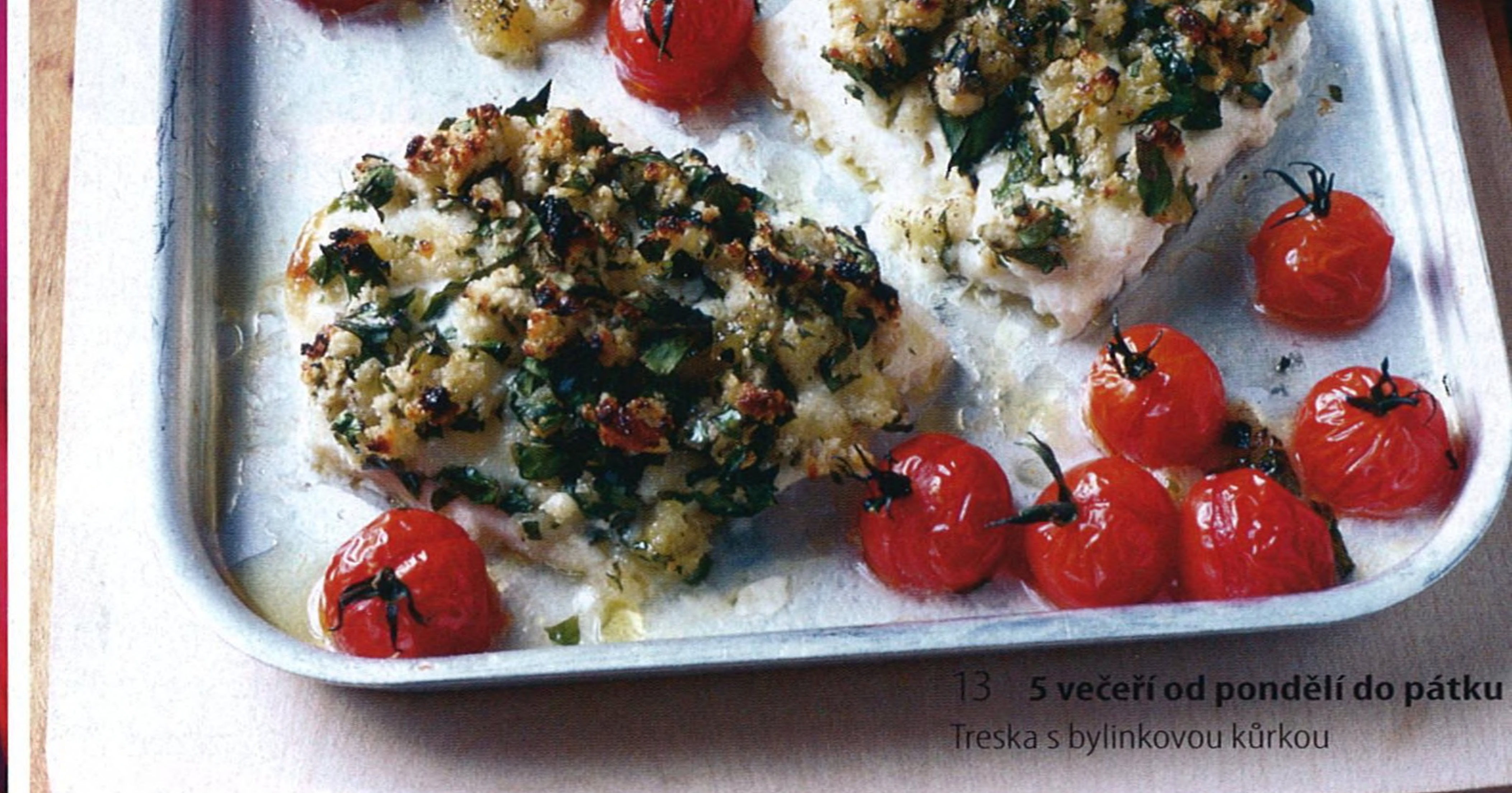
13 5 večerí od pondělí do pátku Treska s bylinkovou kůrkou