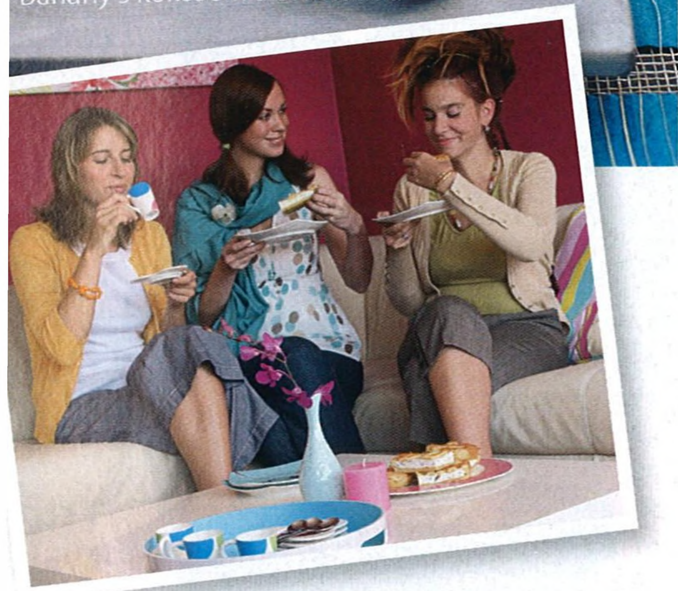
61 Terezin nedělní oběd

75 30minutová večeře pro přátele Banány s kokosem a čokoládou