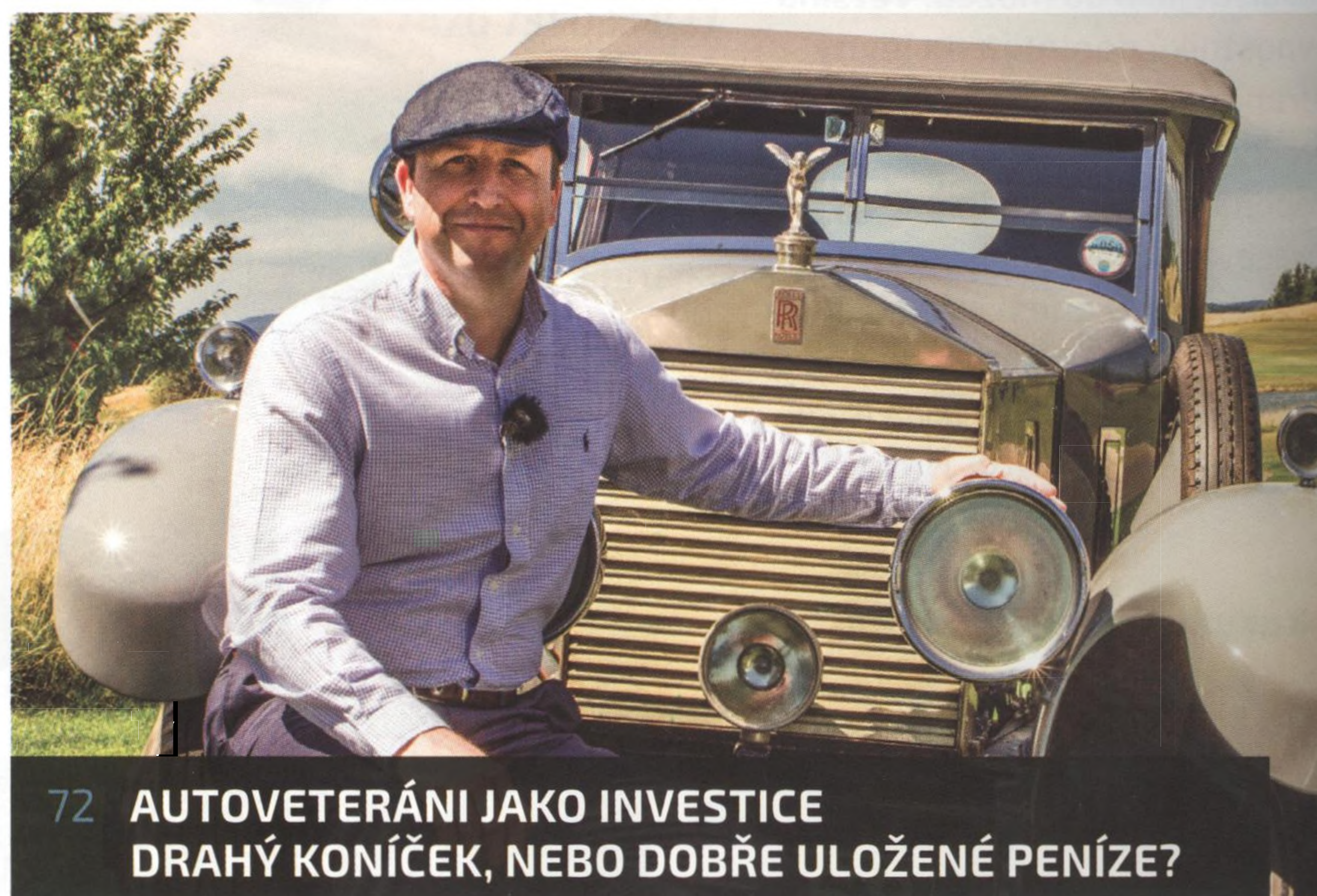
72 AUTOVETERÁNI JAKO INVESTICE DRAHÝ KONÍČEK, NEBO DOBŘE ULOŽENÉ PENÍZE?