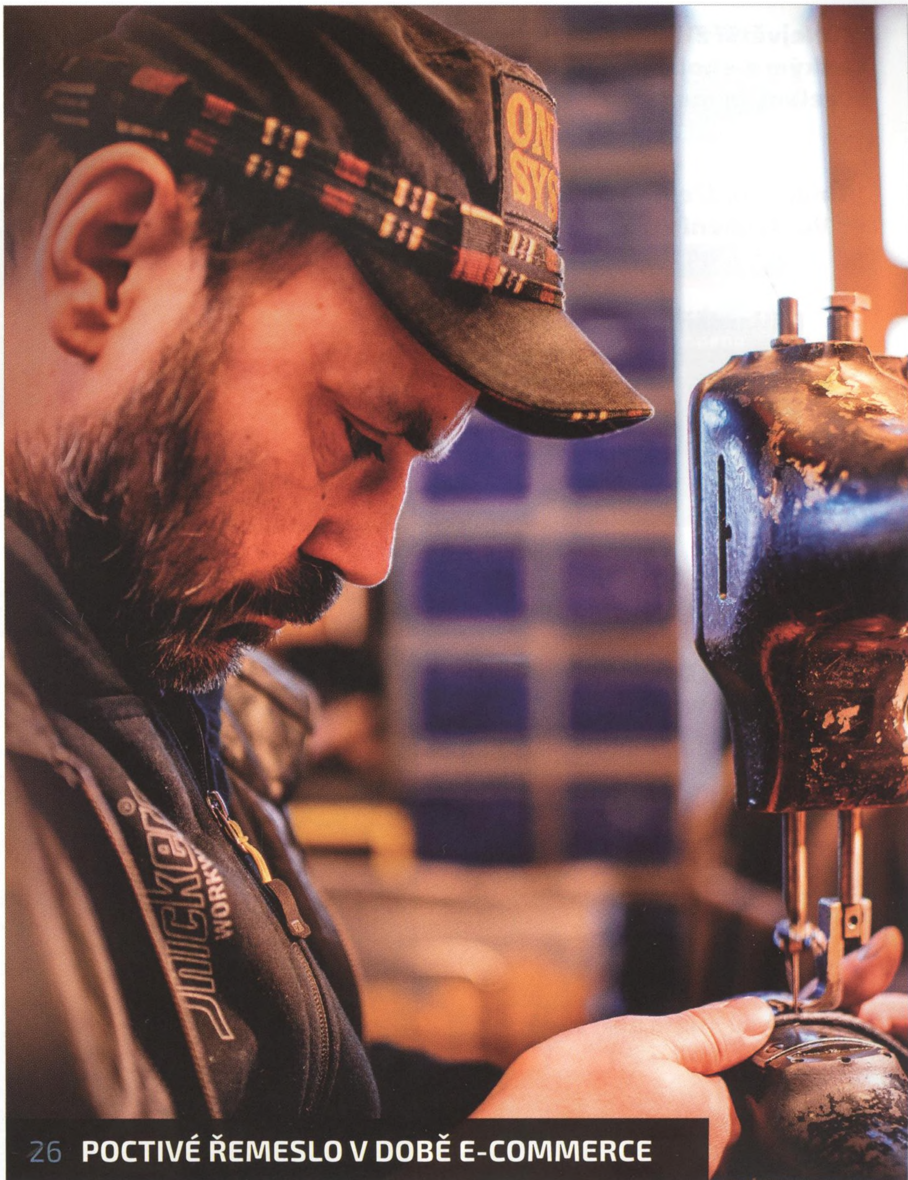
26 POCTIVÉ ŘEMESLO V DOBĚ E-COMMERCE