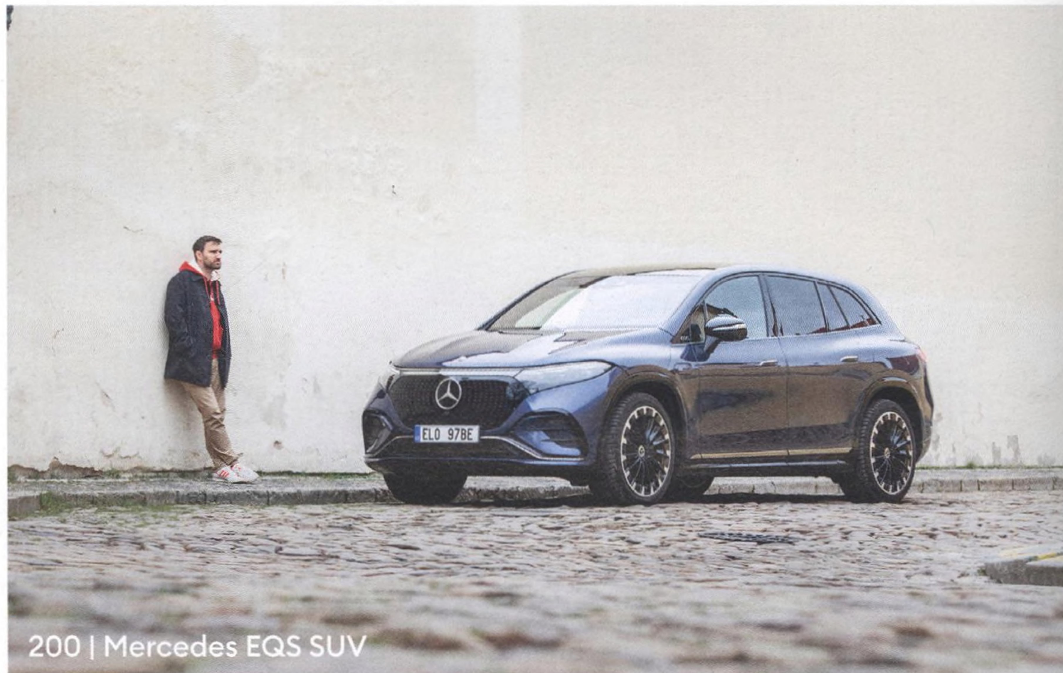
200 | Mercedes EQS SUV