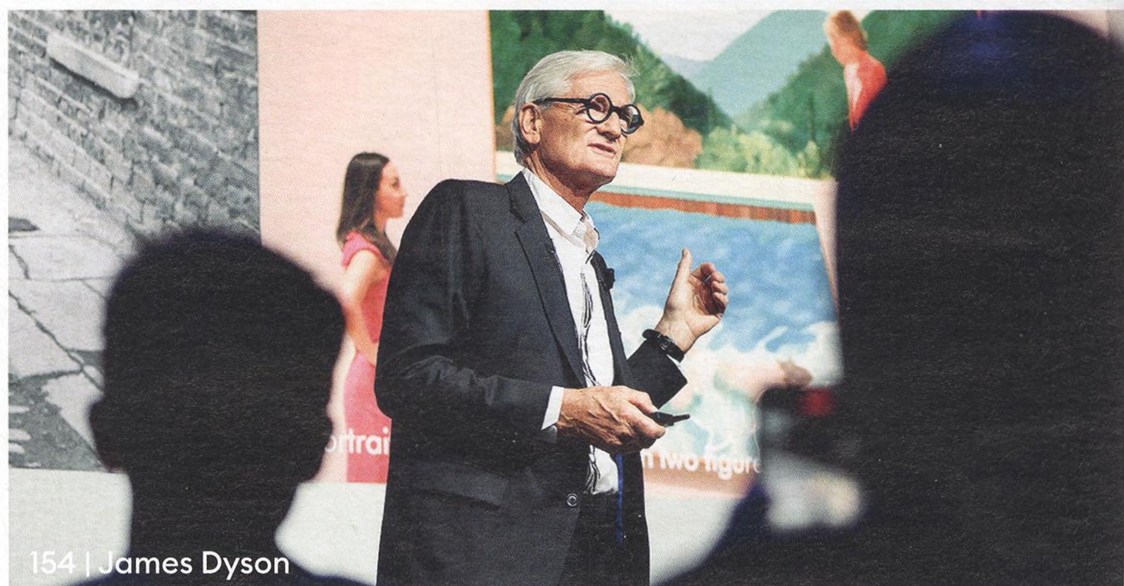
154 | James Dyson