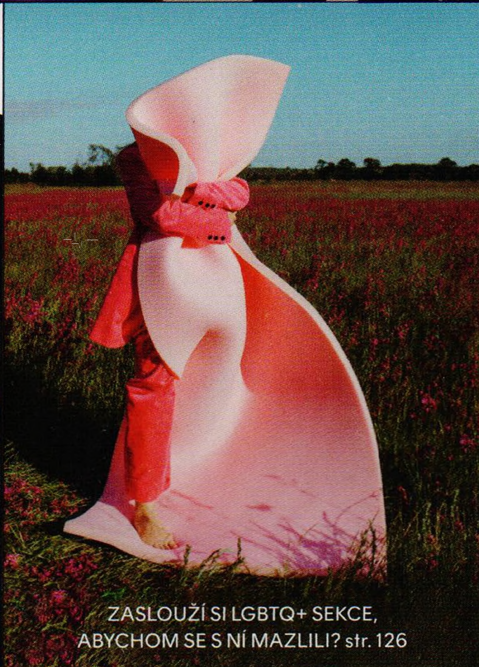
ZASLOUŽÍ SI LGBTQ+ SEKCE, ABYCHOM SE S NÍ MAZLILI? str. 126

BEAUTY AWARDS COSMOPOLITAN 2023 CZECH REPUBLIC