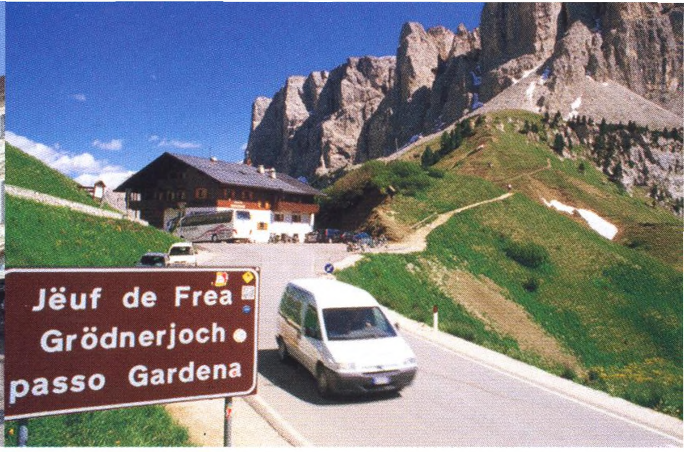
Nahoře Bronzová socha uprostřed působivého náměstí Piazza San Carlo v Turíně • Gardena Pass v severoitalských Dolomitech, Tridentsko-Horní Adiže