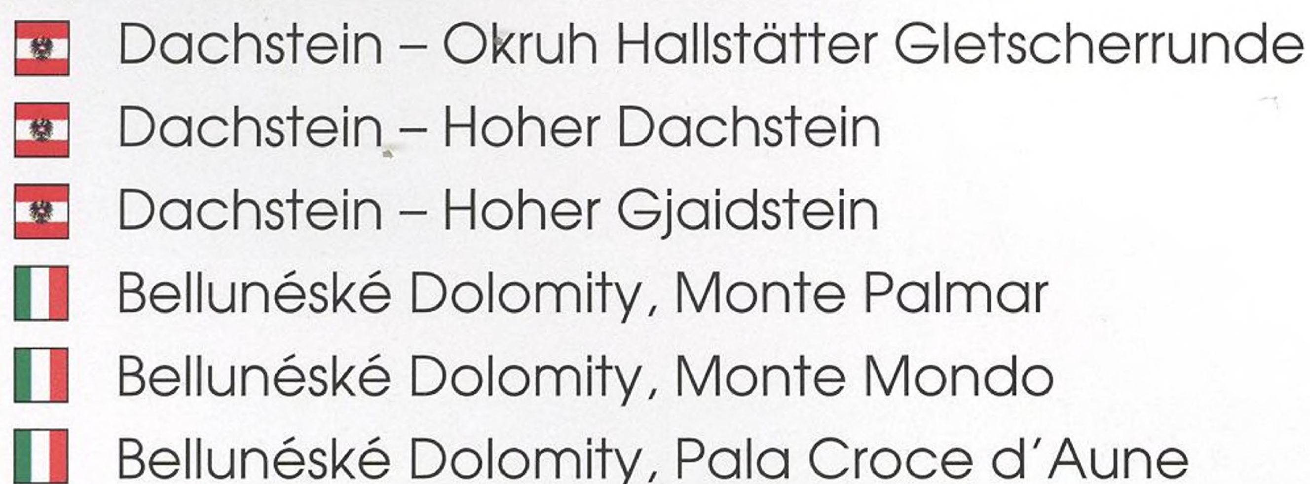
Foto na titulní straně