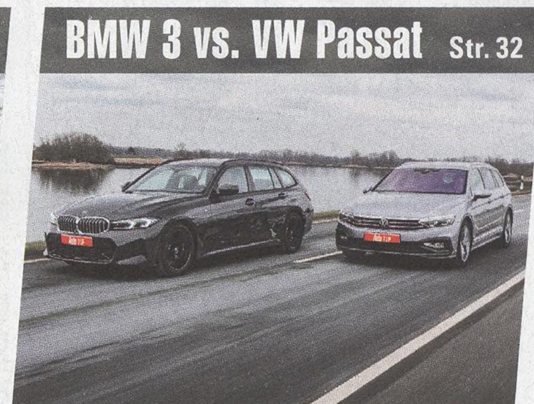
BMW 3 vs. VW Passat