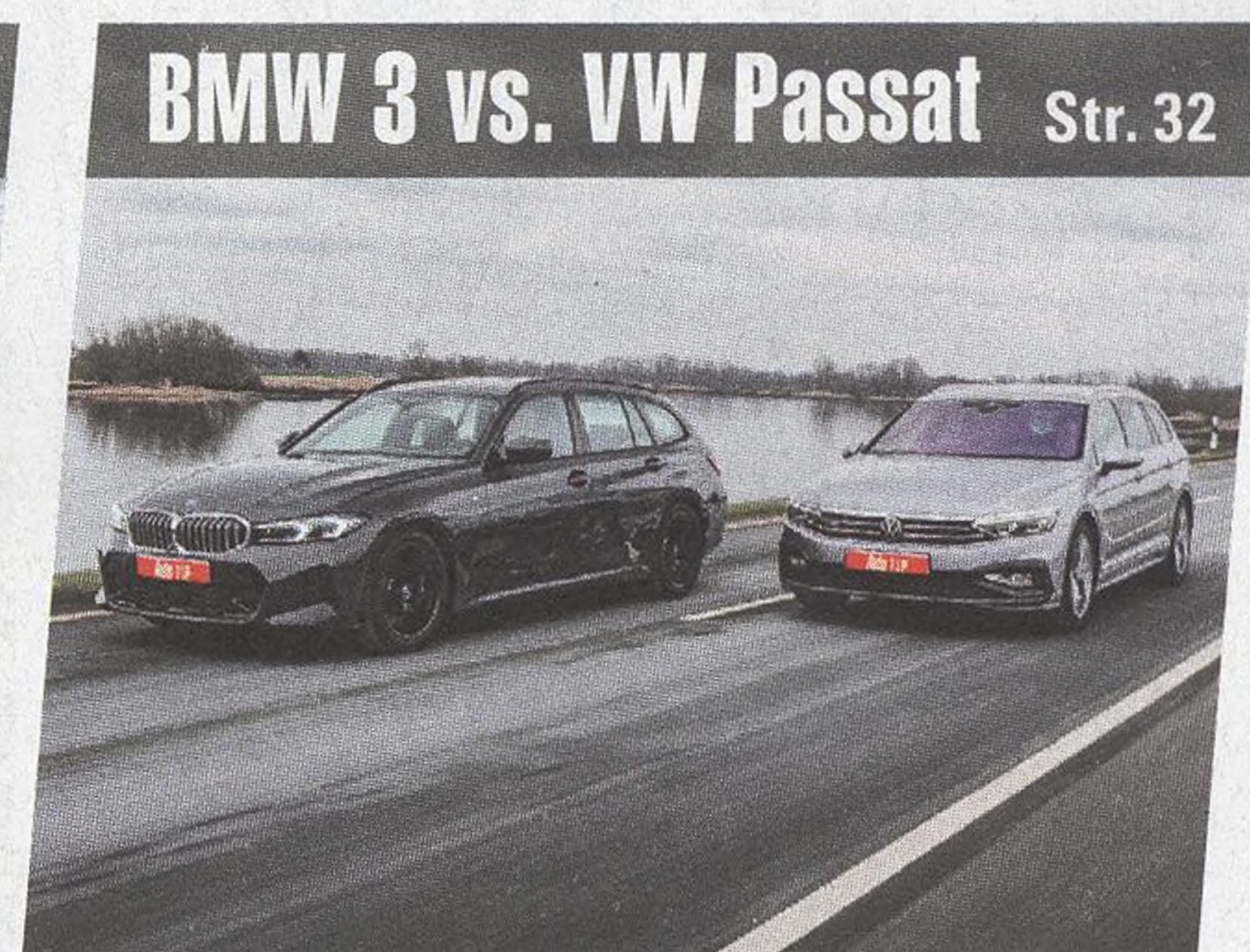
BMW 3 vs. VW Passat