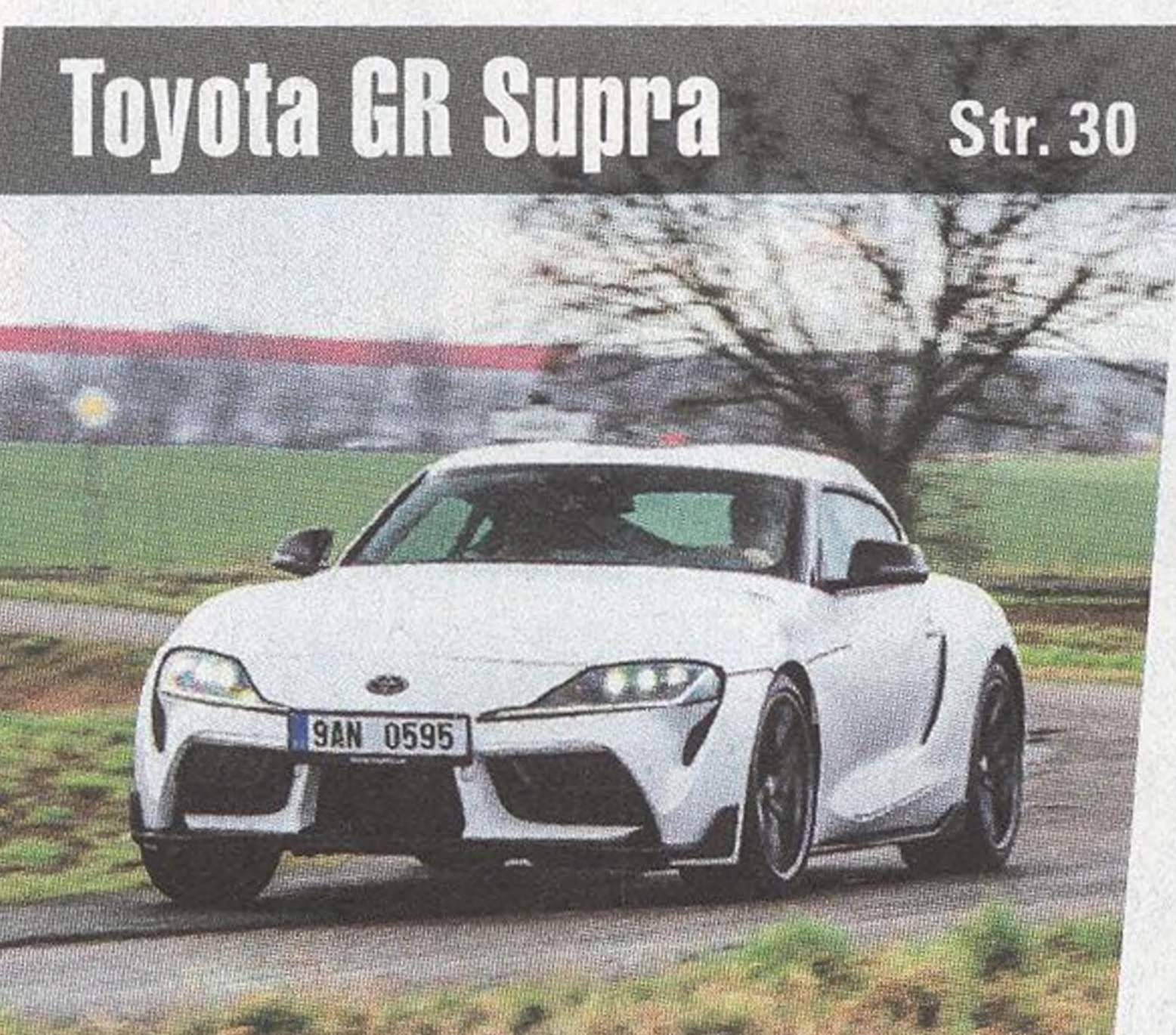
Toyota GR Supra