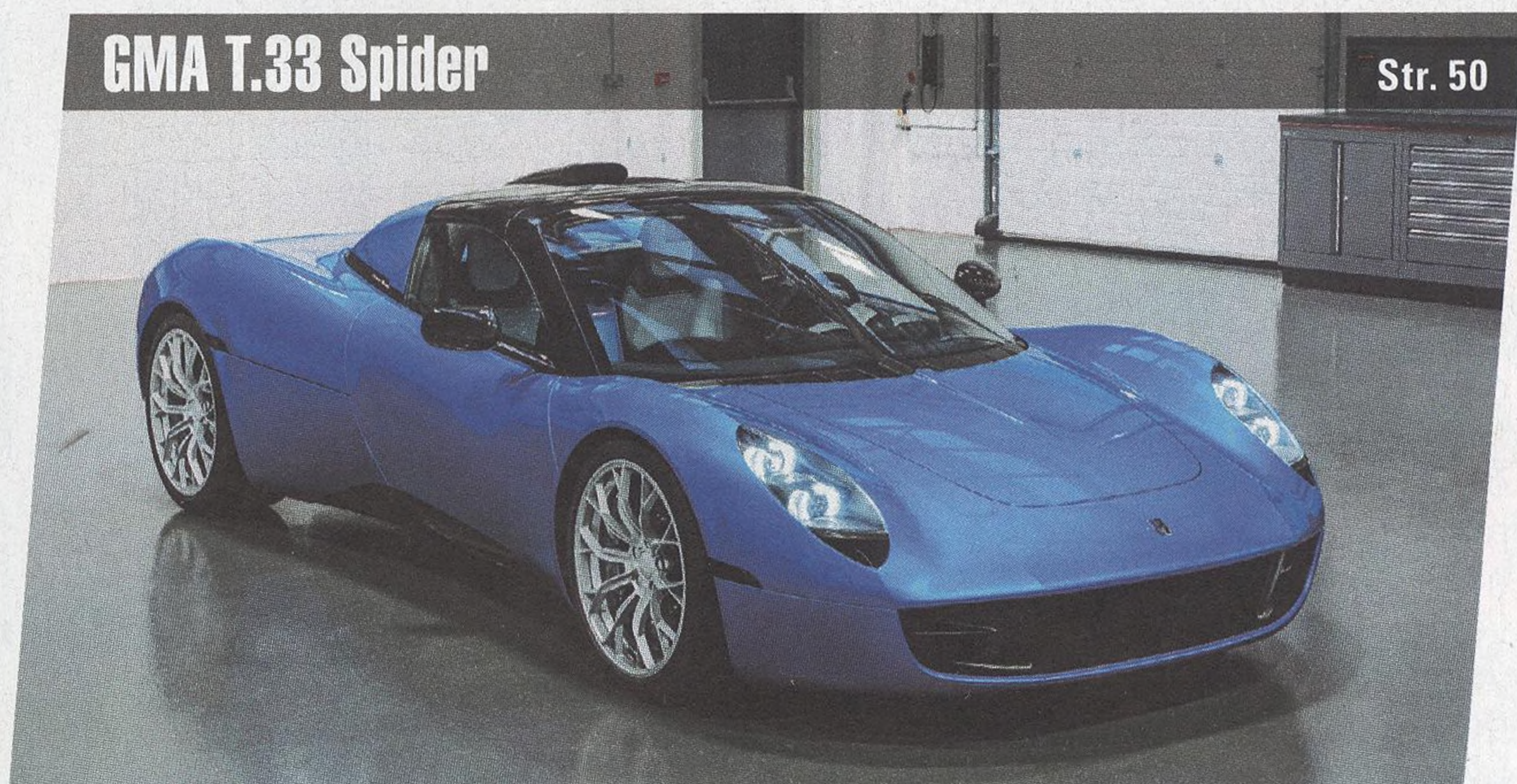
GMA T.33 Spider