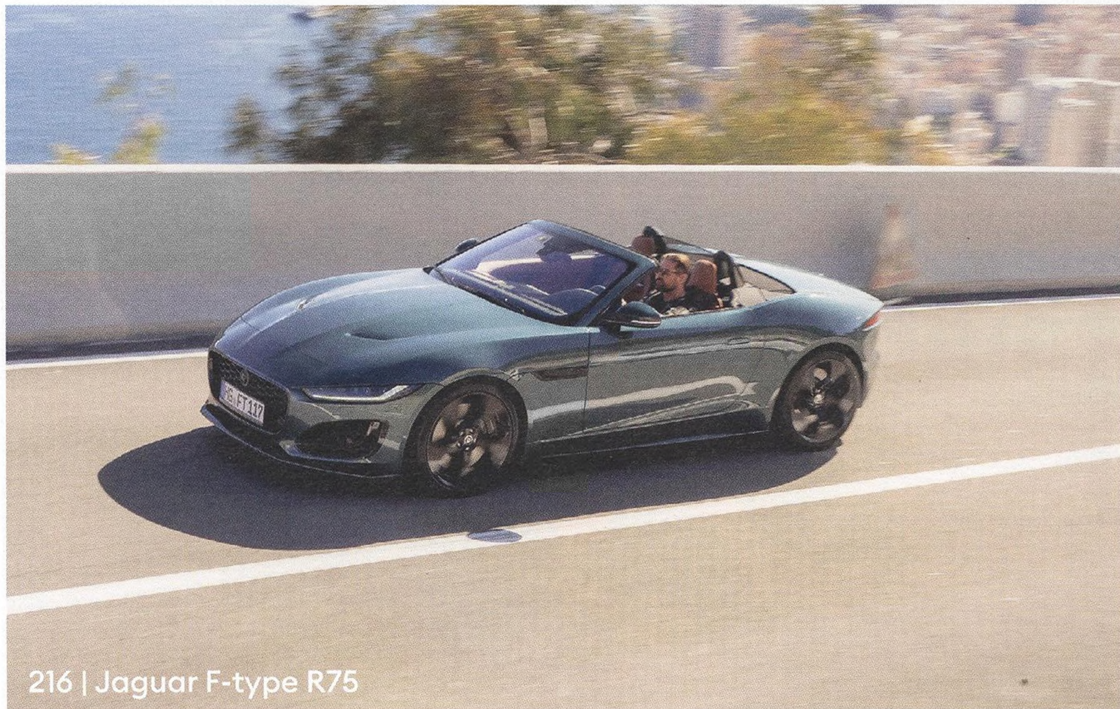
216 | Jaguar F-type R75