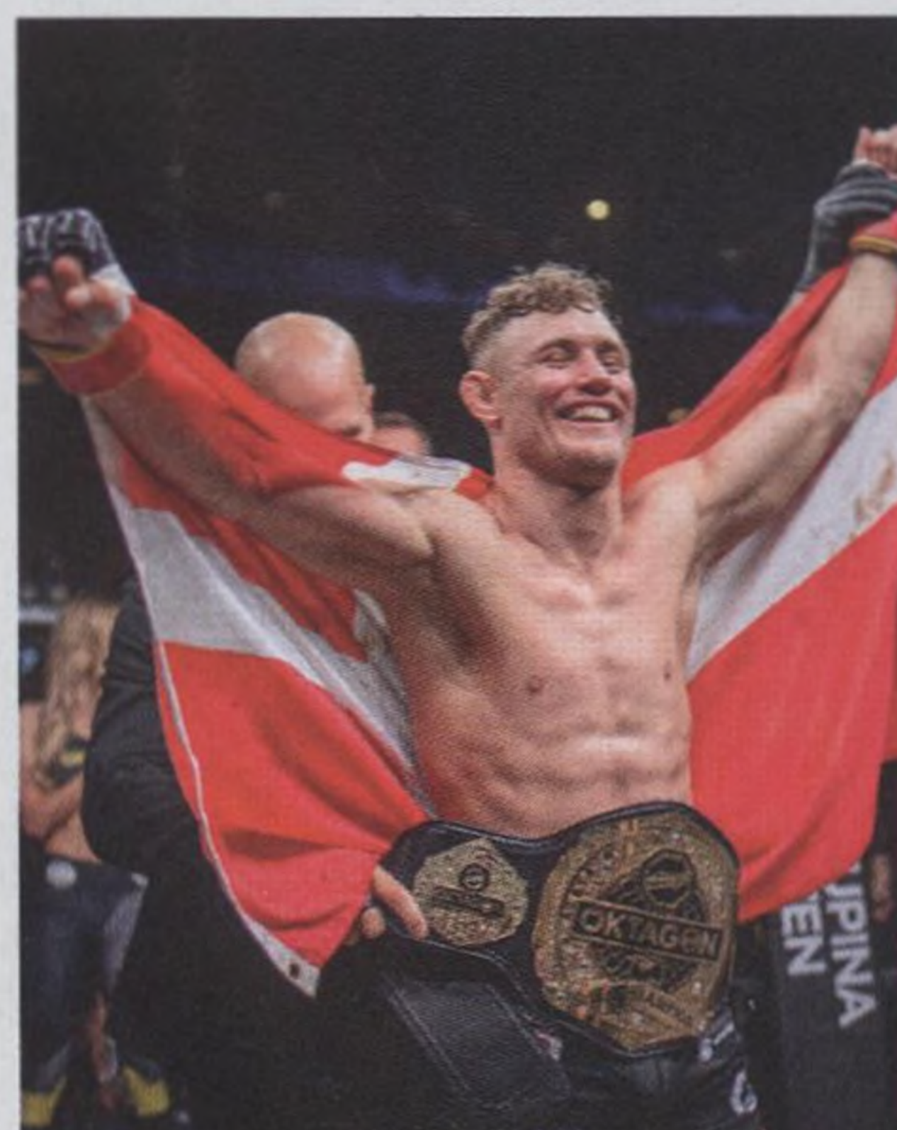
44 JONAS MÁGÁRD - šampion Oktagonu