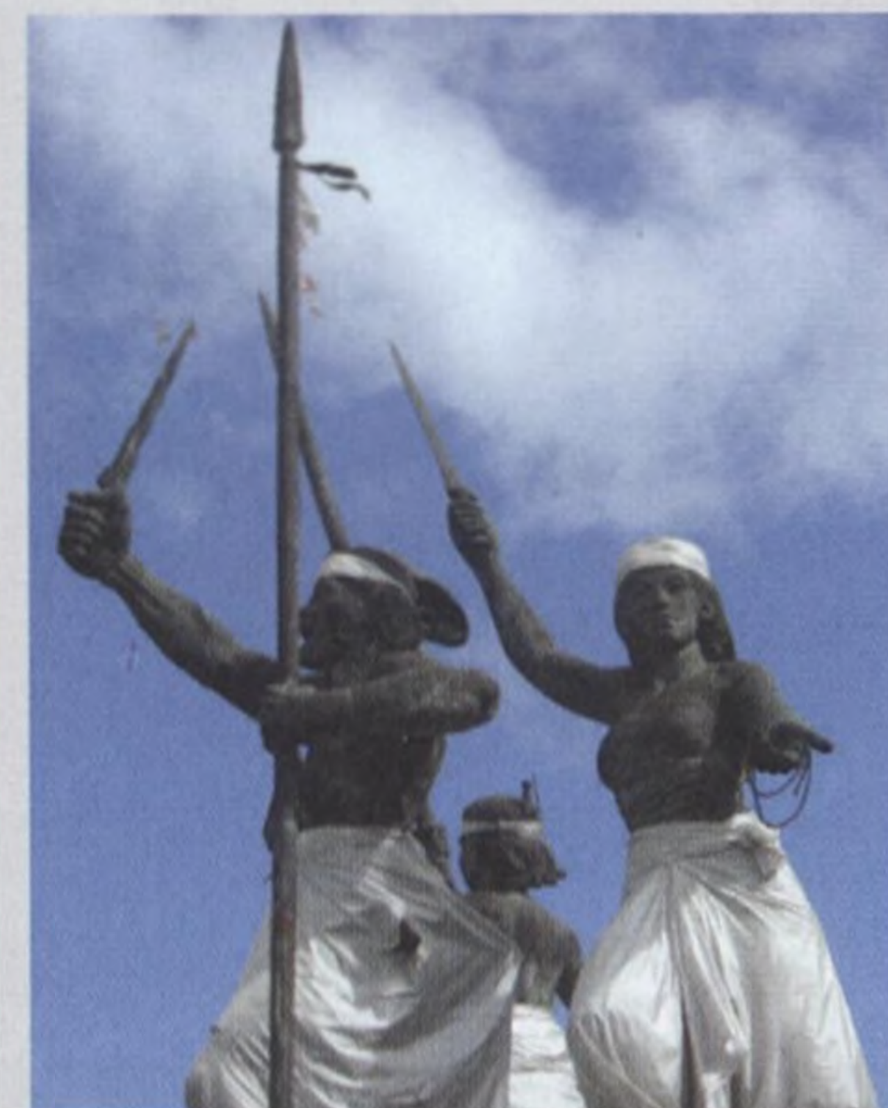
46 KRIS - tajemná zbraň z jihovýchodní Asie