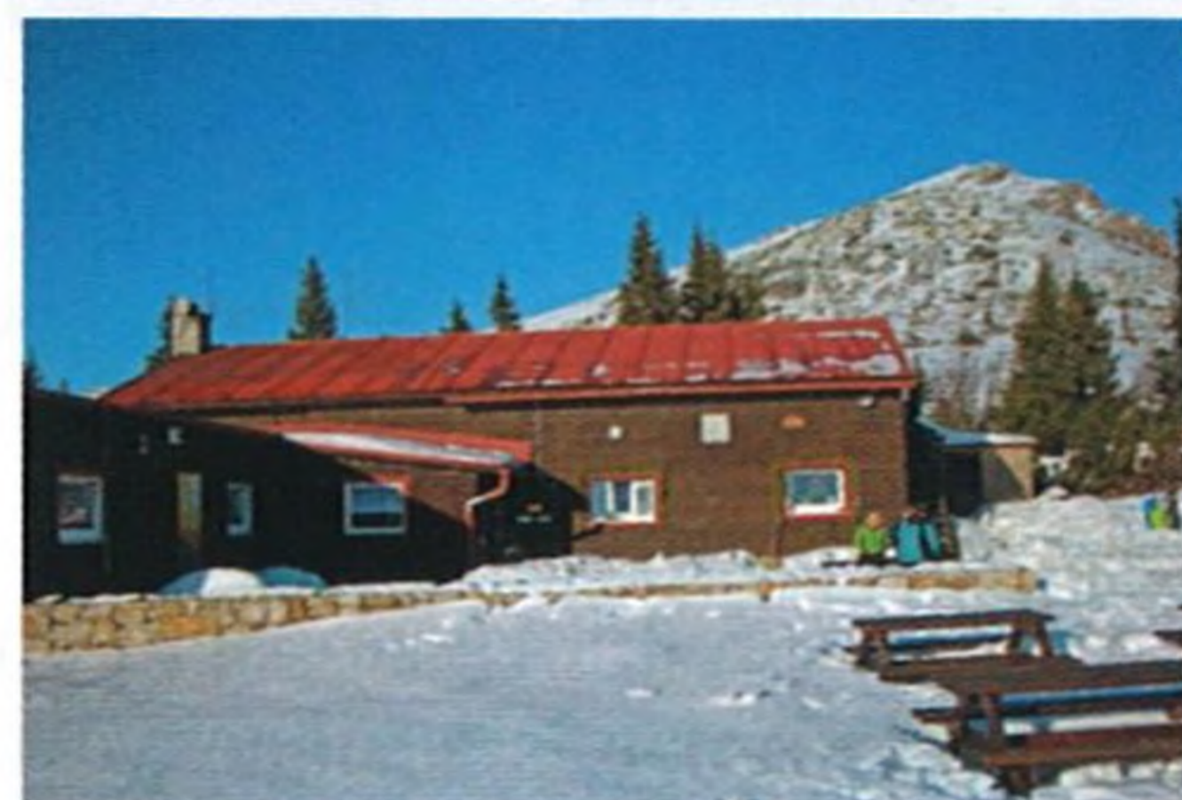
Foto na prednej strane obálky: Kojšovská hoľa v zime, Karol Mizla