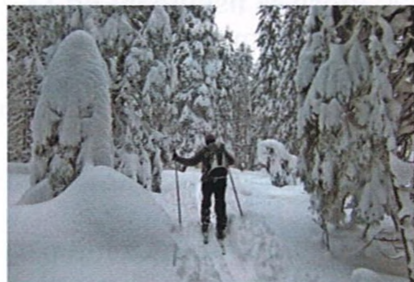
Foto na obálke: Vila Dr. Szontagh v Novom Smokovci, Ivan Bohuš ml.