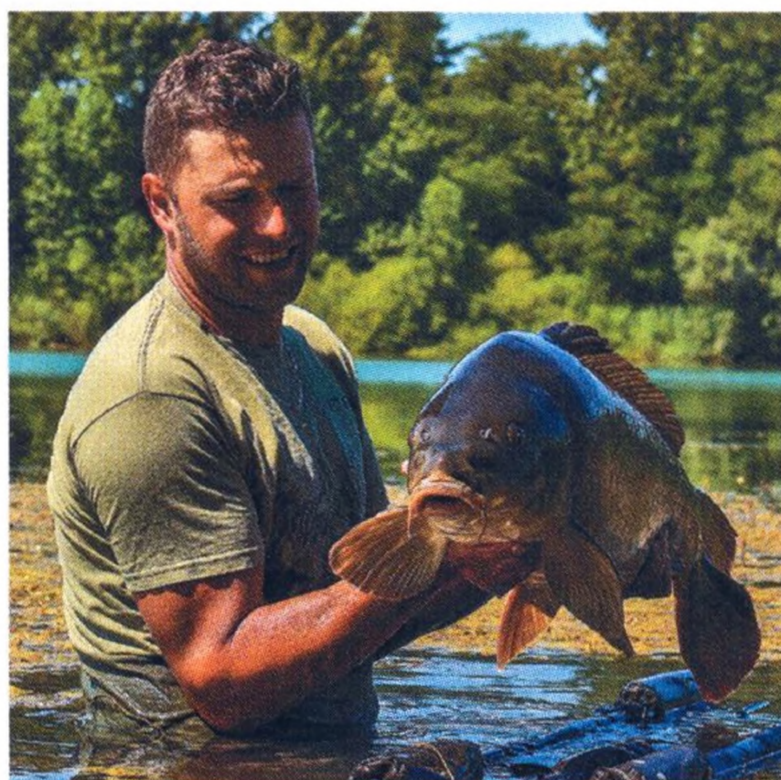
14 Na skok ve Slovinsku