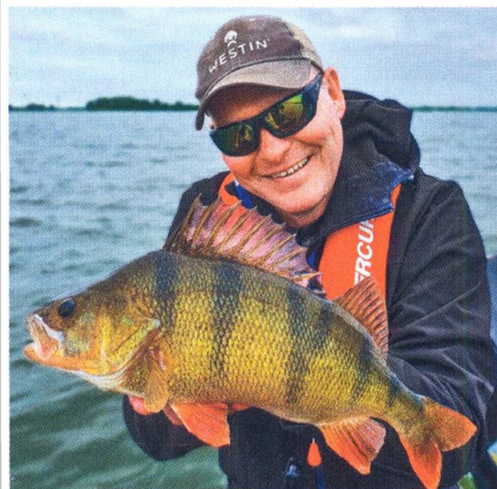
04 Doba okounová