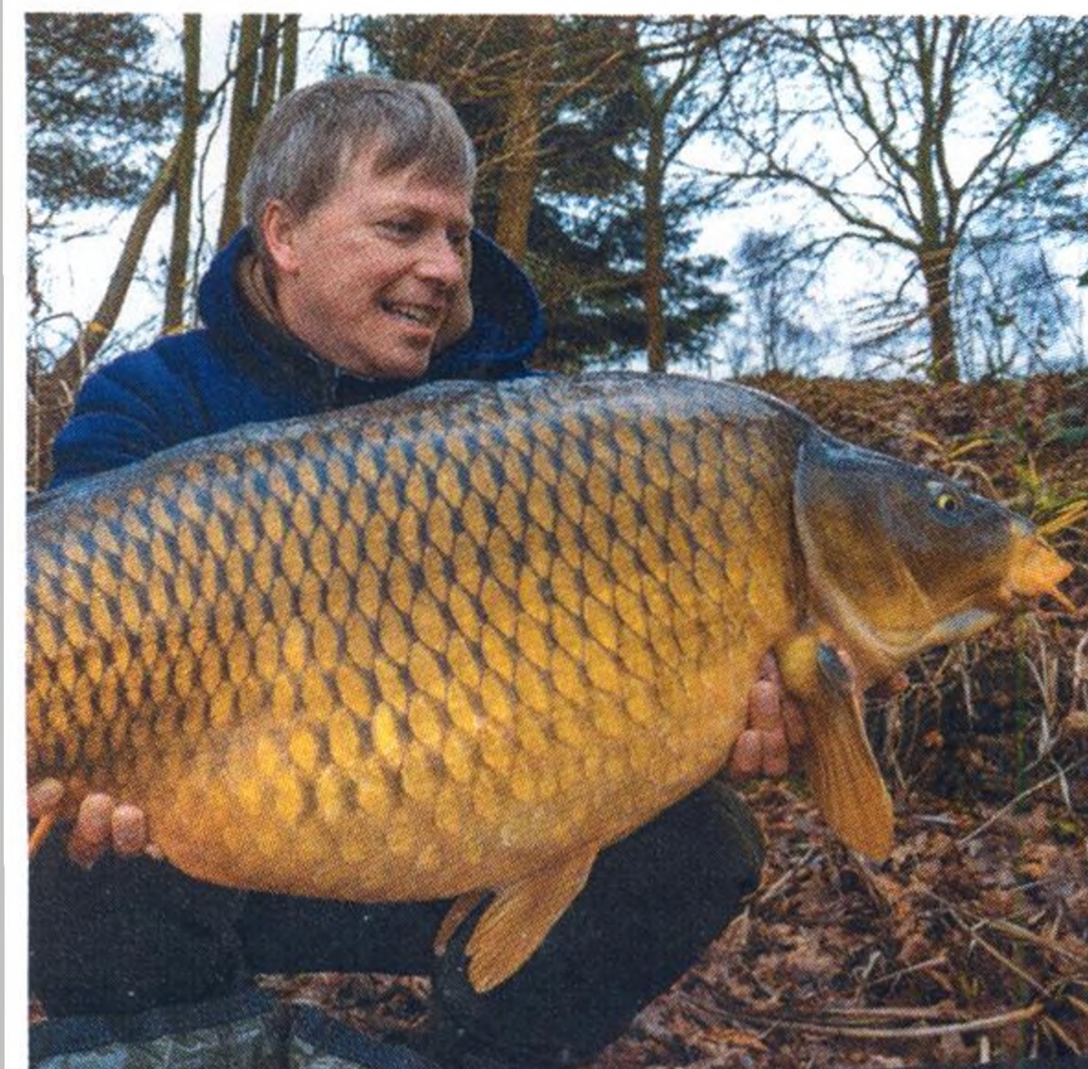
18 Popotáhnout montáže?! Detaily, které rozhodují