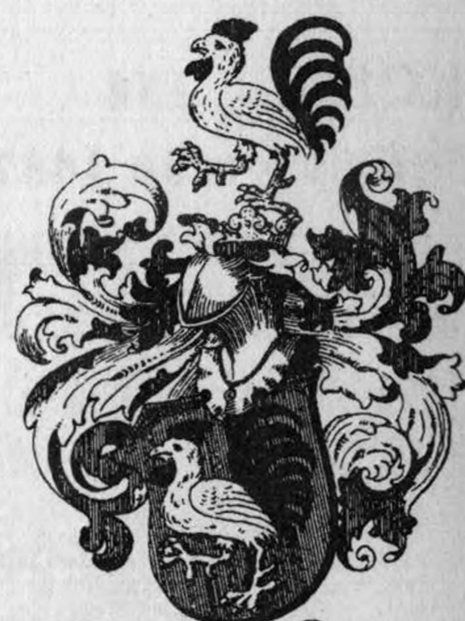
Carant z Polze.