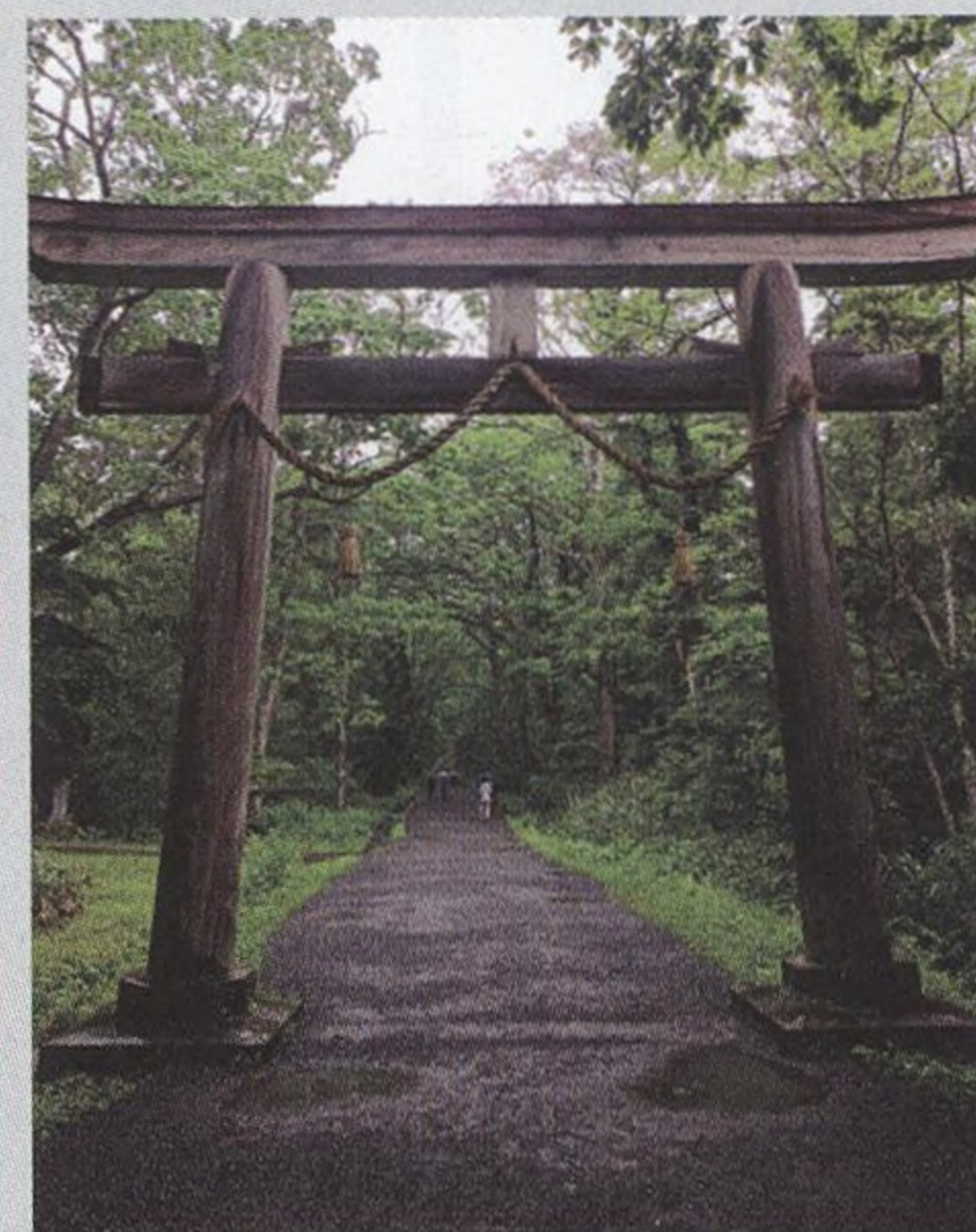
62 K PRAMENŮM NINJUTSU