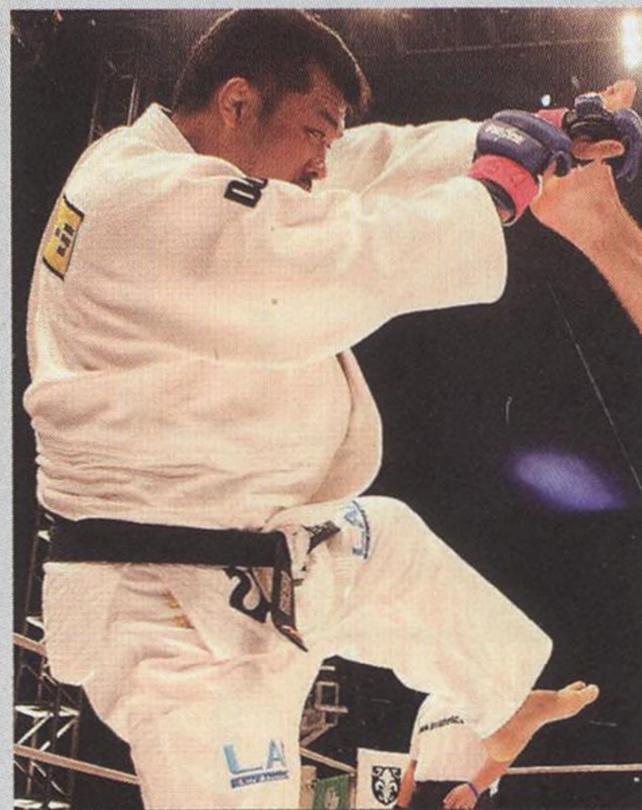
16 Giganti sportu, kteří okusili boj v kleci