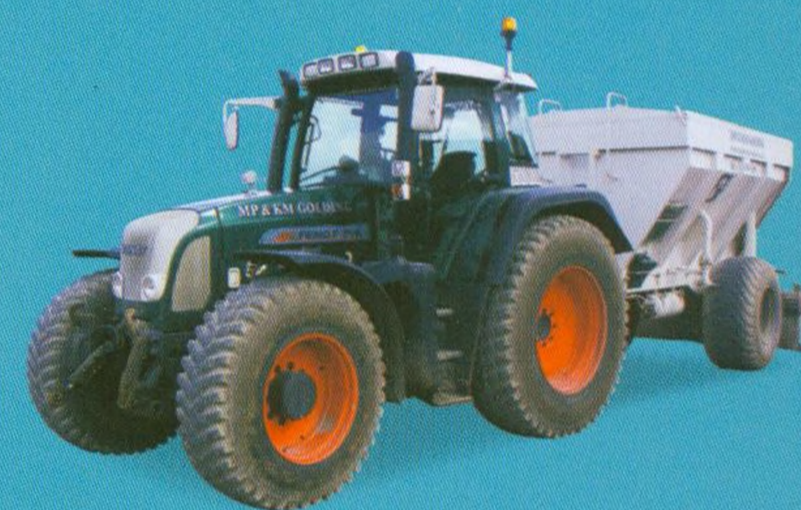
Stavební traktory 28