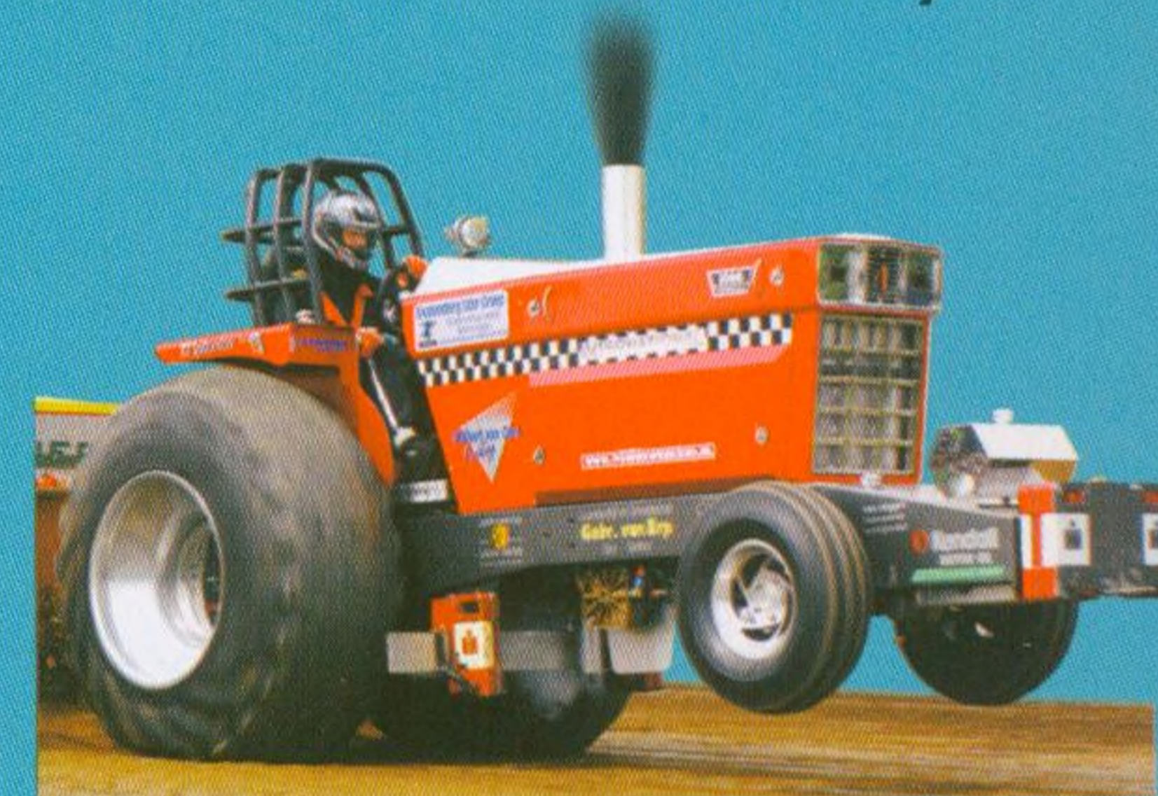
Závodní traktory 30