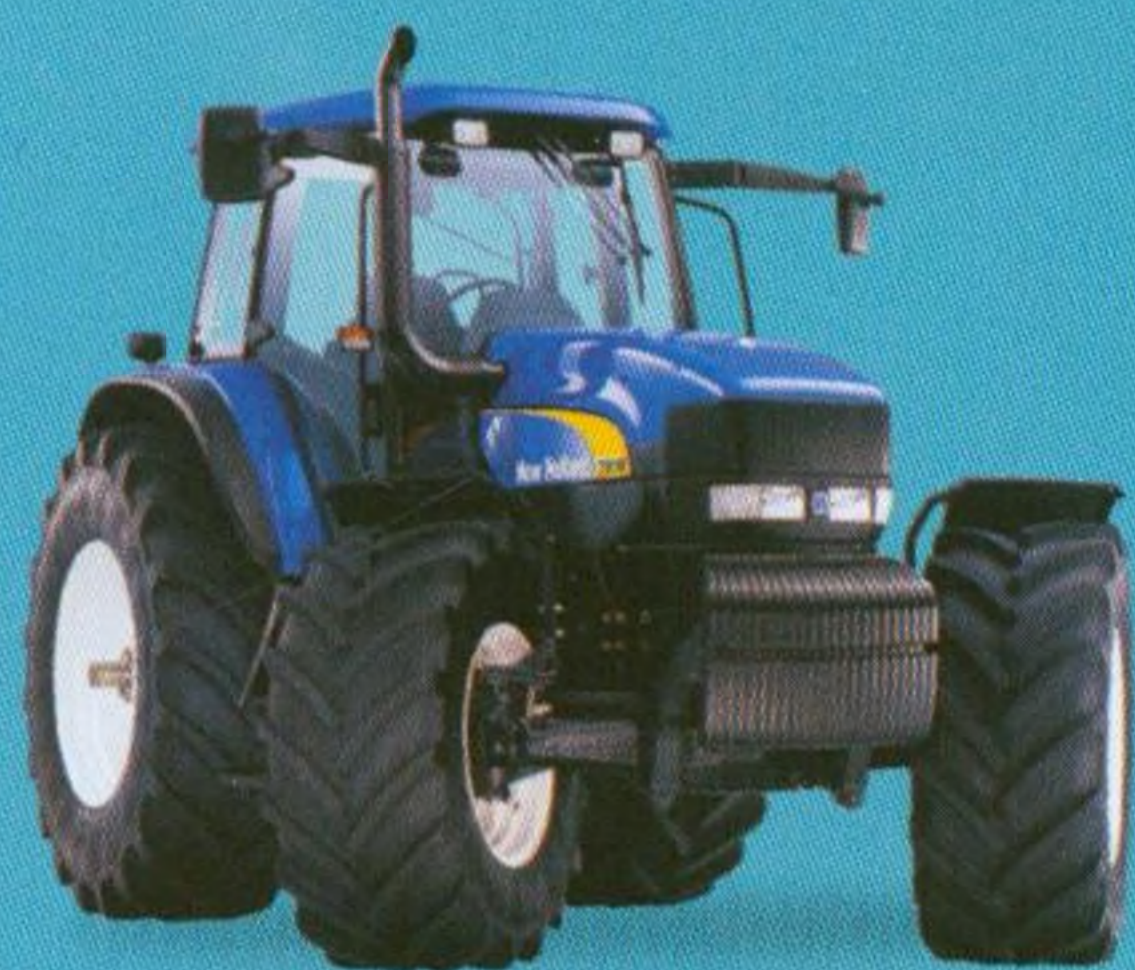
Traktory v zemědělství 4