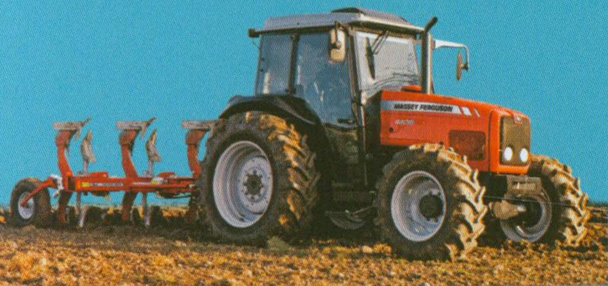
Traktory a pluhy 10