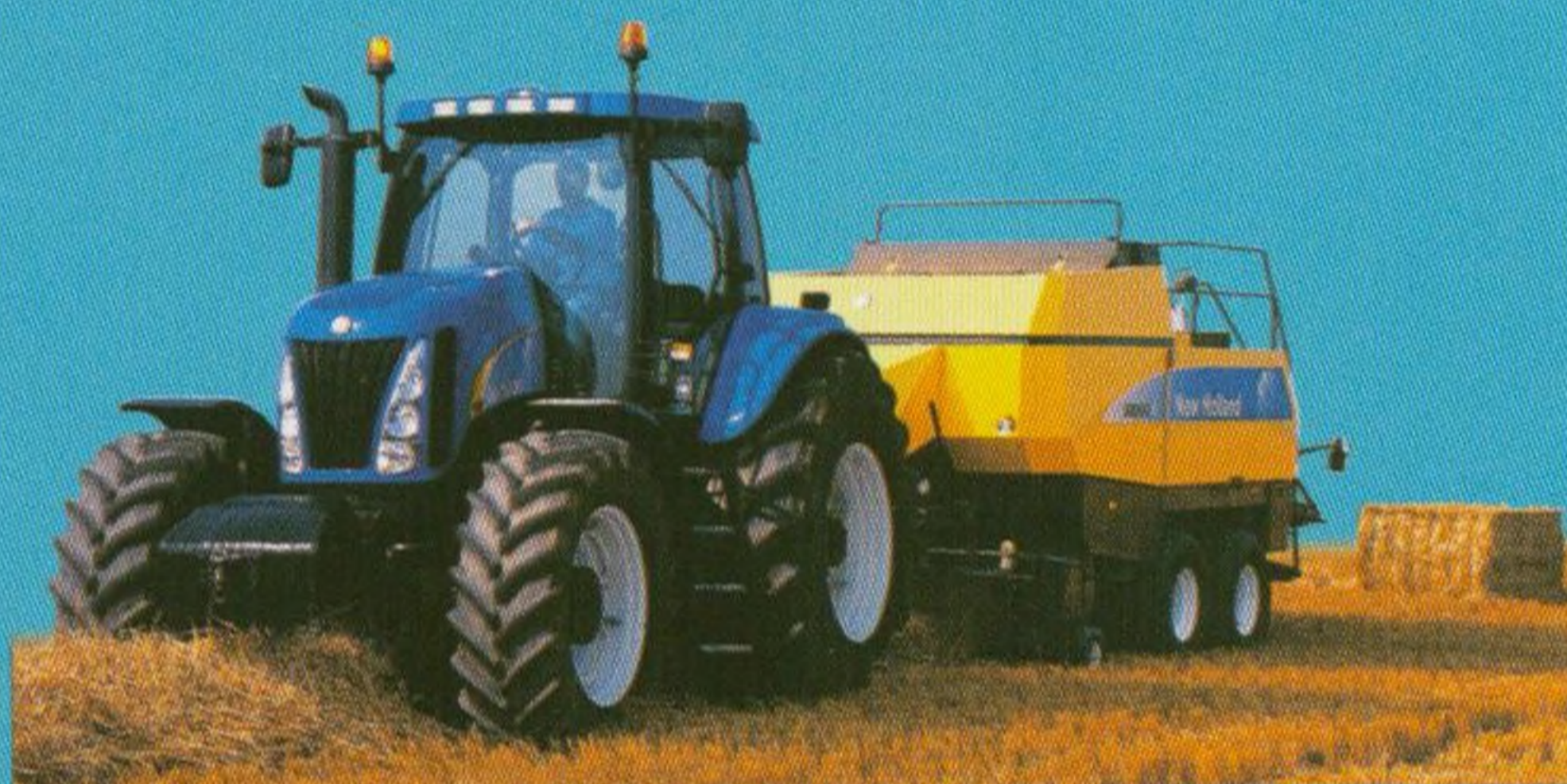
Svinovací lisy 18