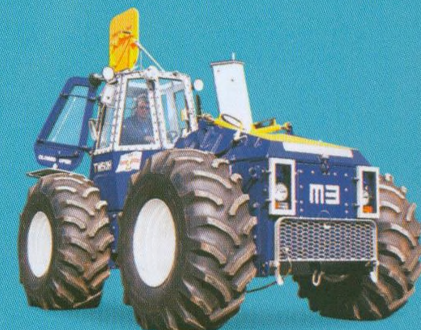
Záchranné stroje 26