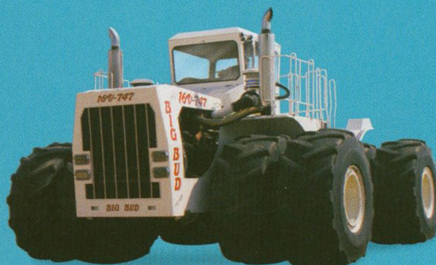
Obří traktor 22