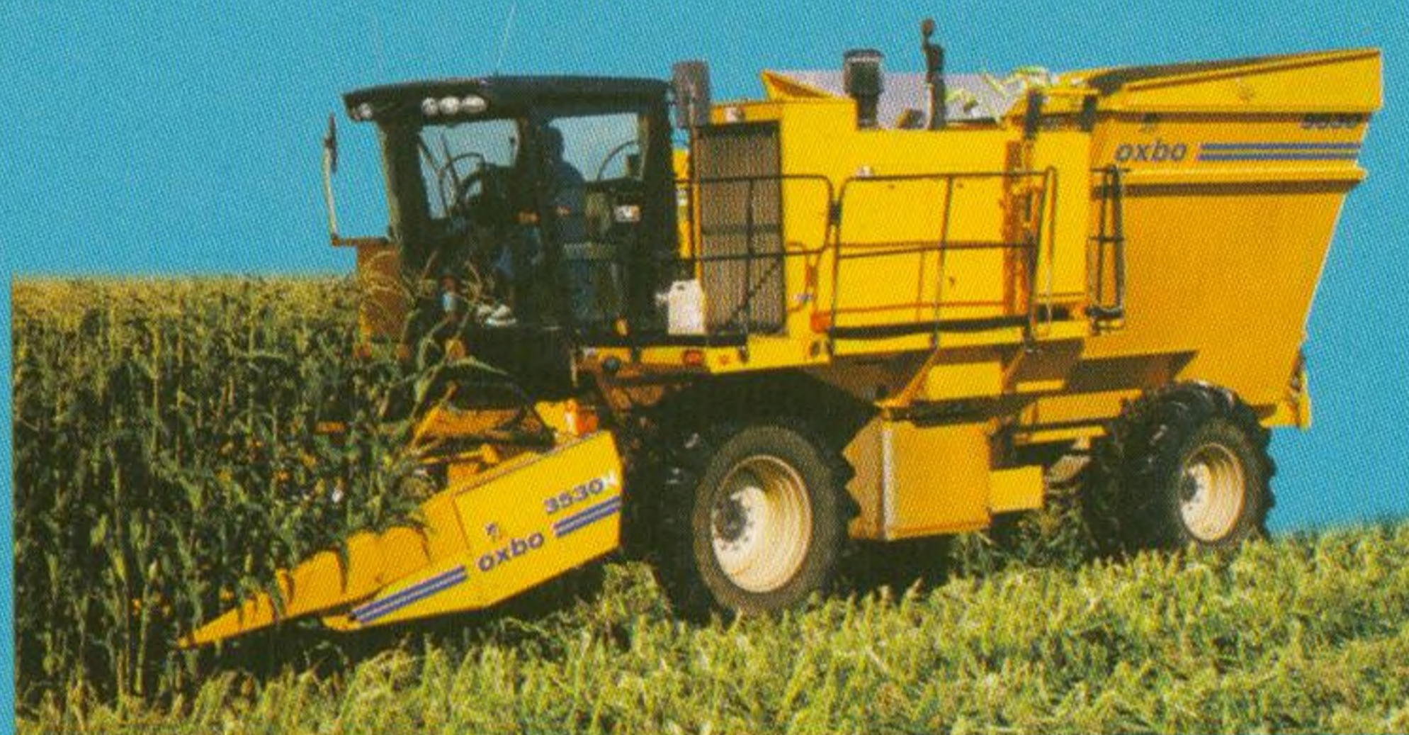
Stroje na sklizeň zeleniny 16