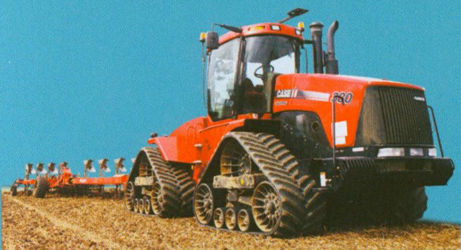
Pásové traktory 6