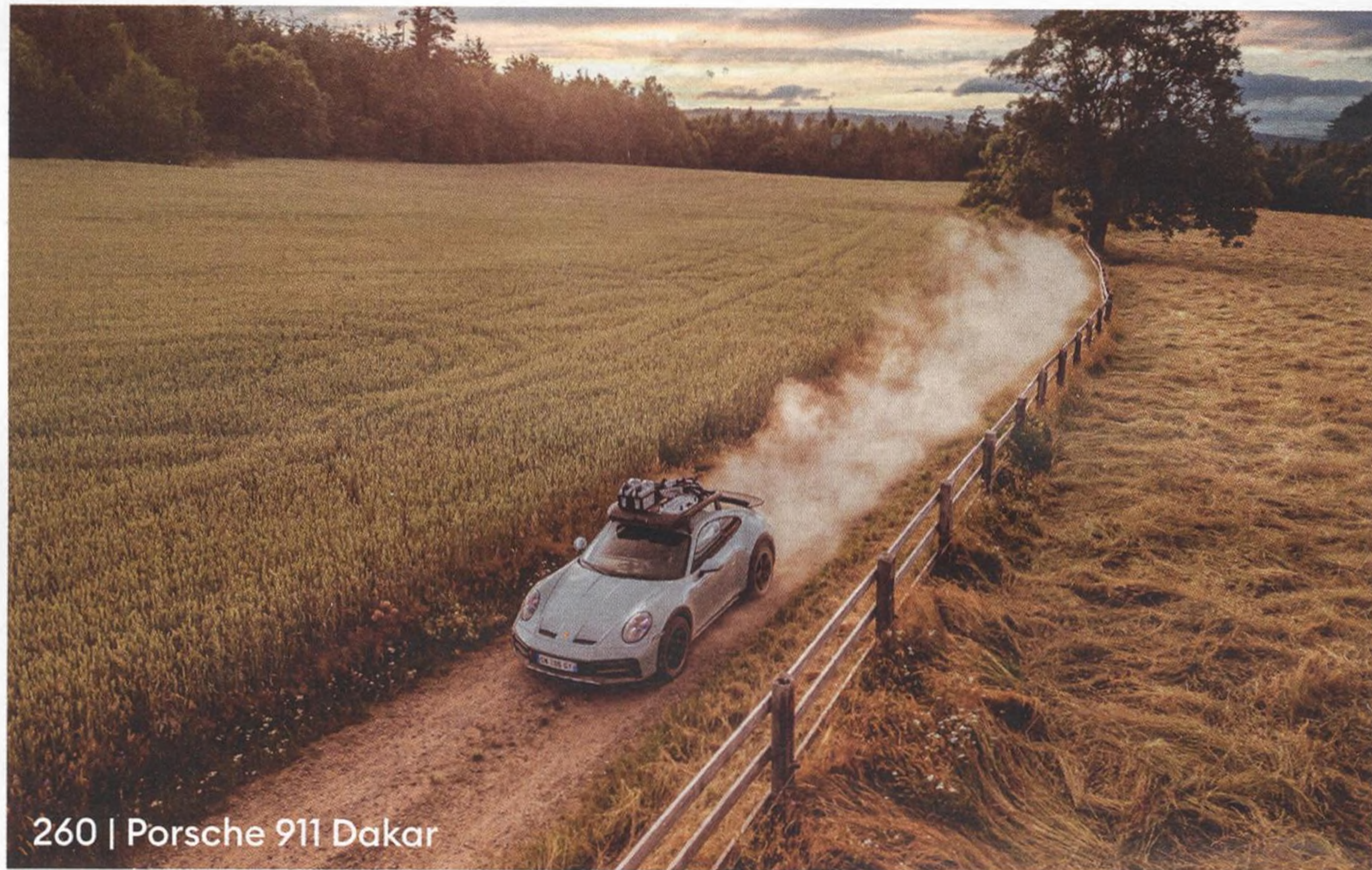
260 | Porsche 911 Dakar