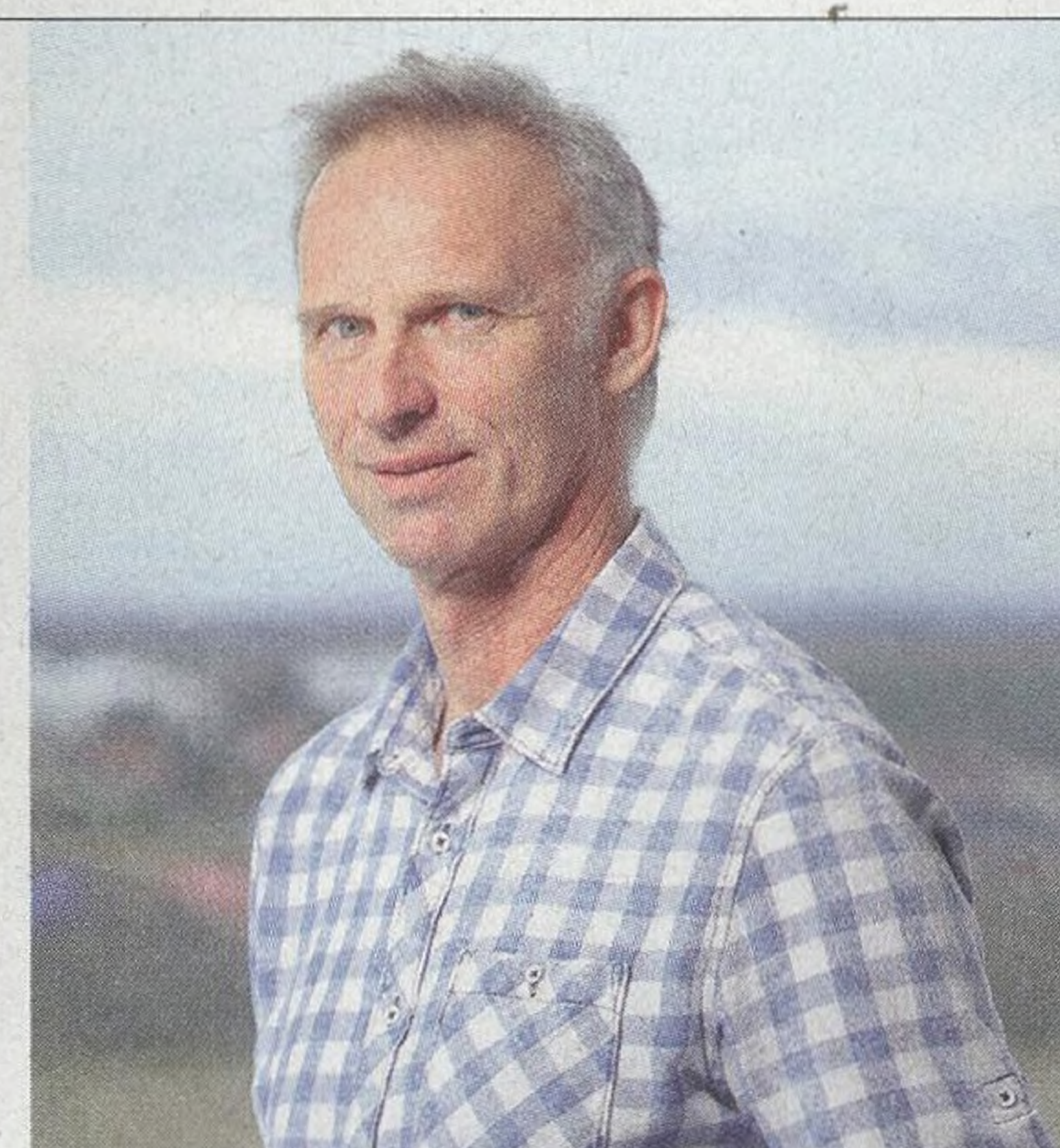
DOMINIK HAŠEK brankář, podnikatel