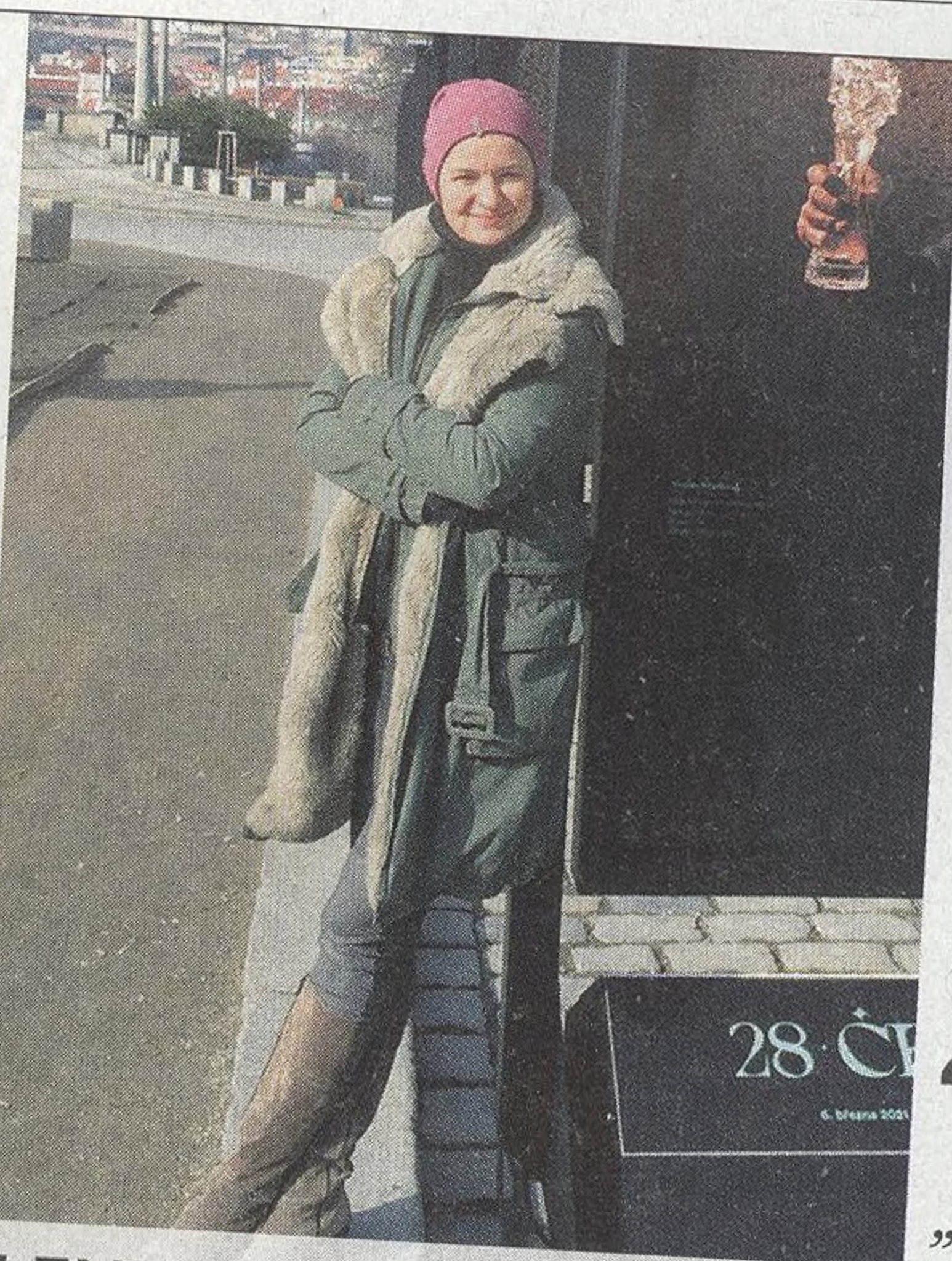
LENKA HATAŠOVÁ fotografka