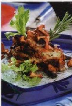
Houbové bramboráky v úpravě mille fille