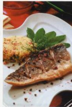
Pražma královská na pikantním kuskusu s hráškovými lusky