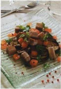
Pečený lilek s ragú ze žlutoploutvého tuňáka