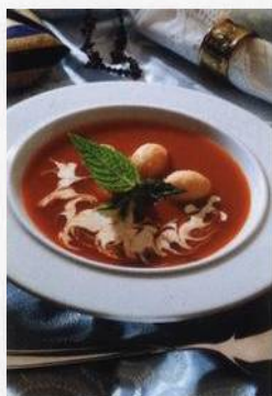
Rajská polévka s parmazánovými noky