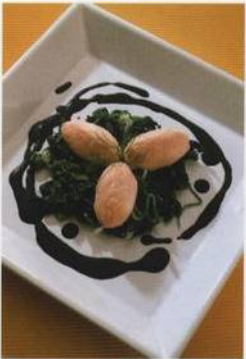
Poširované noky z lososa na listovém špenátu se sépiovou omáčkou