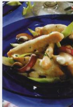
Drůbeží hranolky na kari Madras