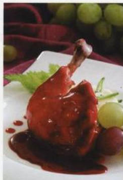
Coq au vin – kohout dušený na červeném víně