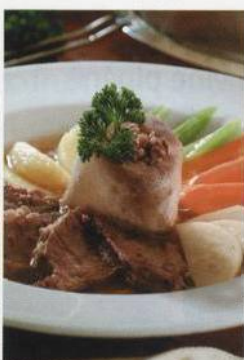
Hovězí žebro a morková kost v silné polévce se zeleninou a brambory