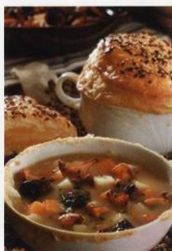
Zapečená bramboračka s hříbký pod listovým těstem