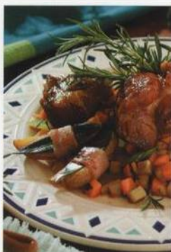
Vepřové maso pečené na česneku a zelenině