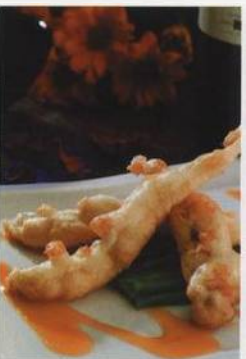
Smažený kapr v těstíčku s omáčkou sweet & sour podávaný na fazolových luscích