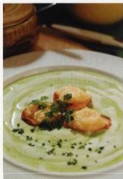
Brokolicový krém s parmazánovými krutony