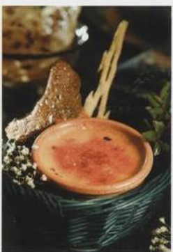
Crème brulle podle originálního francouzského receptu