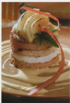
Gratinovaný žemlový nákyp na omáče San Remo aneb česká zembába