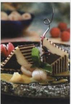
Vanilkovočokoládová terinka na omáče jack-fruit s marinovaným rambutanem a liči