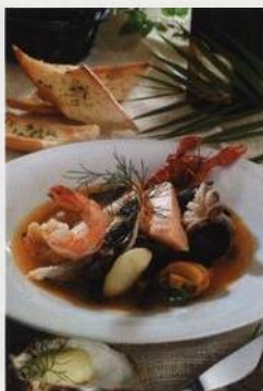
Bujabéza, francouzská polévka z bretaňského pobřeží