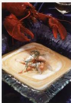
Jemný humrový krém