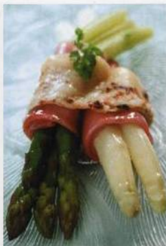
Gratinovaný chřest s parmskou šunkou a sýrem Raclett