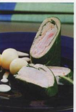
Treska Merilan poširovaná v lososové fáši a mangoldových listech na vinné kerblíkové omáče s divokou rýží