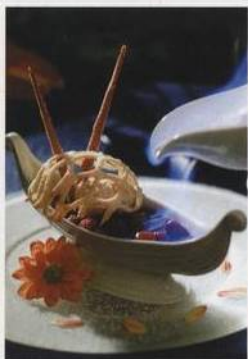
Horké třešně v karamelu se smetanovou zmrzlinou přelitá hořícím likérem