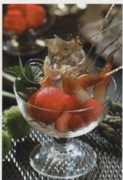
Bílý chřest v karamelu s jahodovým sorbetem