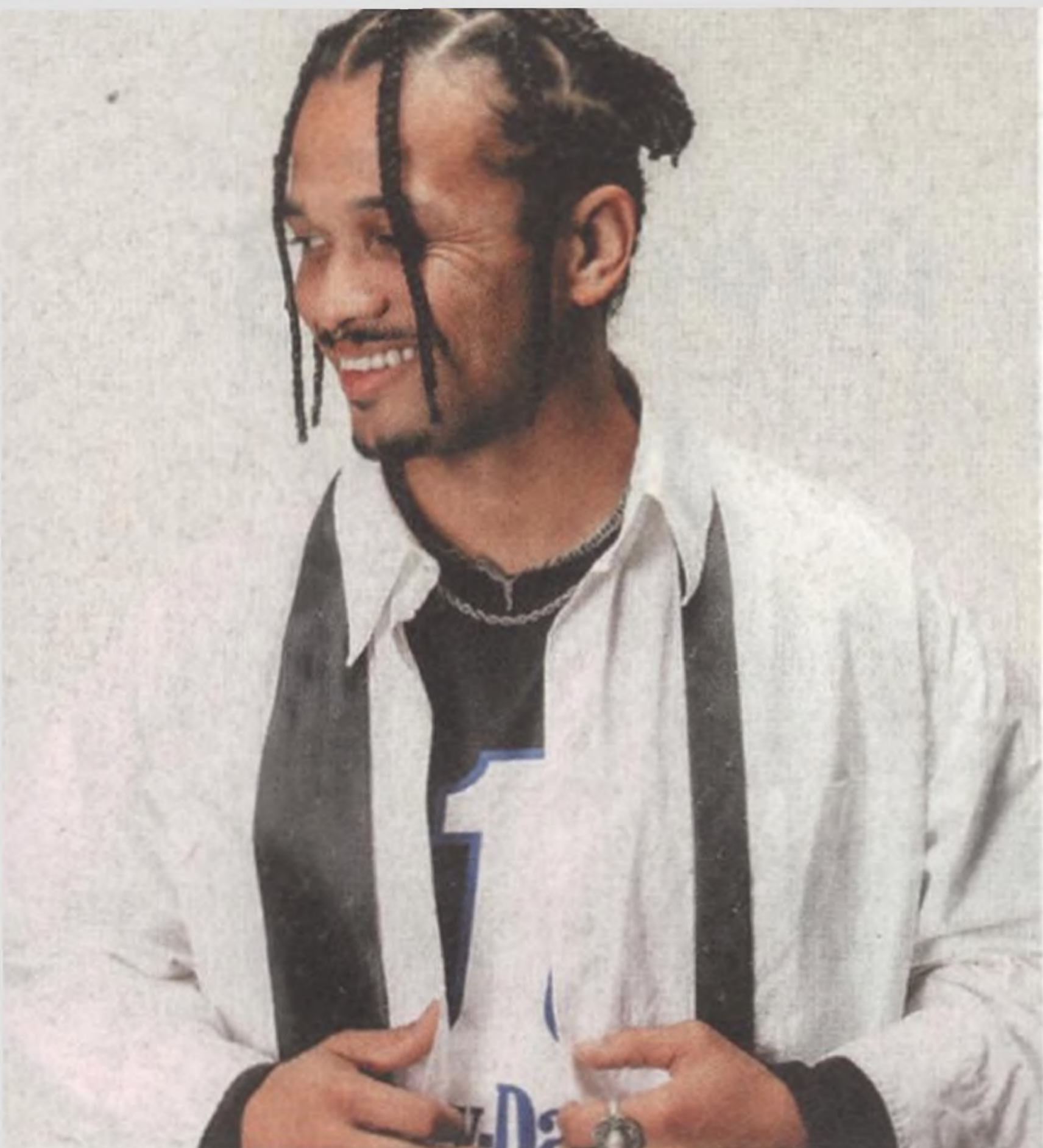
BEN CRISTOVAO zpěvák a herec