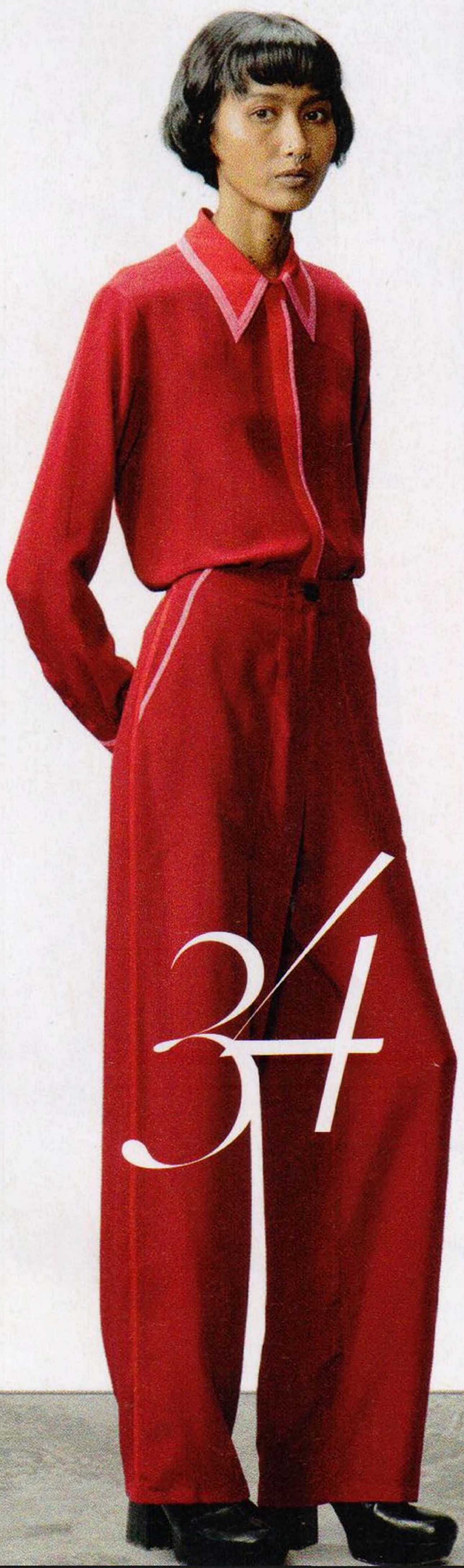
Styling LAW ROACH

Na obálce je herečka, zpěvačka a tanečnice Zendaya. Má na sobě vyšíváné minišaty s korálky, LOUIS VUITTON, náušnice, náramek a prsten, vše BULGARI, a boty, CHRISTIAN LOUBOUTIN.