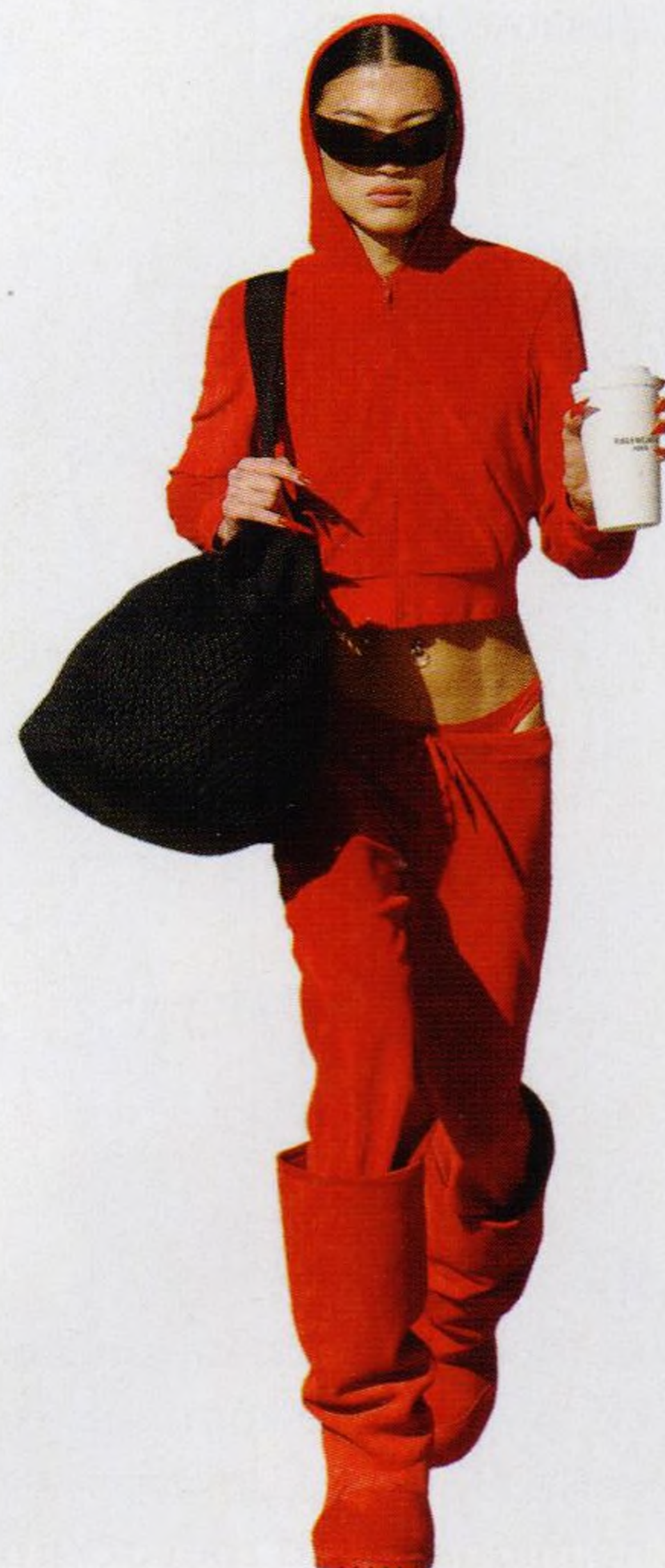
*aneb jednou venti Valentýna bez cukru str. 90