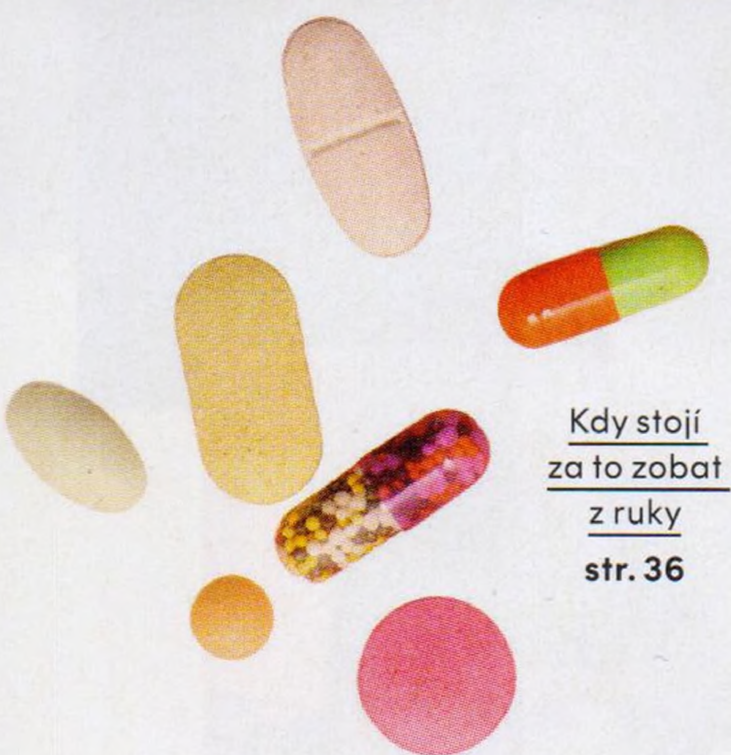
Kdy stojí za to zobat z ruky str. 36