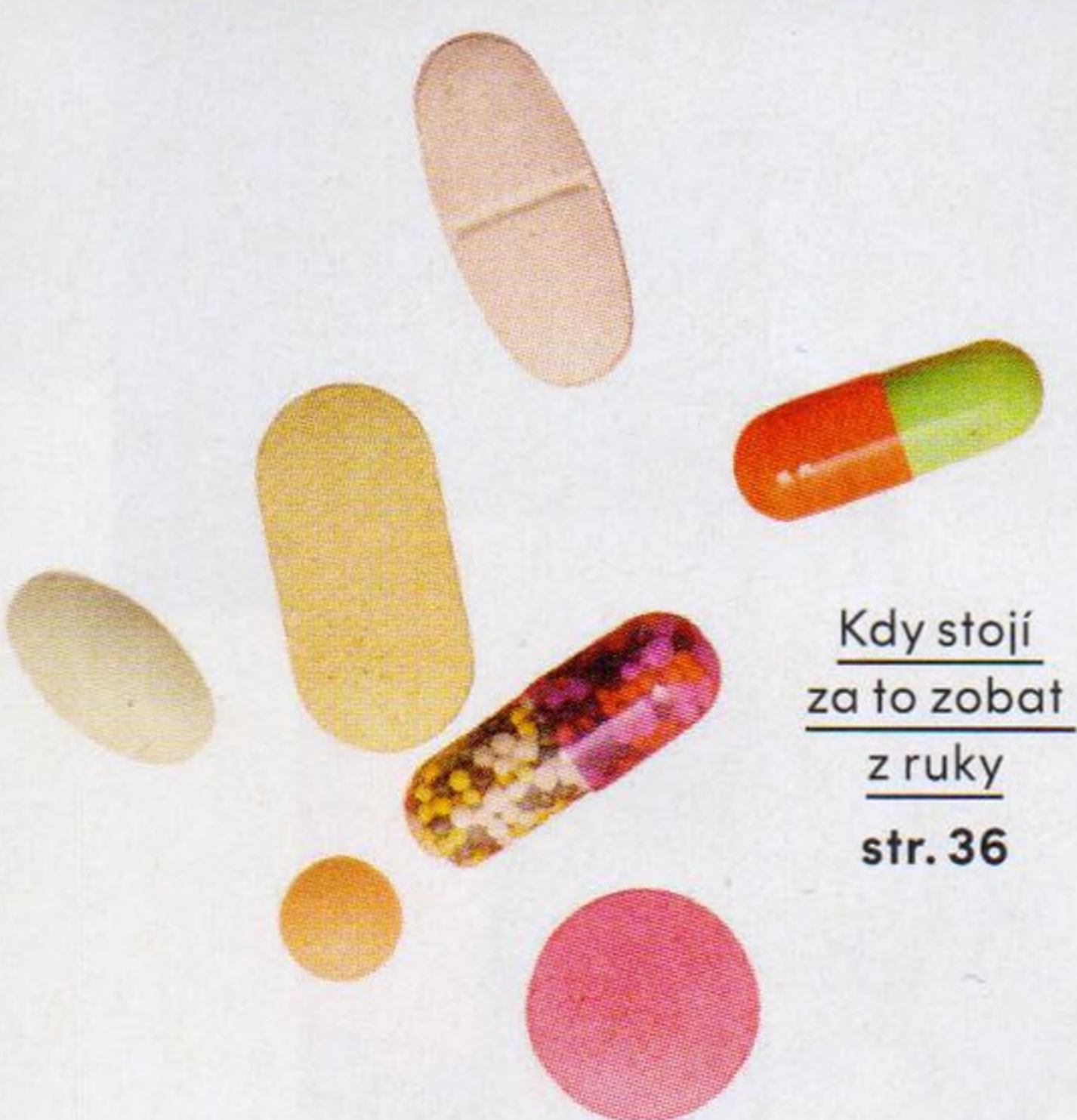
Kdy stojí za to zobat z ruky str. 36