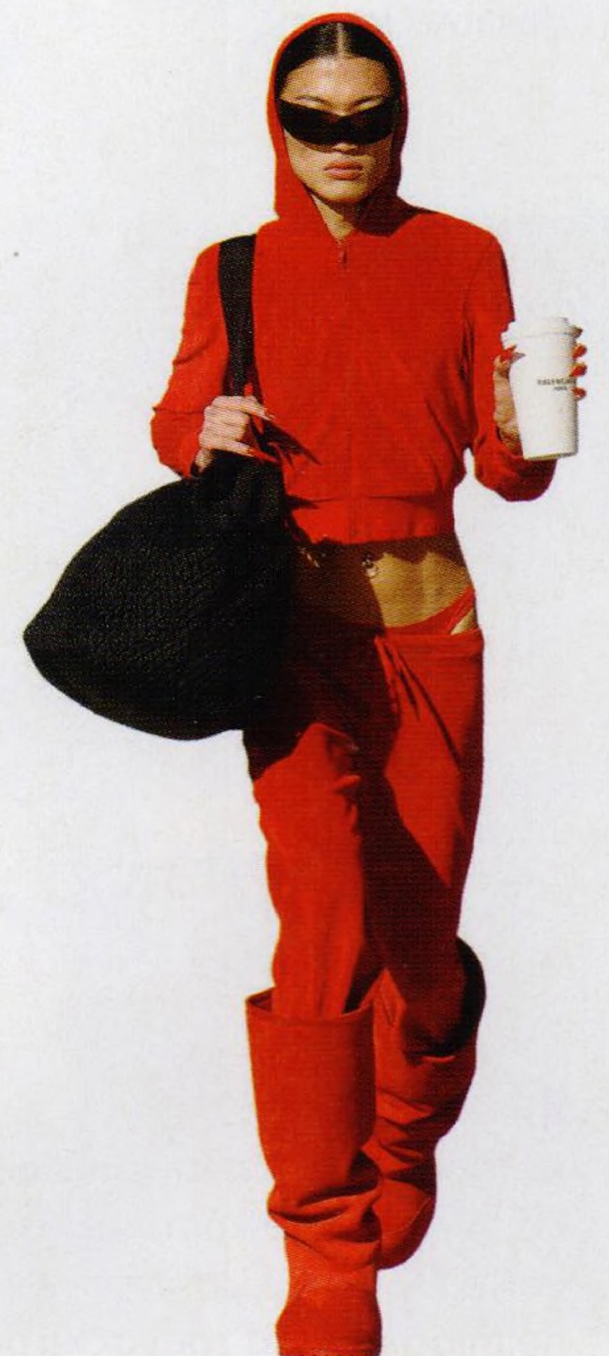
*aneb jednou venti Valentýna bez cukru str. 90