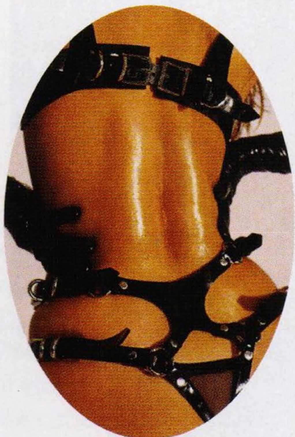
Oblečte se na *to*, jako by nebylo zítřka str. 98