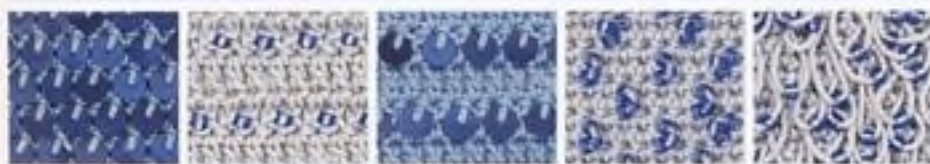
179 Krátké sloupky s flitry