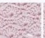
58 Vějířkový vzor