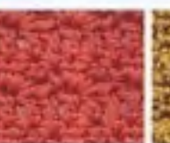
53 Vrstvený vzor