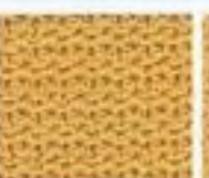
48 Vzor z polosloupků V