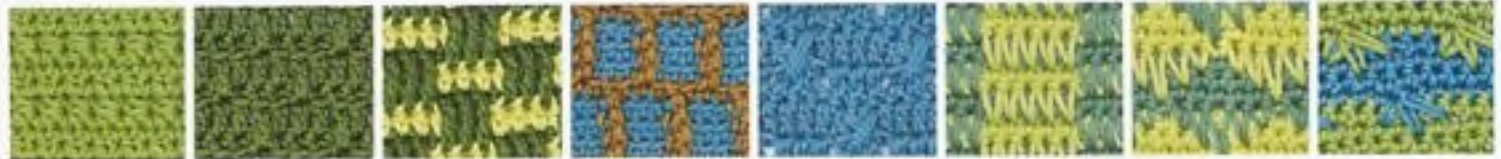
105 Malé sedmikrásky