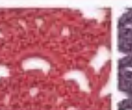
60 Vějíře s pikotkami