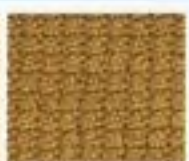
46 Bobule v rovných řadách