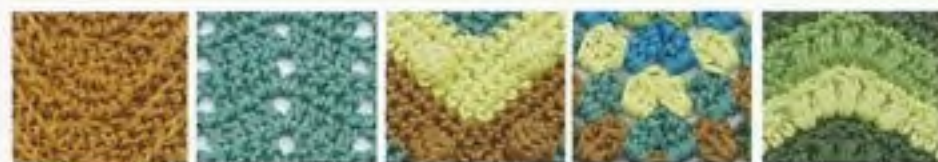
169 Reliéfový krokový vzor