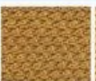
47 Bobule v ne- pravidelných řadách