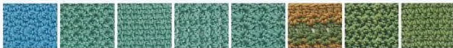
41 Proplétaná oka