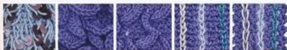
182 Smyčky s flitry