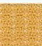
49 Vzor z párových ok V