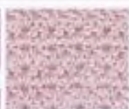
64 Šňůrkový vzor