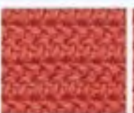
52 Rybí vzor z polosloupků