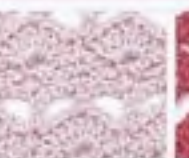
59 Štovičkový list