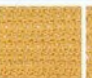
48 Vzor z dlouhých sloupků V