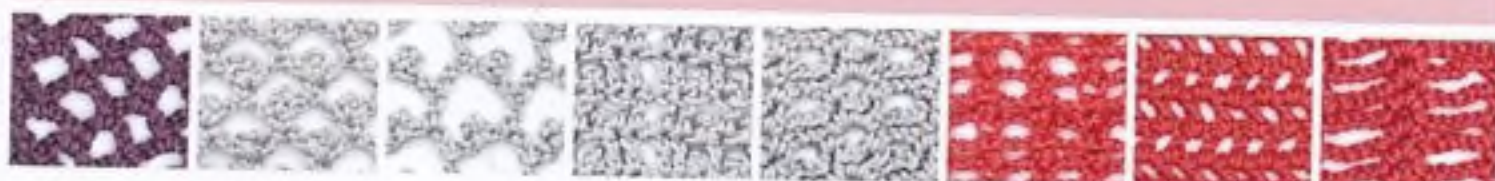
139 Obloučkový síťový vzor