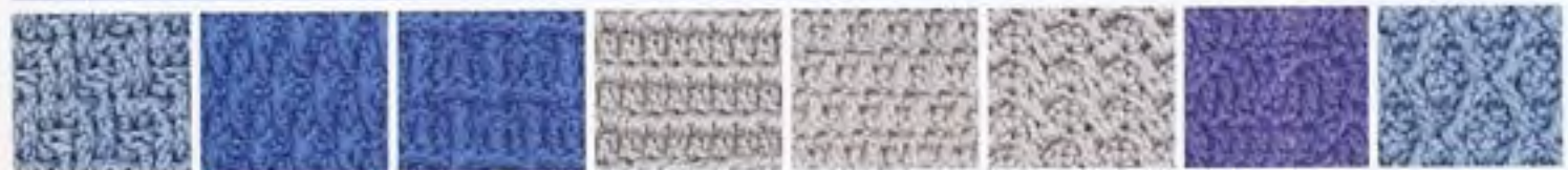
121 Reliéf ze šikmých dlouhých sloupků