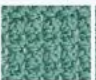
43 Vaflový vzor