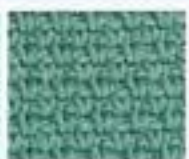
42 Tkaný vzor