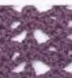
62 Mušle s pikotkami