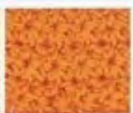
51 Trojité oko