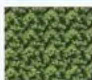
45 Krupkový vzor