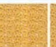
49 Vzor ze skupinek ok