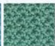
42 Pavoučí vzor