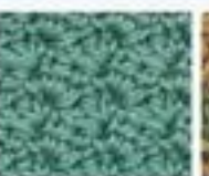
43 Rákosový vzor