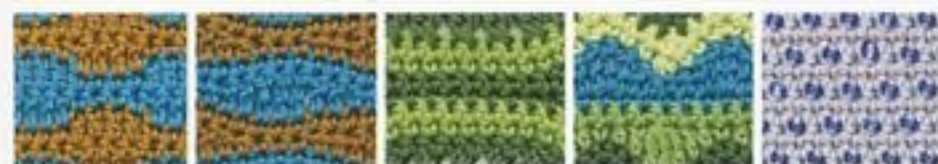
172 Vlny z na- fouknutých peciček