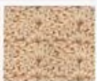
56 Volnější vroubky