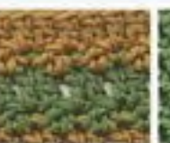
49 Kvítkový vzor