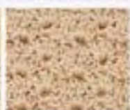
56 Vroubkový vzor