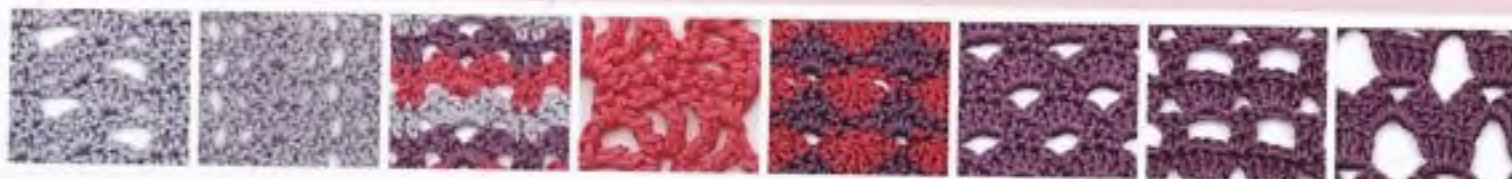
68 Střídavý mušličkový vzor