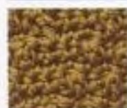
55 Šikmé řady