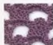
63 Okraj z pikotek