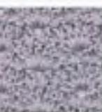
68 Spojené mušličky