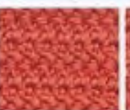
52 Rybí vzor z dlouhých sloupků