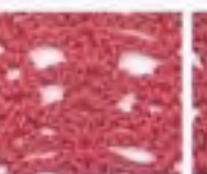
66 Jahodová krajka