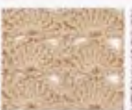
57 Paví oka