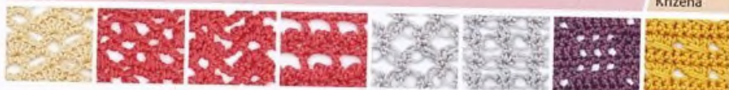
147 Pláštve s vějířky