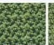
44 Zrnkový vzor