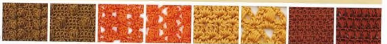
94 Párované popkornové pecičky