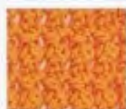
50 Špičatá oka