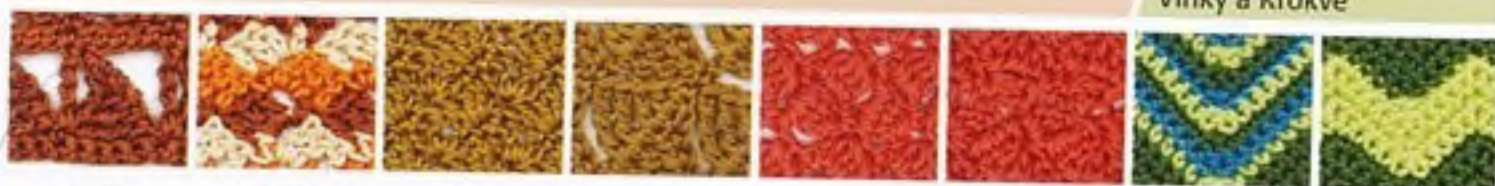
160 Převrácené trojúhelníky