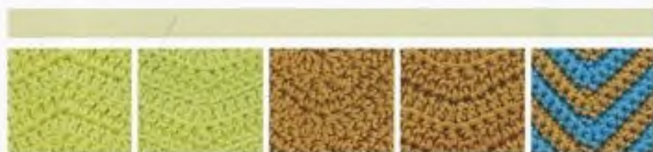
167 Jednoduché krokve