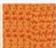
50 Hrači deska