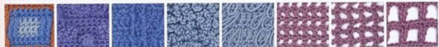
130 Reliéfové čtverce