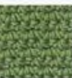
45 Mřížkový vzor