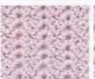
65 Větvičkový vzor