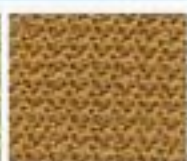
46 Mechový vzor