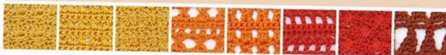
154 Patchwork – kapustičky