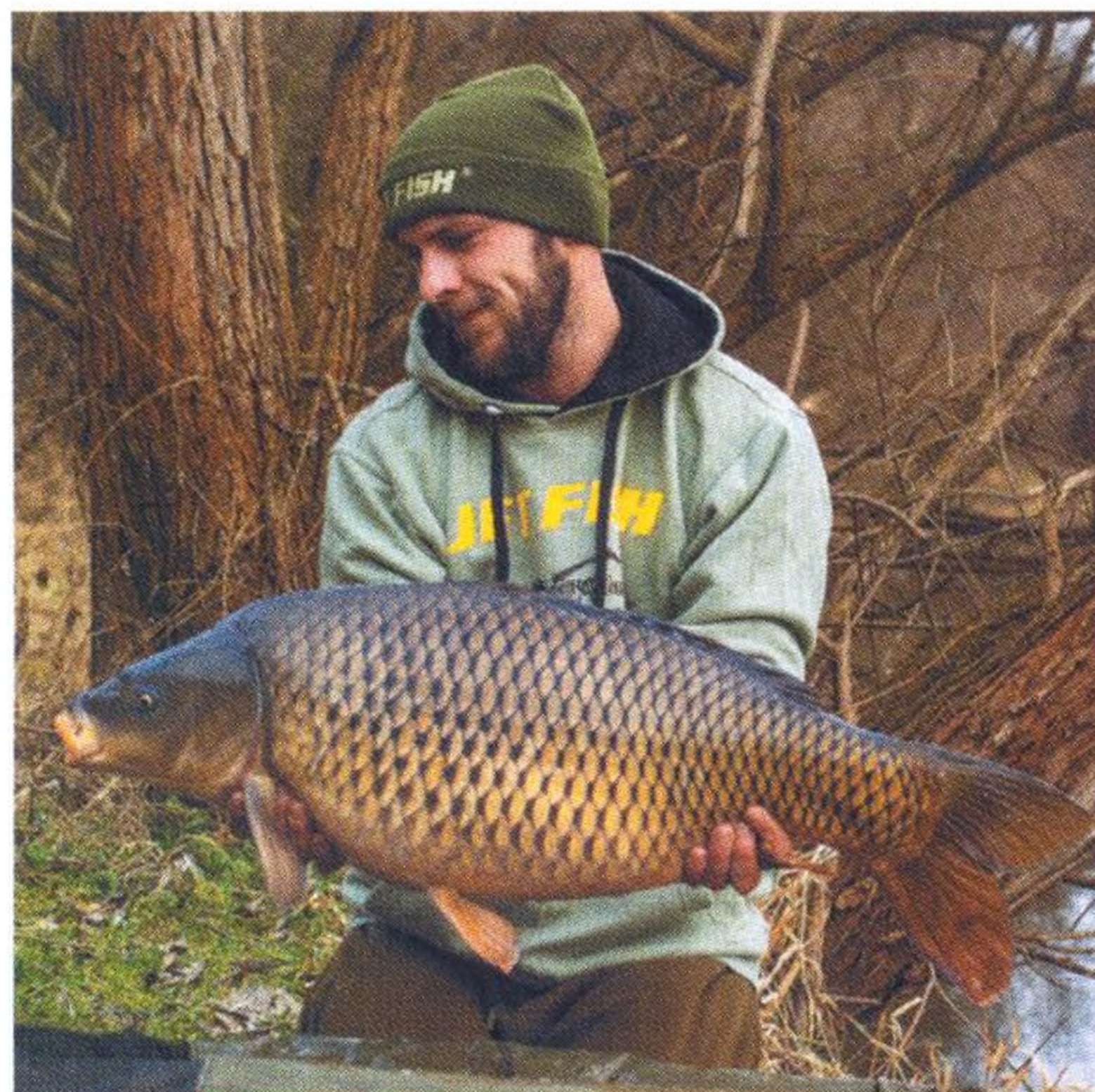
14 První jarní lovy