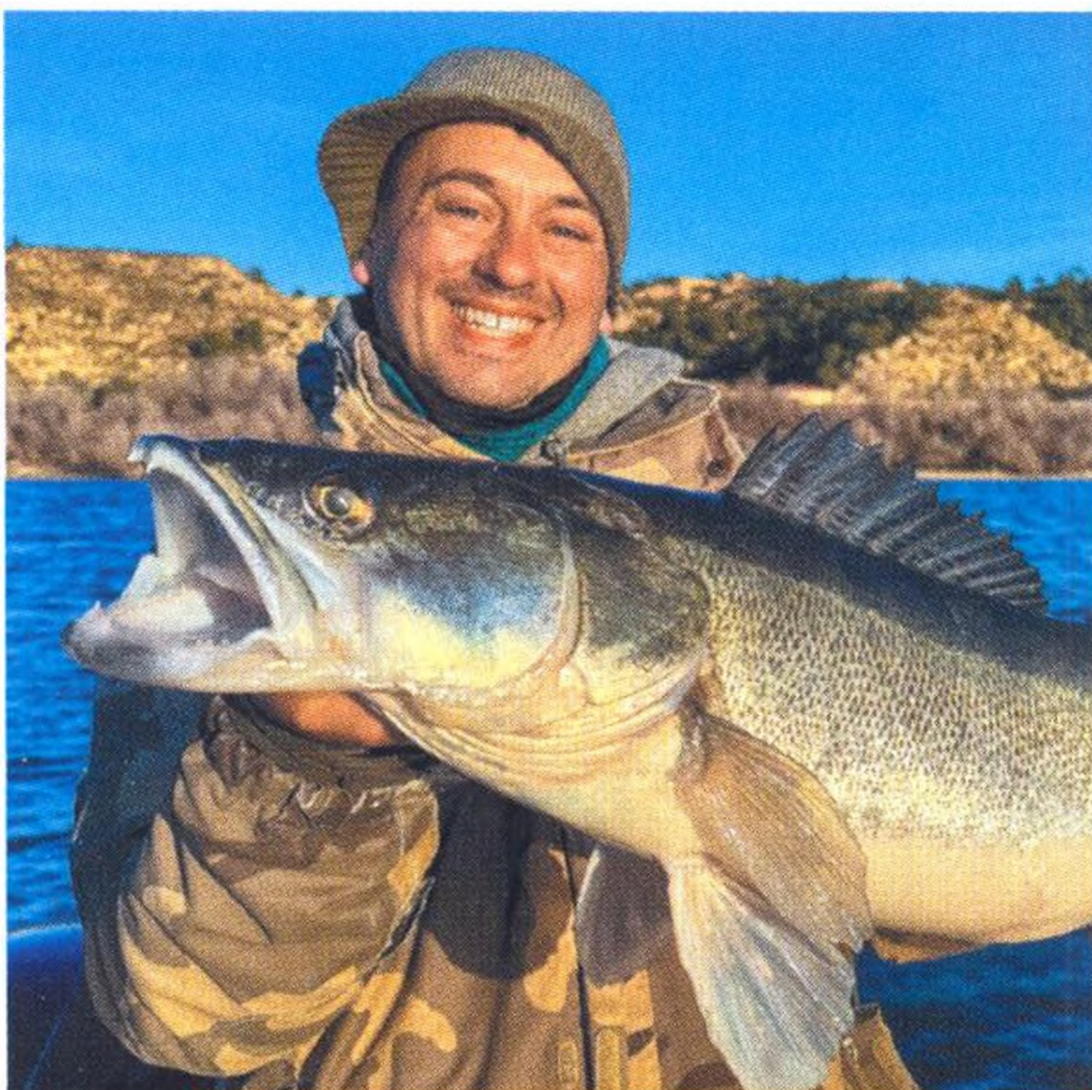
04 Rozmary španělského jara