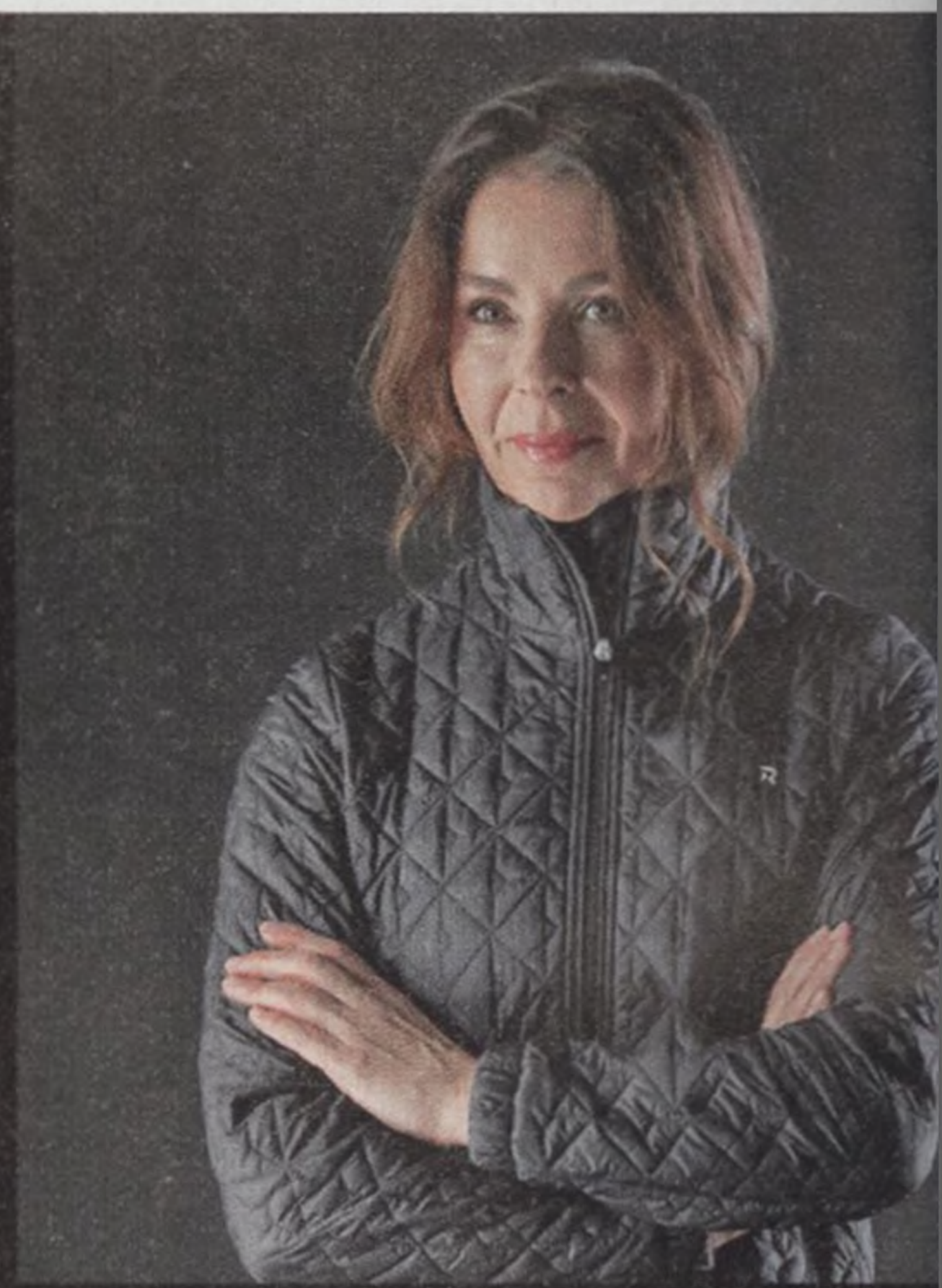
RENATA CHLUMSKÁ horolezkyně

„Kritiky jsou nebezpečné, protože zbavují sebevědomí.“