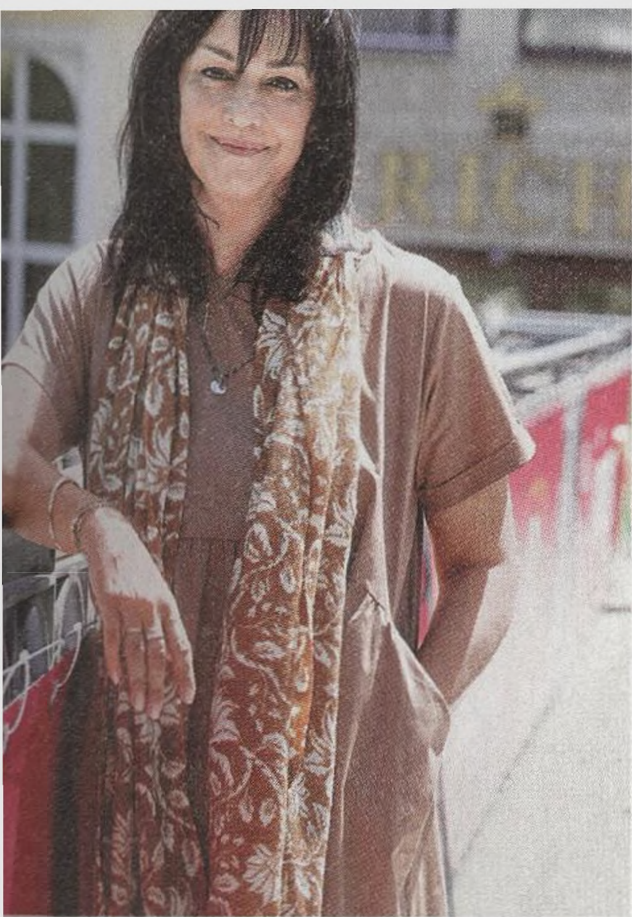
TEREZA BRODSKÁ herečka