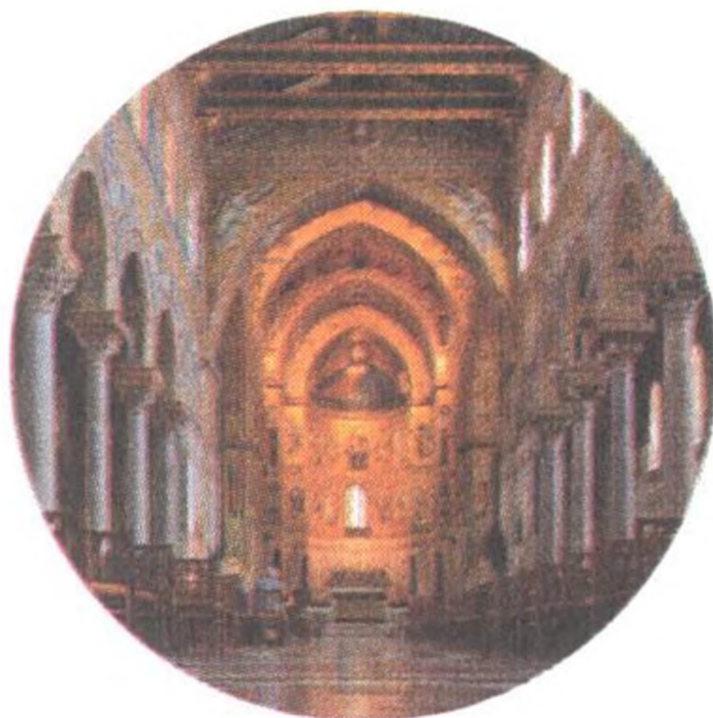
Cattedrale di Monreale (str. 78)