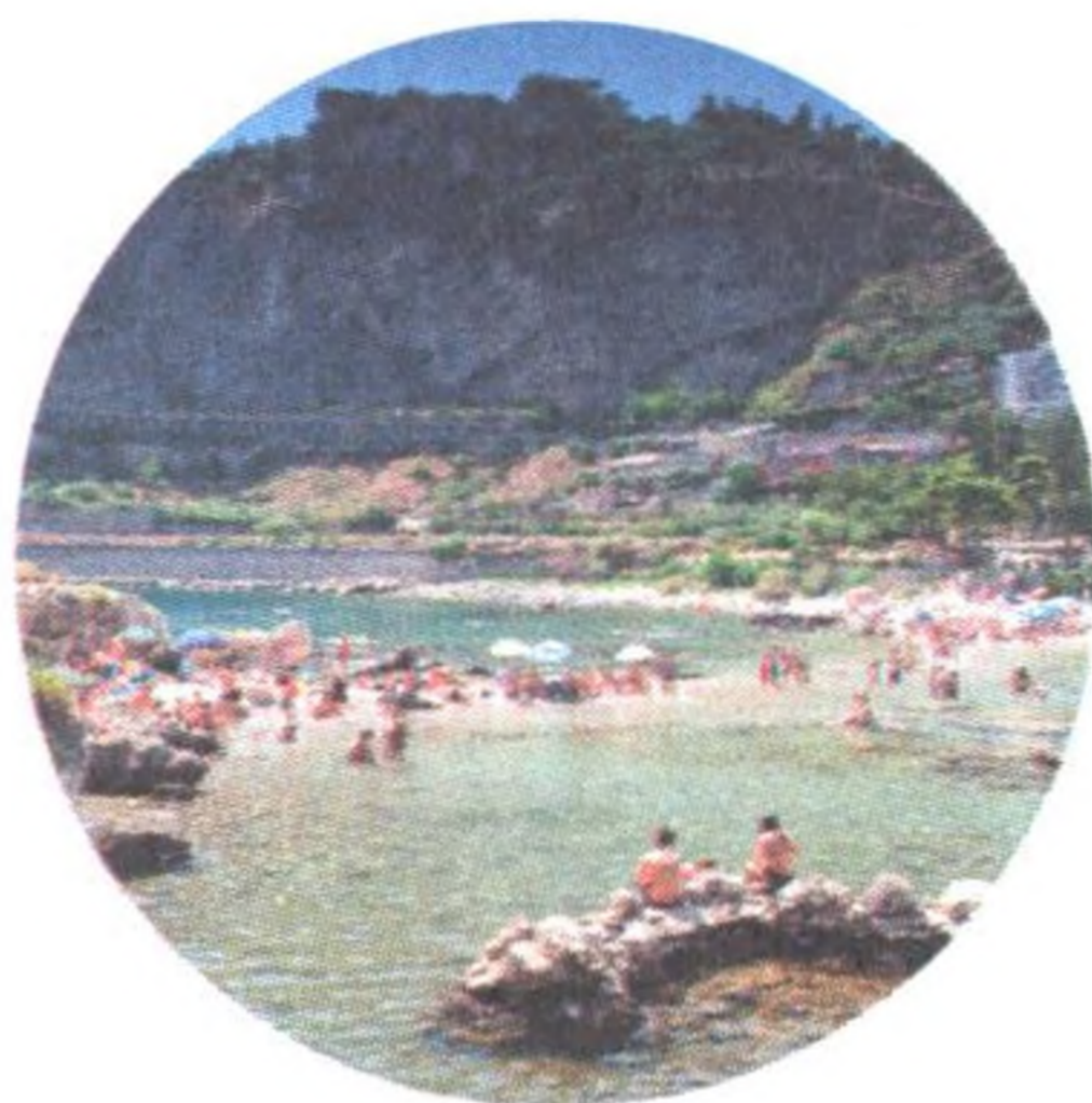
Isola Bella (str. 159), Taormina