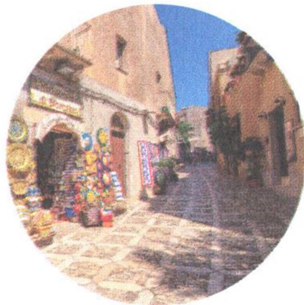
Erice (str. 93)