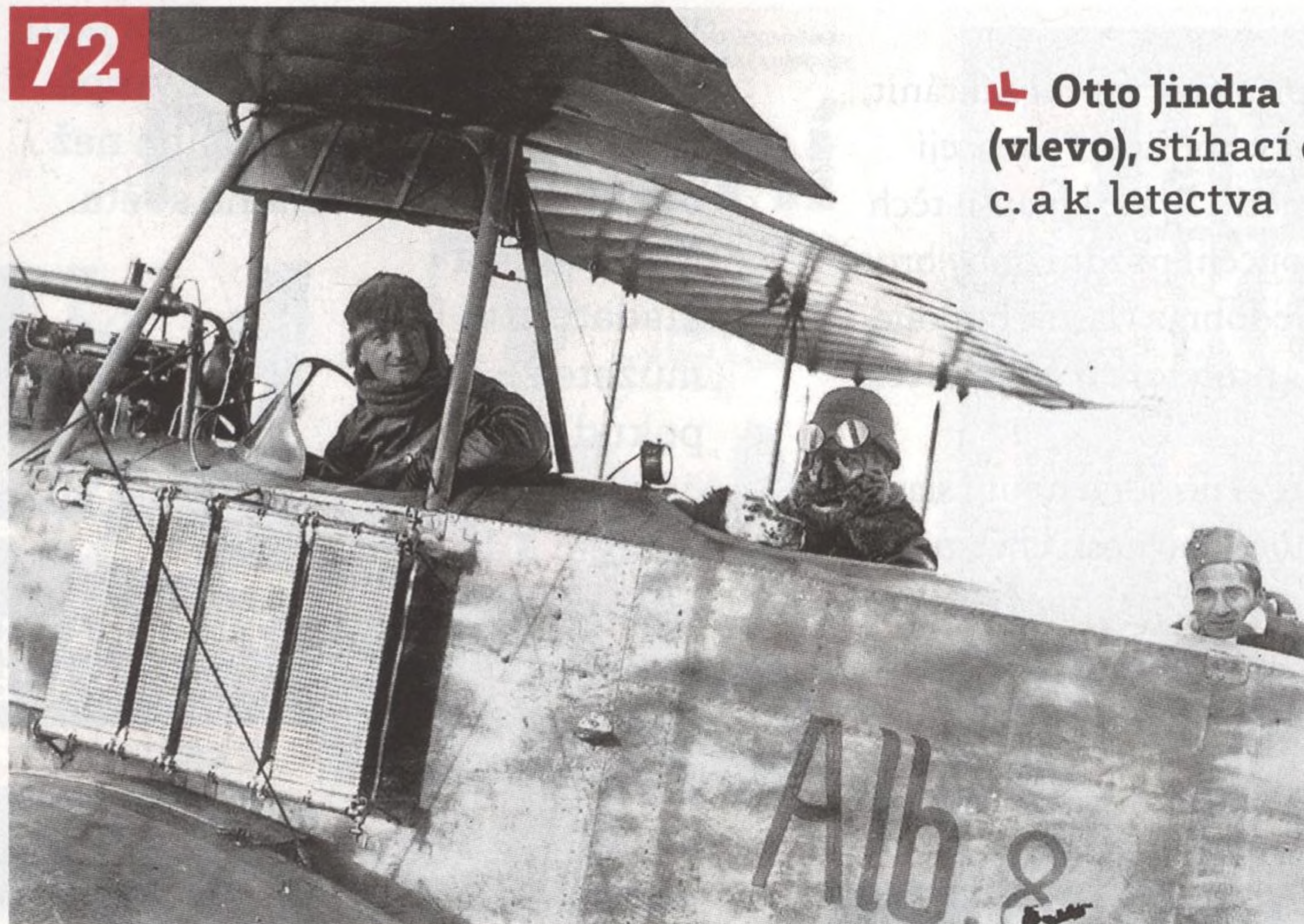
↳ Otto Jindra (vlevo), stíhací eso c. a k. letectva