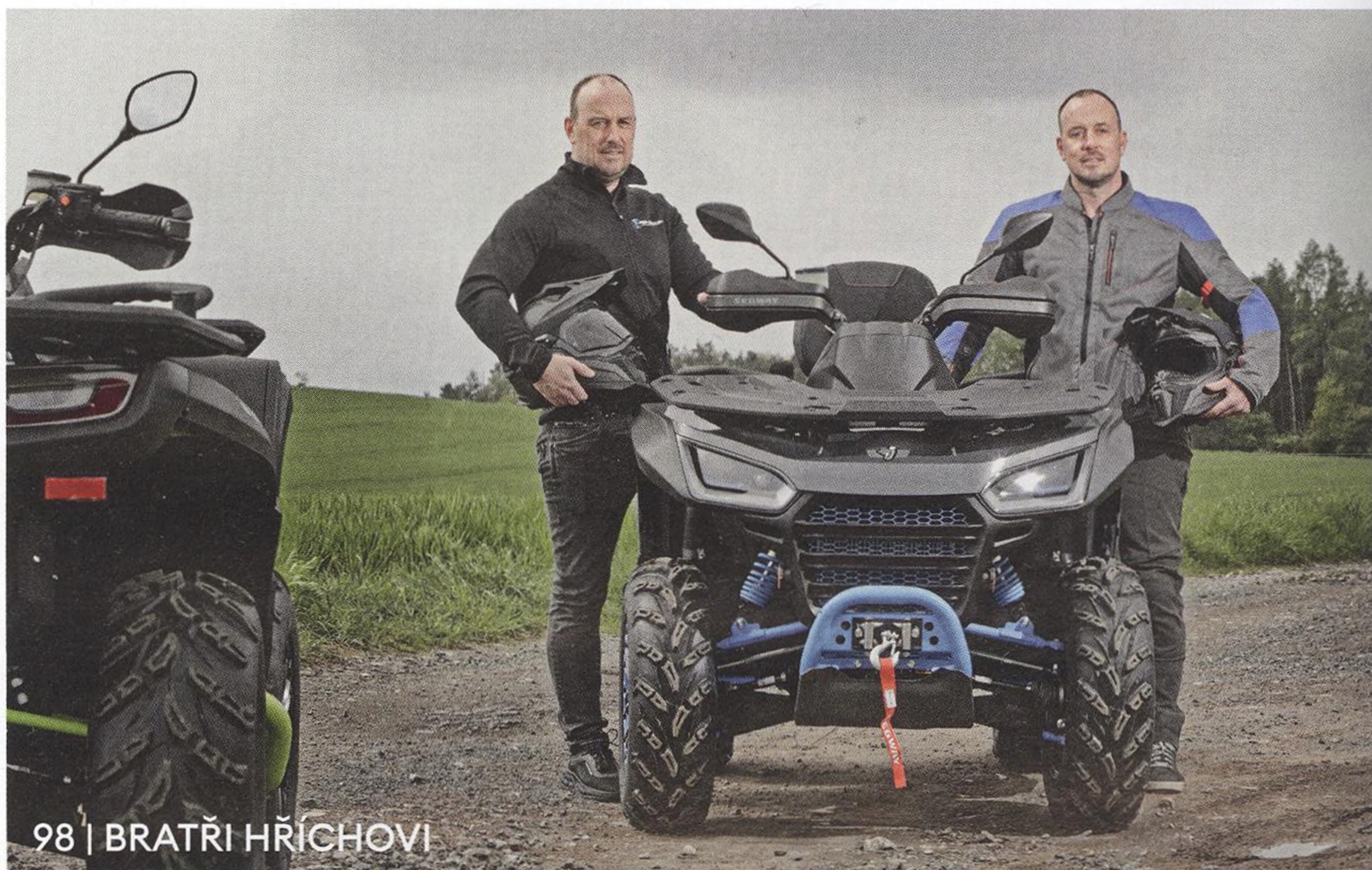
98 | BRATŘI HŘÍCHOVI