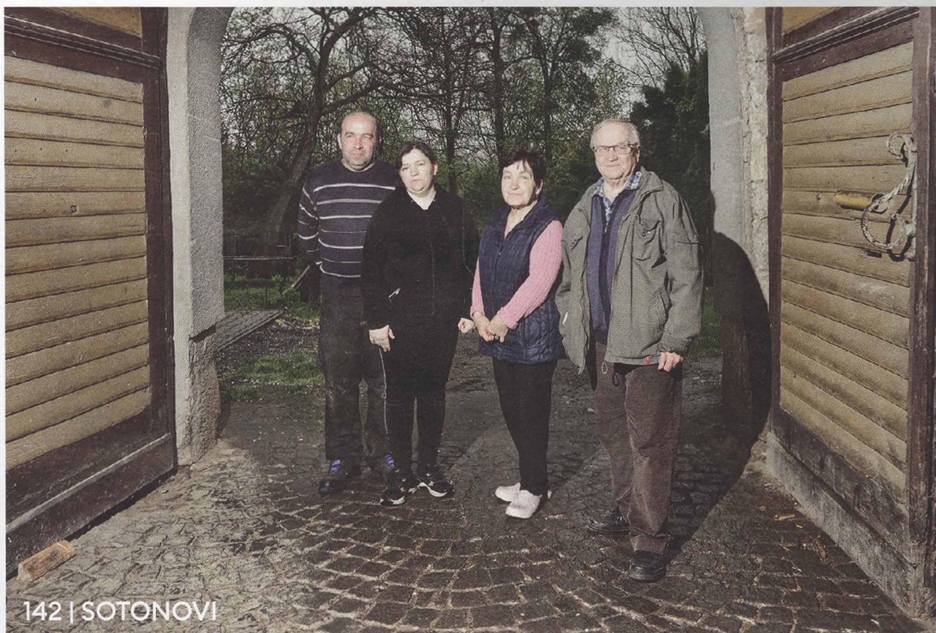
142 | SOTONOVÍ