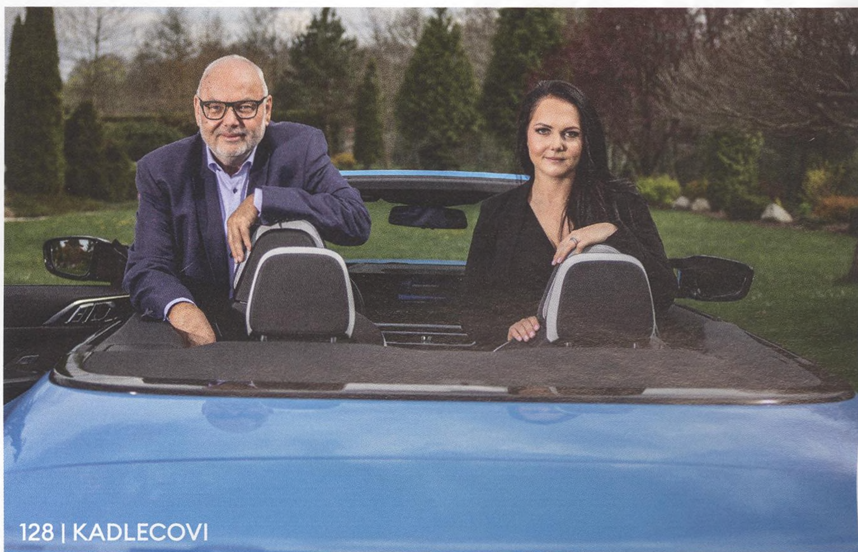
128 | KADLECOVI