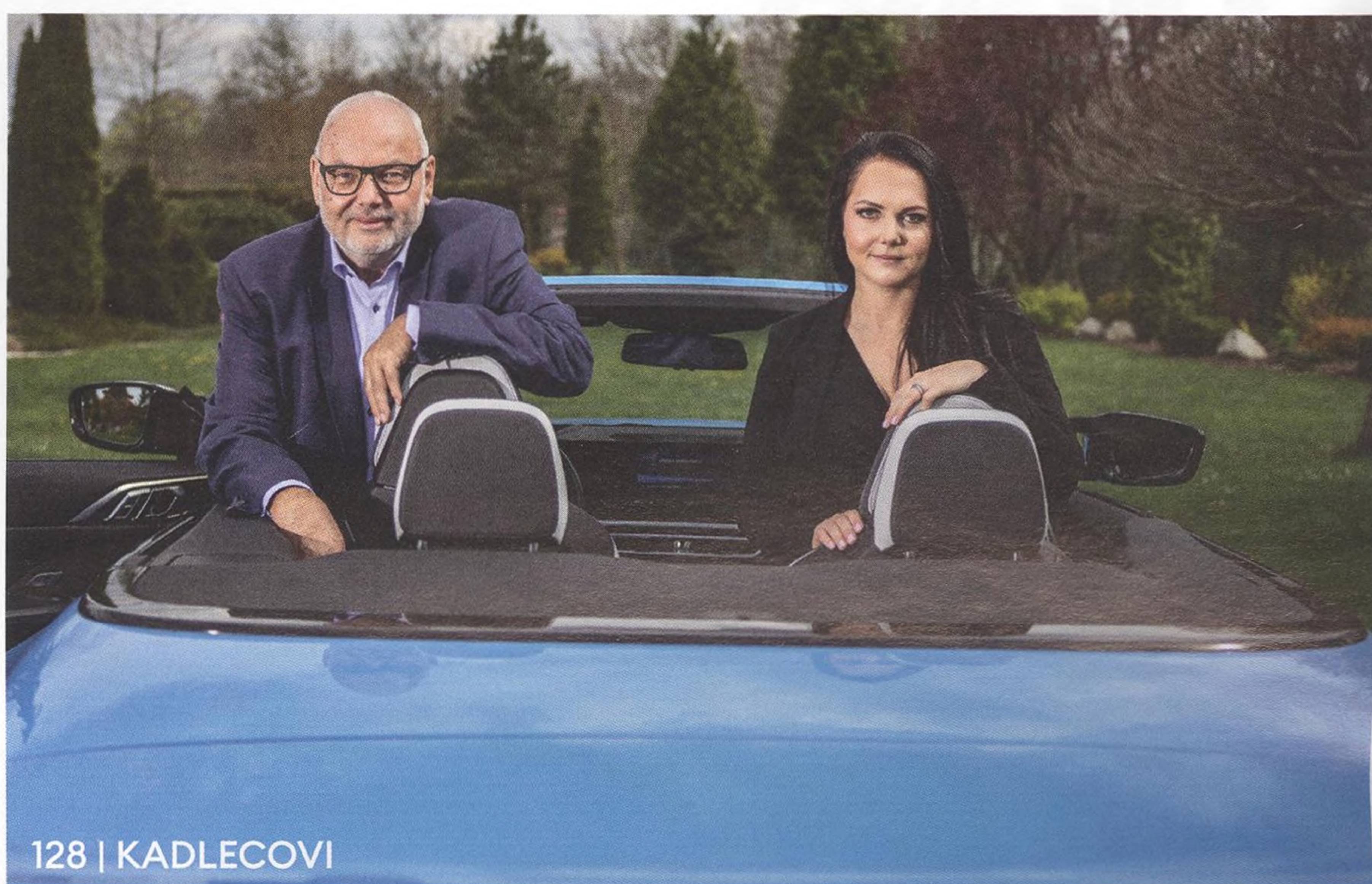
128 | KADLECOVI