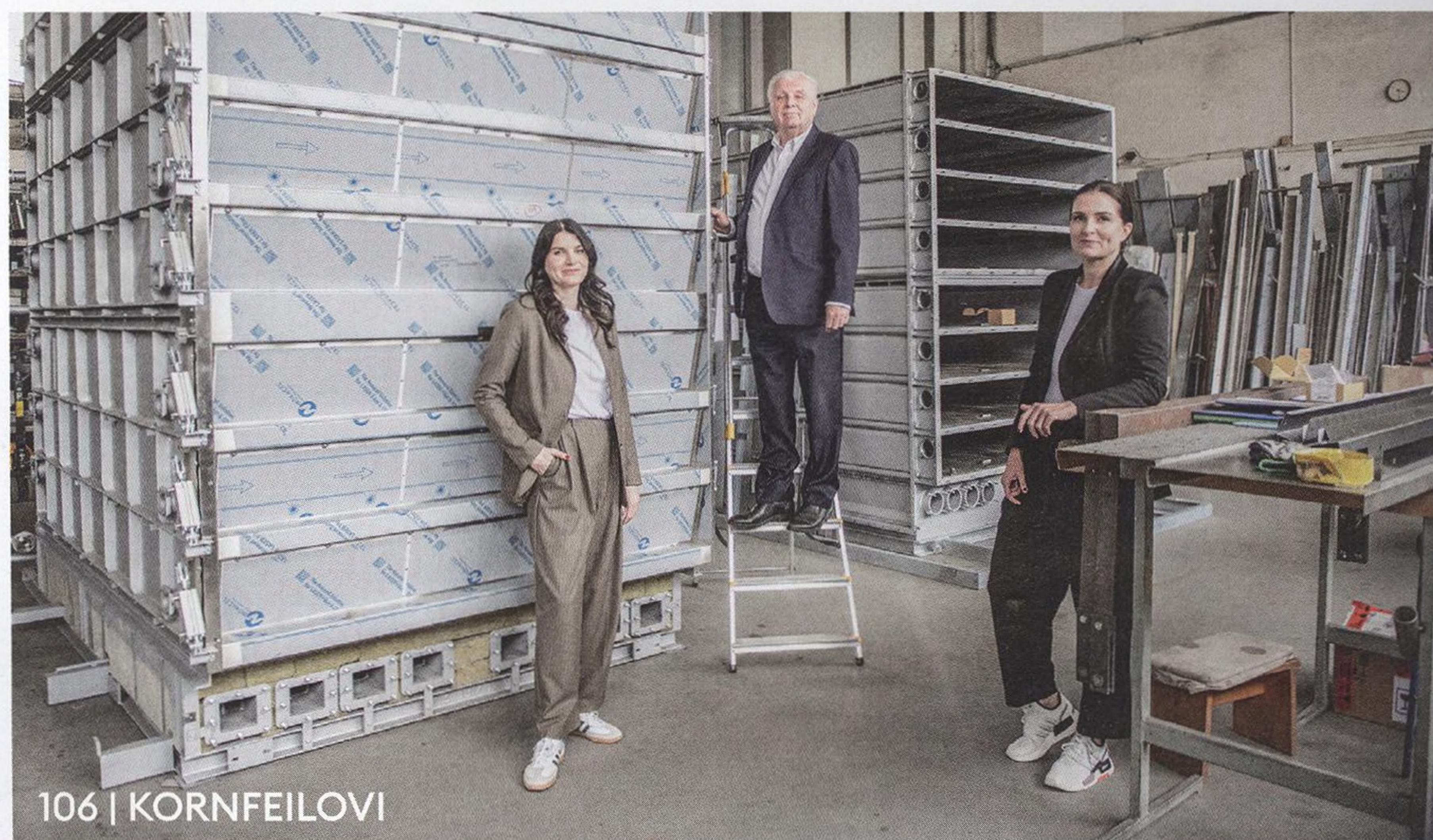
106 | KORNFEILOVI