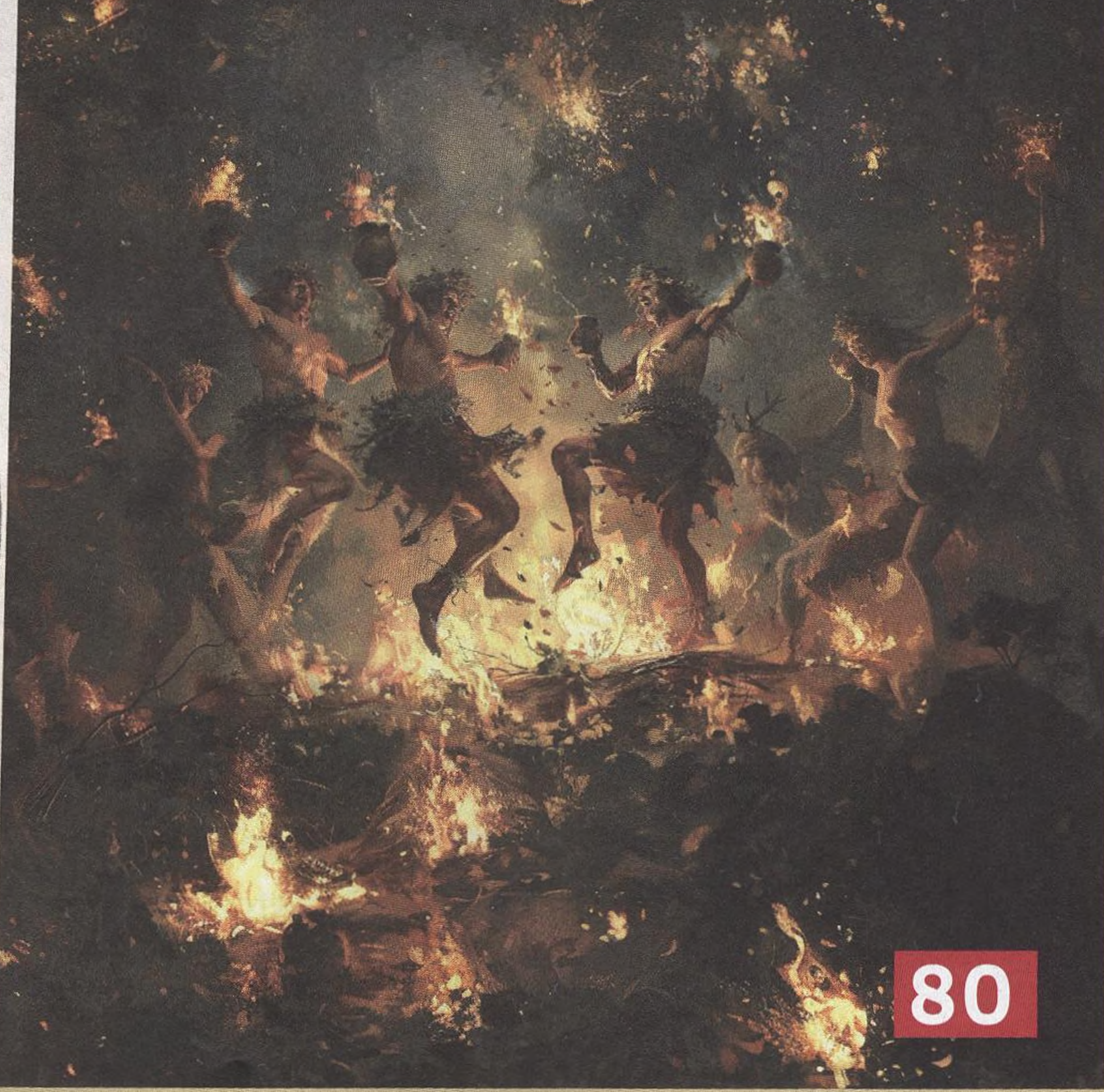
» Divoké oslavy letního slunovratu na vyobrazení vytvořeném pomocí umělé inteligence

80 Nevázané oslavy léta Křesťanská církev rázně zasahovala proti lidovým oslavám starých Slovanů. K nim patřil i letní slunovrat nabitý erotikou