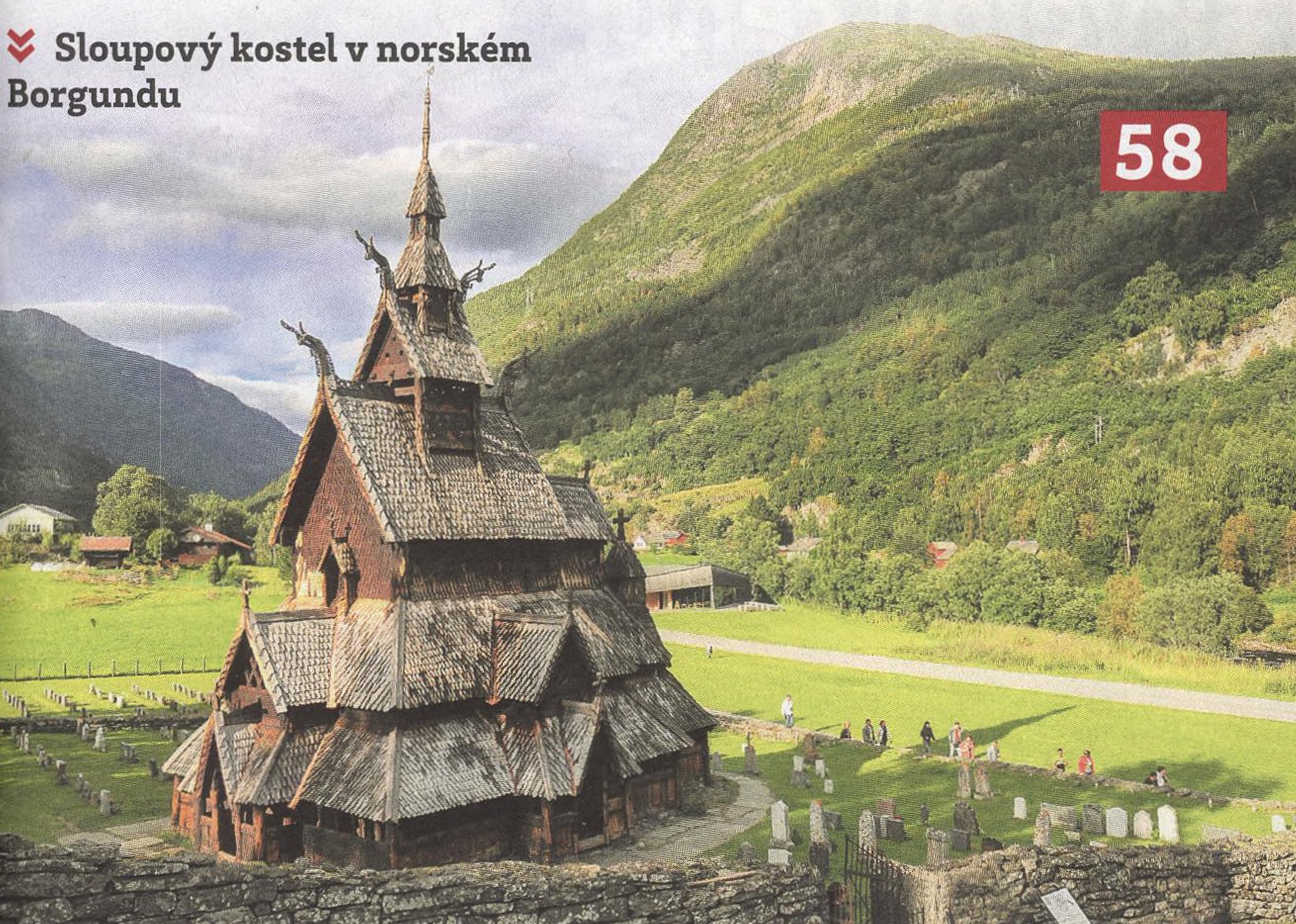
» Sloupový kostel v norském Borgundu

58 Svatostánek s dračími hlavami Dokladem prolínání pohanství a nastupujícího křesťanství ve vikinském Norsku dodnes zůstává sloupový kostel v Borgundu zdobený runovými nápisy a draky