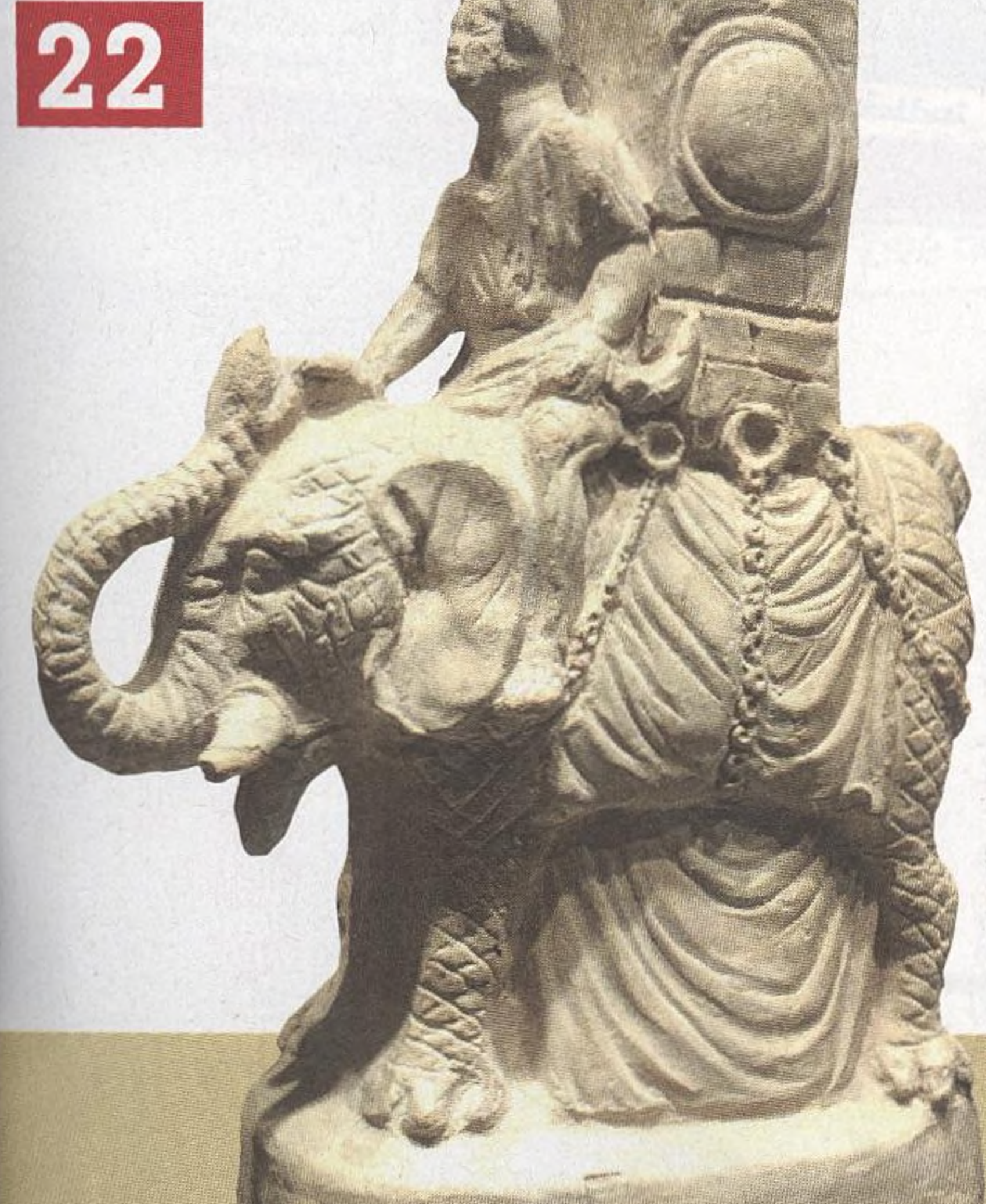
» Římská terakotová socha válečného slona s věží připevněnou řetězy z 1. století, nález z Pompejí