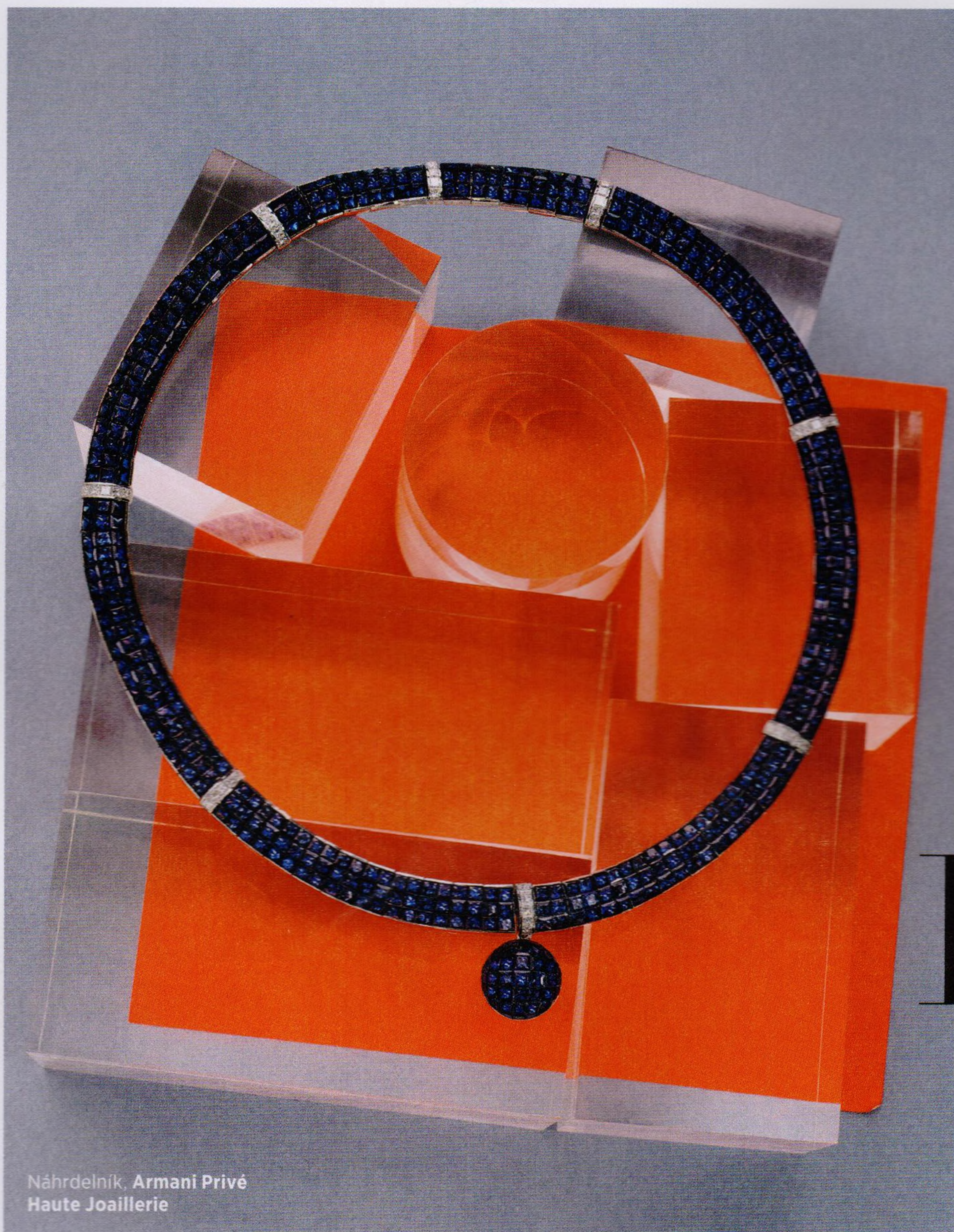
Náhrdelník, Armani Privé Haute Joaillerie

V zátiších se potkávají nejluxusnější šperky s těmi nejprostšími rekvizitami.