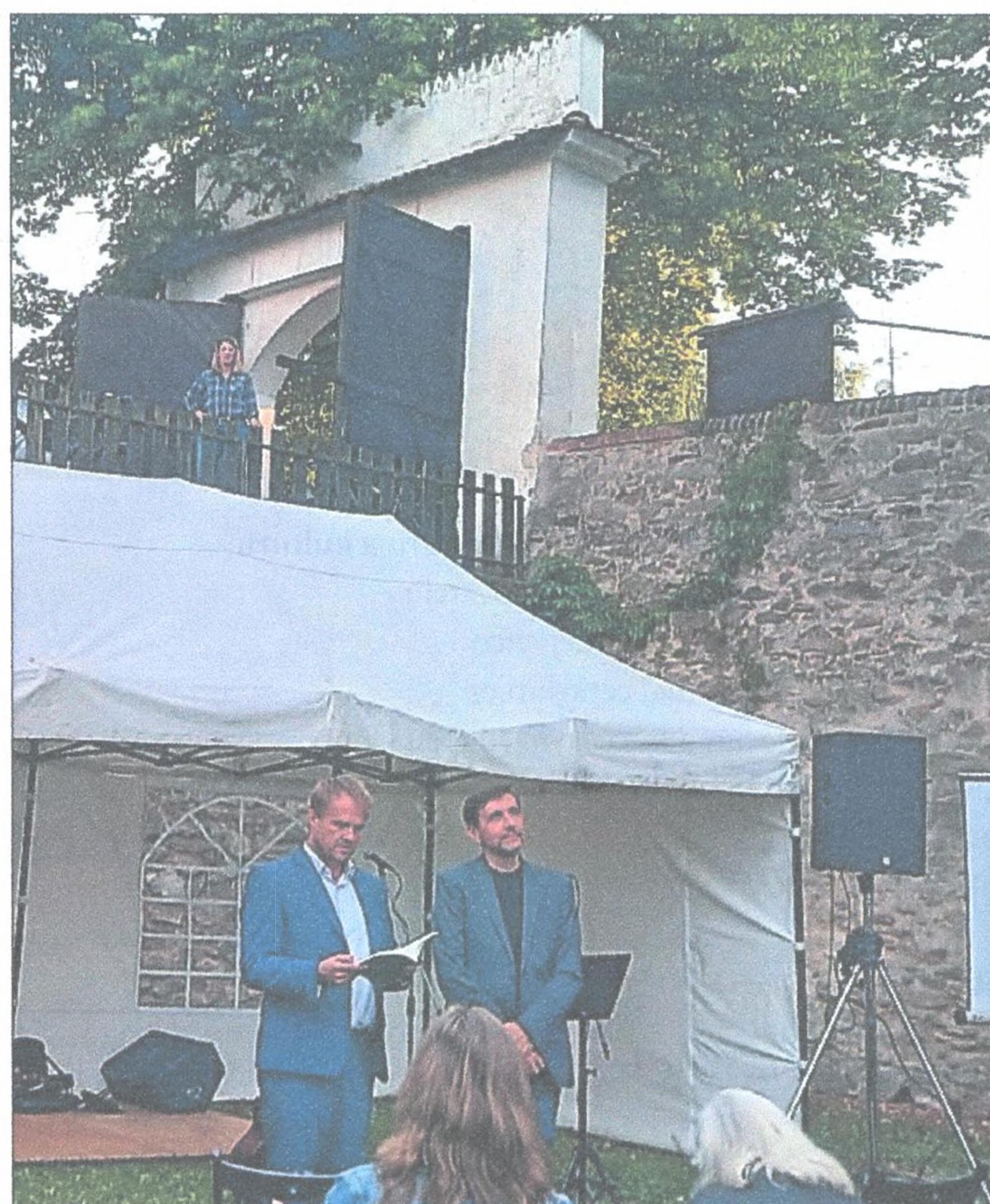
Zeyerovy Vodňany 2023