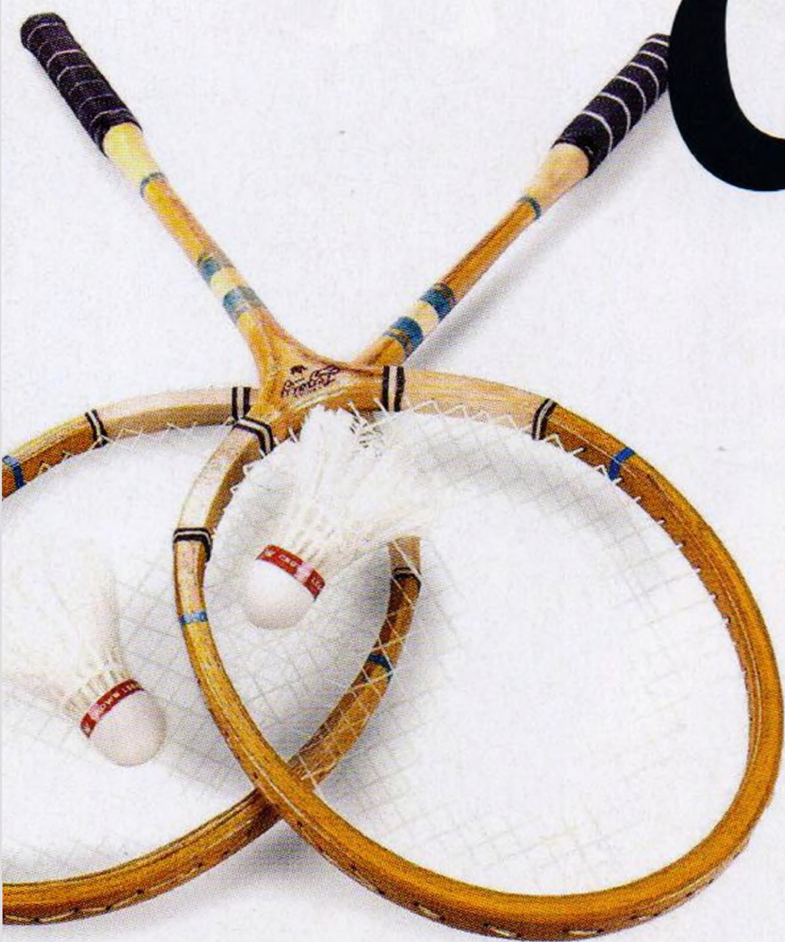
Česká chalupa vrací úder str. 127

bud'te skandální 12 musíme na vzduch 16 to bychom si dali 18 internety 20 fakt vrchol 24 program na ochranu svědků 46 a barry keoghan je váš 48 kouzla a čáry 50 best of karla gotha 52 tak ta jde teda dost dolů 54 sbalte sami sebe 62 ugh, období sucha 66 nebojte, nic neucítíte 68 (be)au(ty) dience u belgické princezny 70 tip top tipy 71 to je zase story 74 jestli si dokola nedáváte espresso, děláte něco špatně 84 láska na první pohled je fake vuittonka 94 kdyby měla marie terezie vibrátor na dálku, kde jsme dneska mohli být 98 s mulletem na rande 100 když kocour není doma, nosí myš jeho oblečení 102 jako nemusíme mít zas všechno 104 do-re-mi-fa-sol-la-si-konečně- idol 106 ne, díky 110 check-in 114 skelný pohled 116 když hvězdy radí 118 dorůžova 120 kde být pěkně ofouklý 124 žádný čajíček 126 tousták náš vezdejší 128 wtf 138