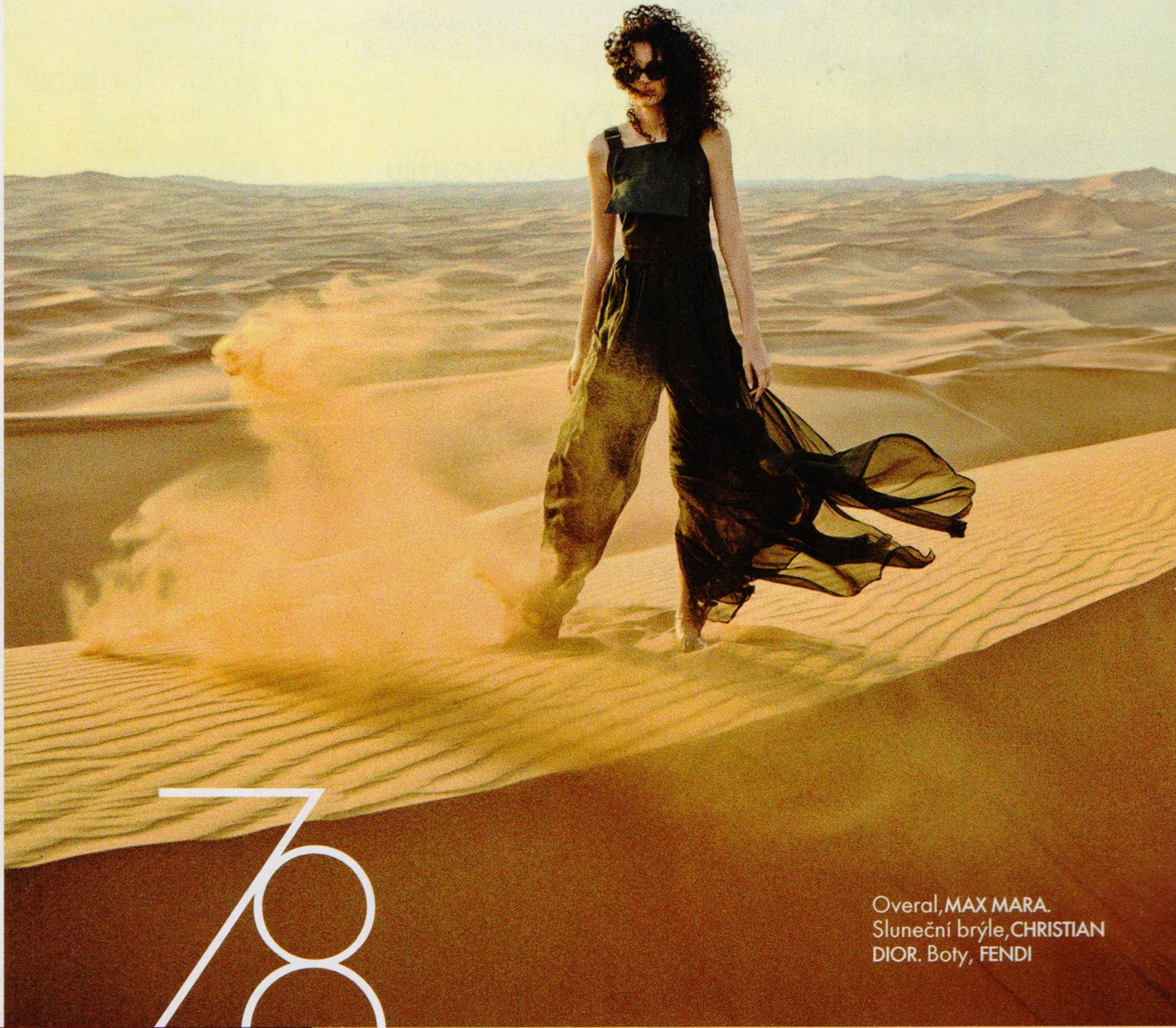
Overall, MAX MARA. Sluneční brýle, CHRISTIAN DIOR. Boty, FENDI