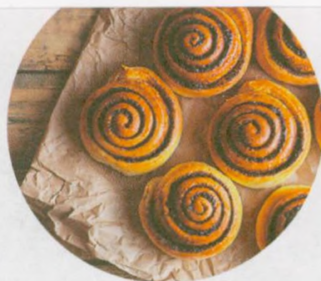
Kanelbule (str. 37)