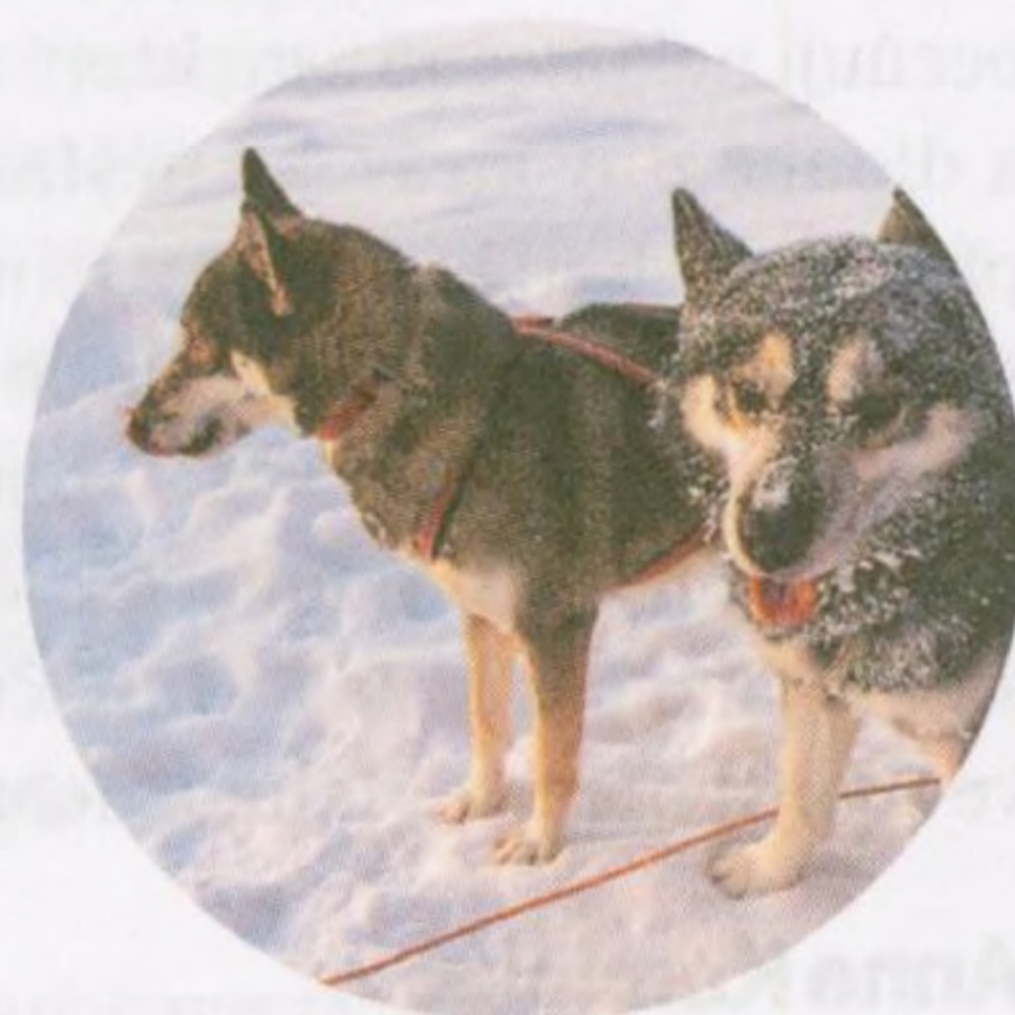
Psi husky, Jokkmokk (str. 222)