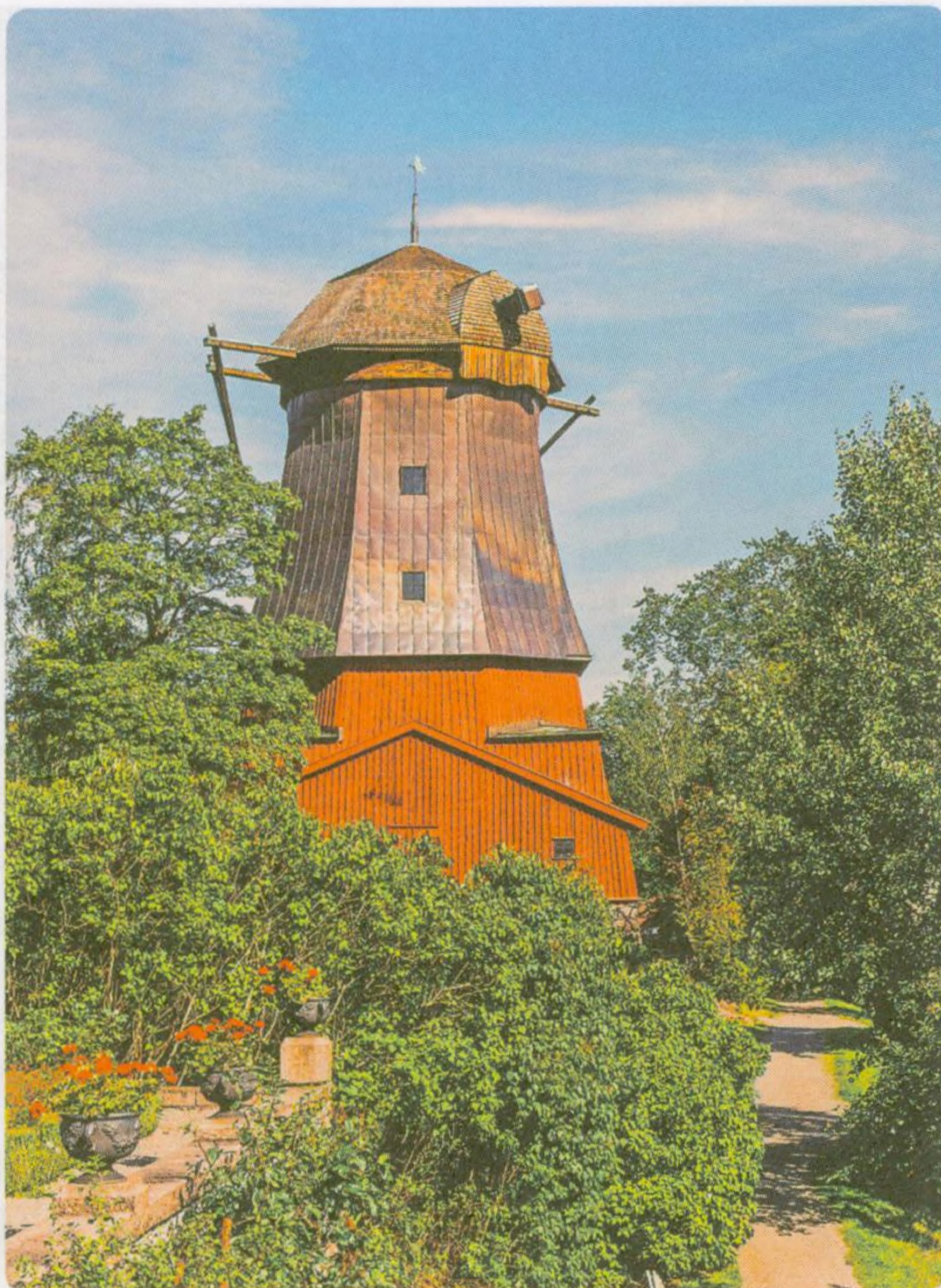
Ostrov Djurgarden, Stockholm (str. 74)